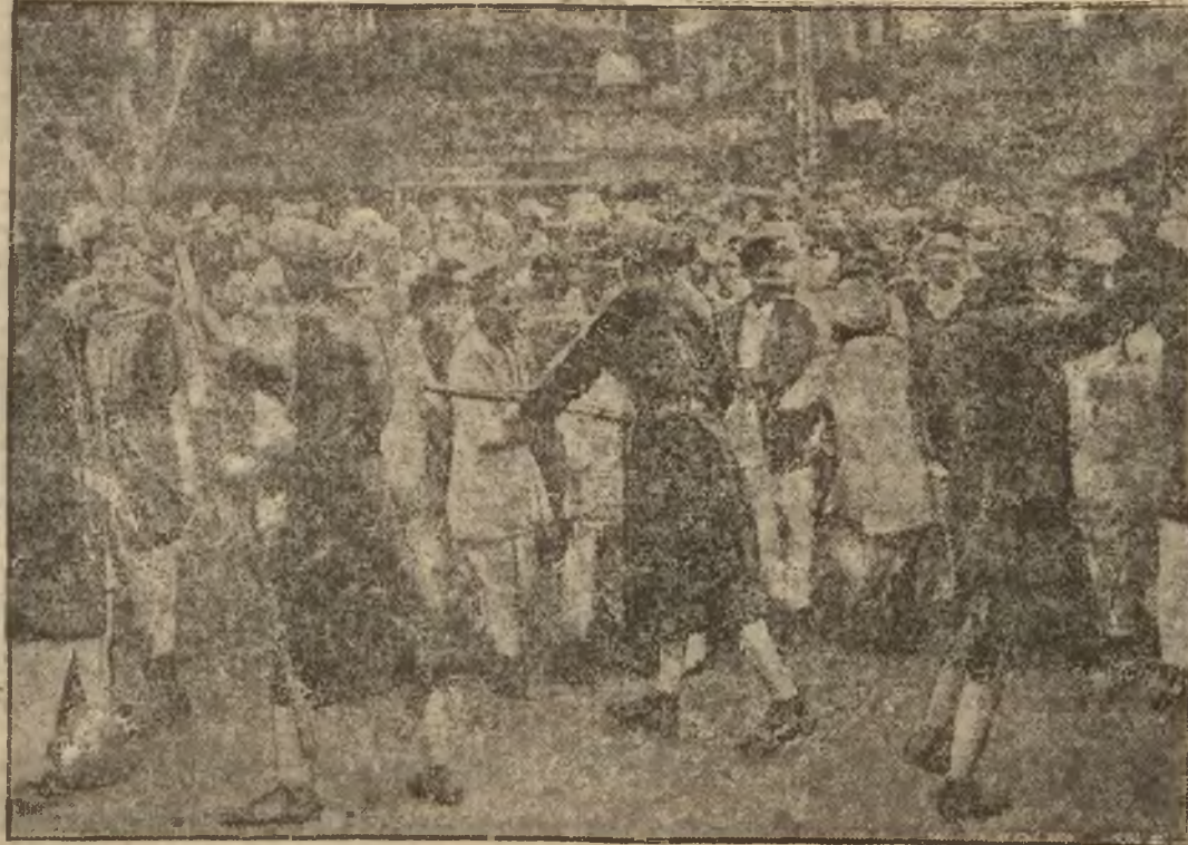
są energicznie tłumione przez policję. Na zdjęciu widzimy scenę, gdy policja złożona z tubylców rozprasza demonstrantów w Delhi.