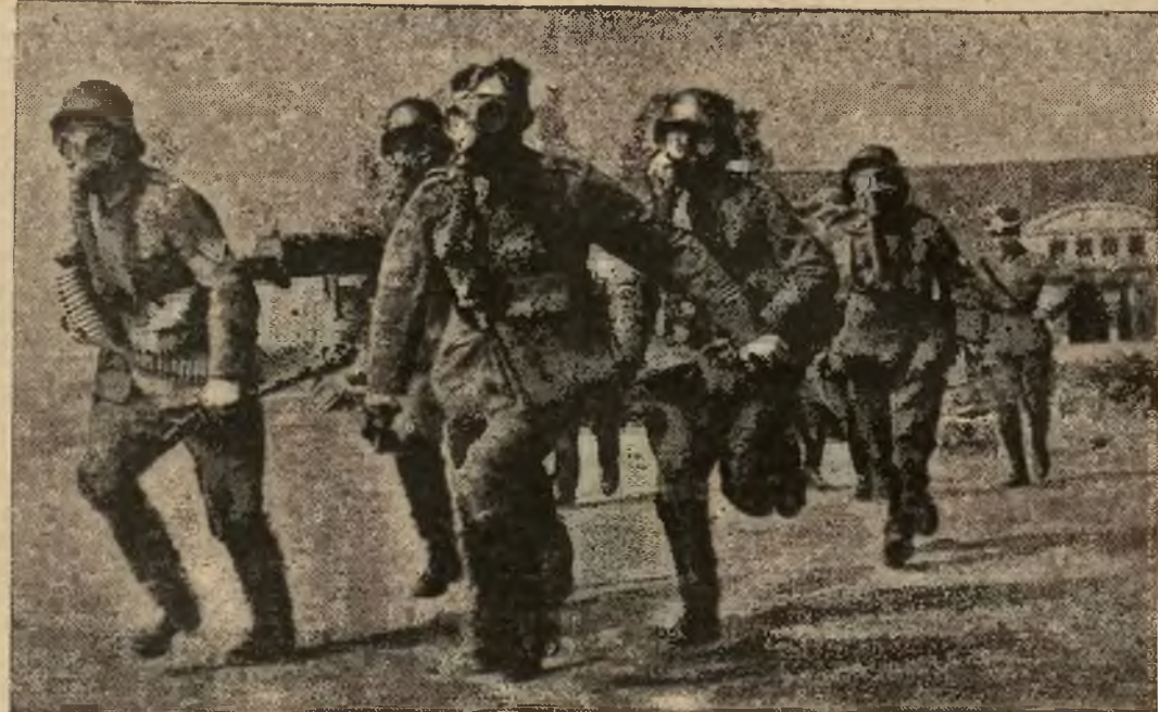
Mimo zapewnień o pokoju, Niemcy zbroją się i ćwiczą swe oddziały wojskowe, kryjące się pod płaszczykiem najrozmaitszych organizacji. Ilustracja przedstawia oddział karabinów maszynowych w maskach gazowych podczas ćwiczeń.