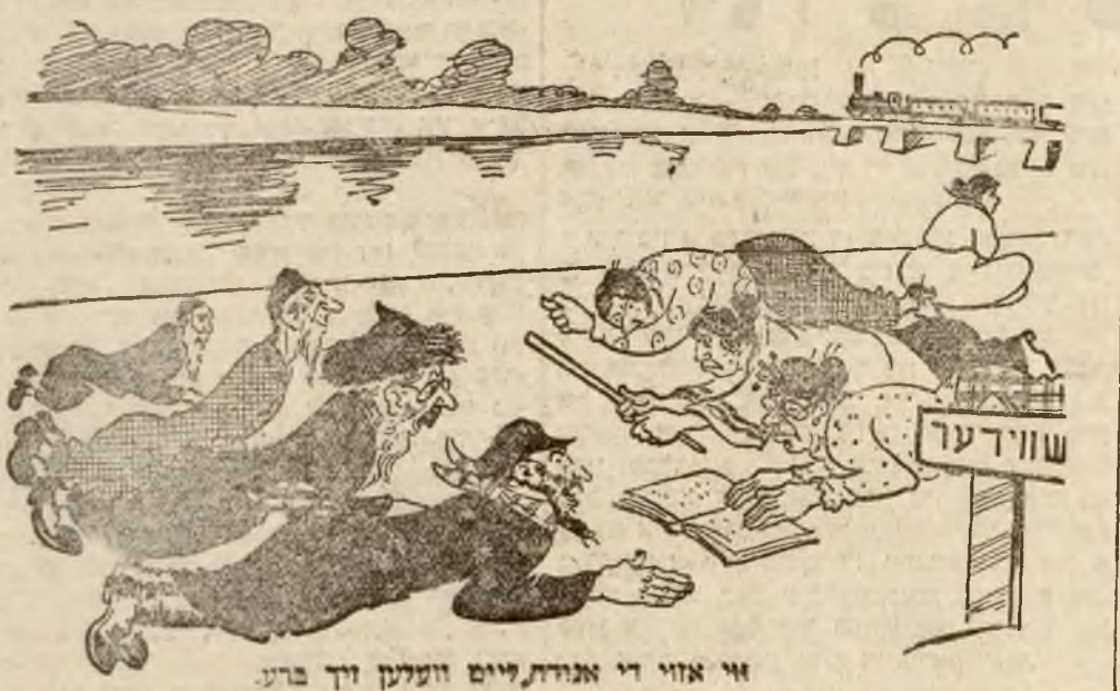
זי אזוי די אנהער, לויט וועלען זיך ברע- נען.