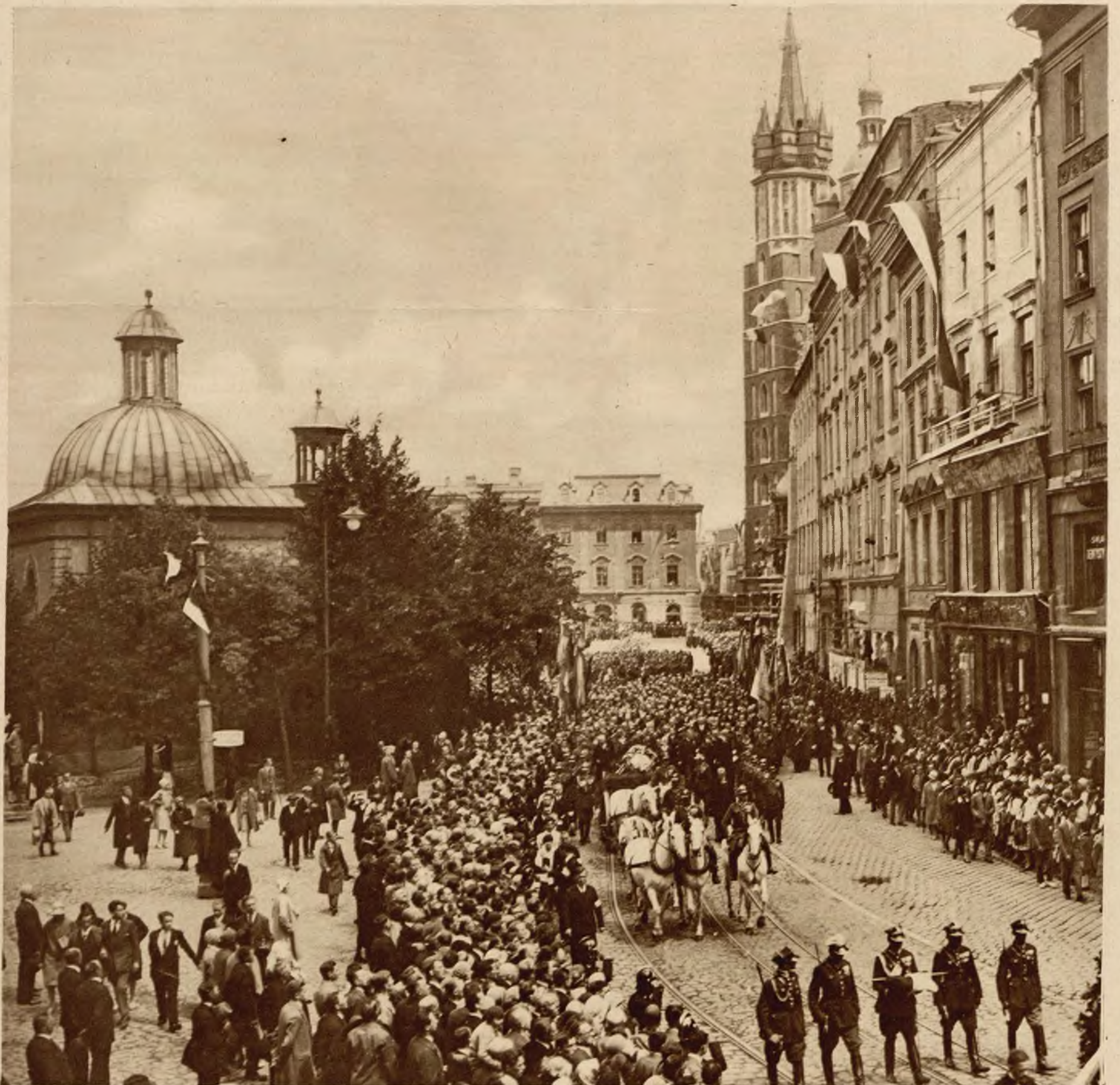
Sprowadzenie zwłok gen. Bema. Kondukt żałobny posuwa się Rynkiem krakowskim w stronę Wawelu.