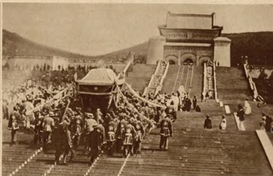
Szczaćki pierwszego prezydenta Chin Sun-Yat-Sen'a przewieziono uroczystie z Pekinu do wspaniałego mauzoleum w Nankinie. Na lewo udekorowany okręt wiozący zwłoki, na prawo ostatni etap pogrzebu w drodze do grobowca.