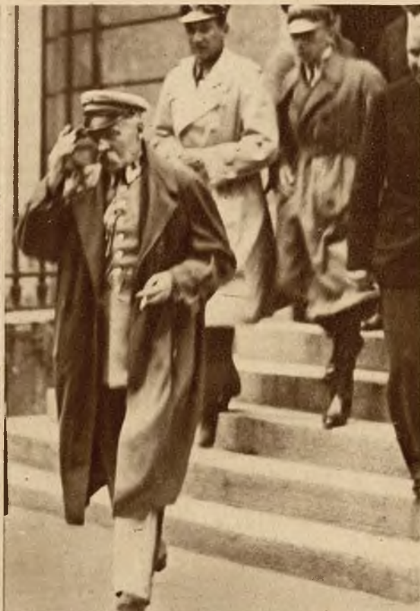
Z procesu ministra Czechowicza. U góry: Trybunał stanu w czasie przemówienia mec. Paschalskiego. Na prawo: Marszałek Piłsudski opuszcza gmach sądu po złożeniu zeznań.