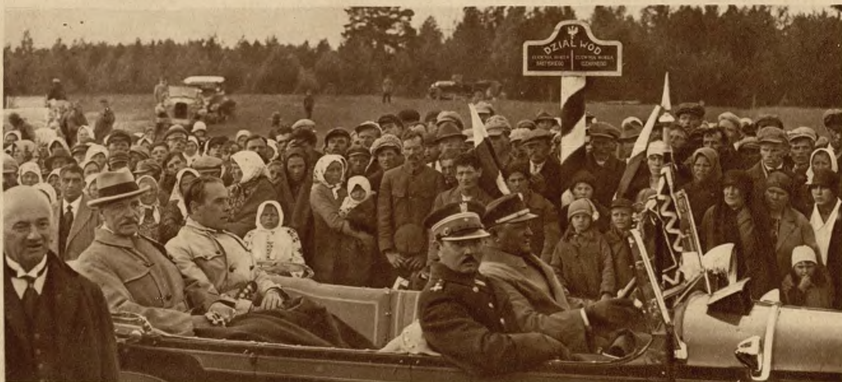
P. prezydent Mościcki w towarzystwie wojewody wołyńskiego Józefskiego, w miejscu gdzie graniczy zlew wód morza Bałtyckiego i Czarnego.