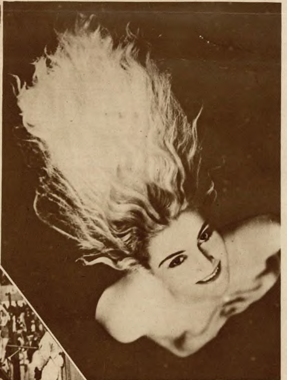
Rewja kostjumów kąpielowych w Tourelles pod Paryżem.