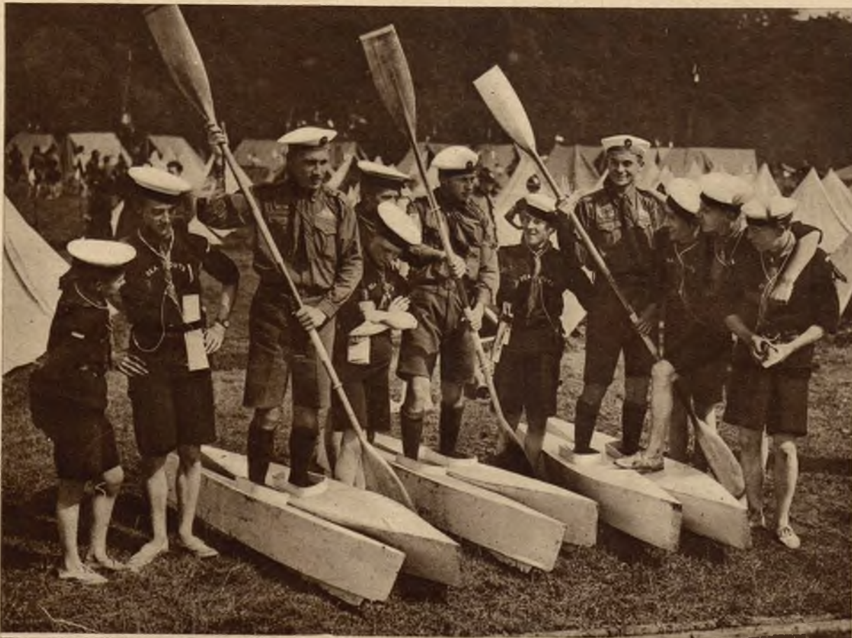
Na lewo: Ze zjazdu harcerskiego w Anglii. Węgierscy harcerze wodni prezentują angielskim harcerzom morskim swe wodne narty.