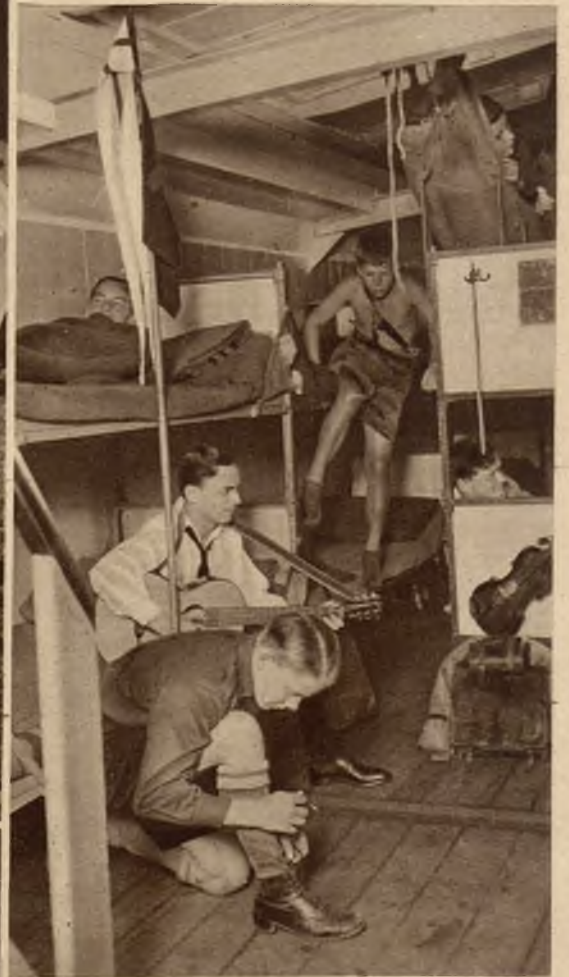
Wnętrze statku wycieczkowego, który służy młodzieży niem. w czasie wakacji jako schronienie.