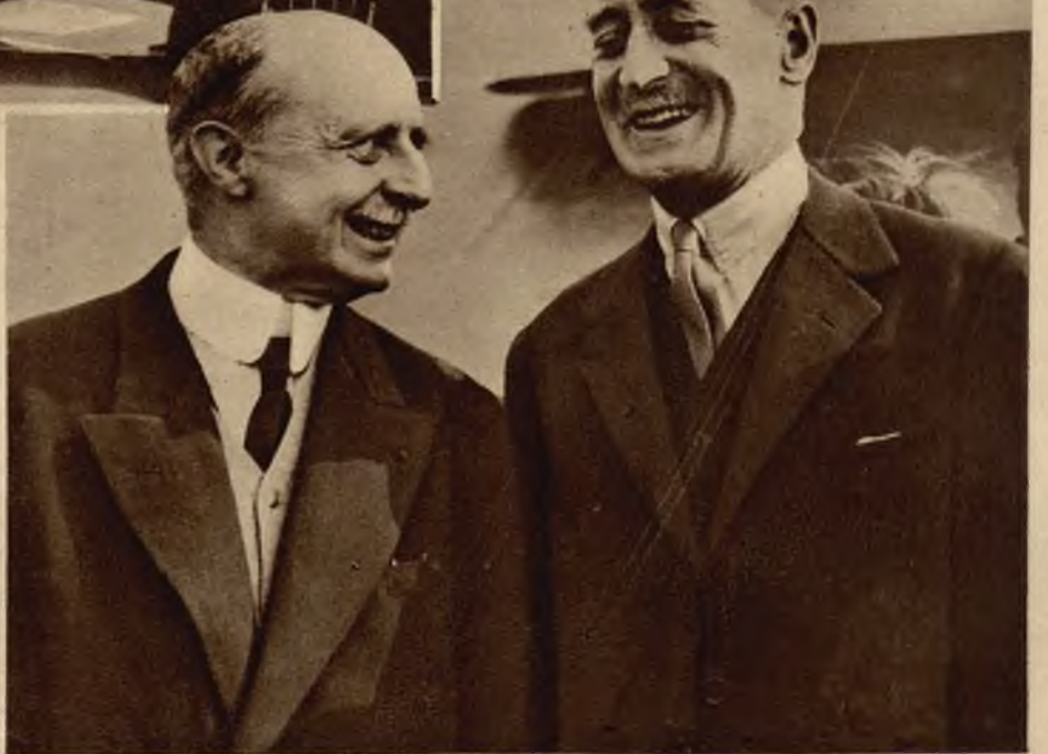
Bleriot (na lewo) po swym jubileuszowym locie przez kanał La Manche przyjęty został przez ang. min. lotnictwa Thomsona.