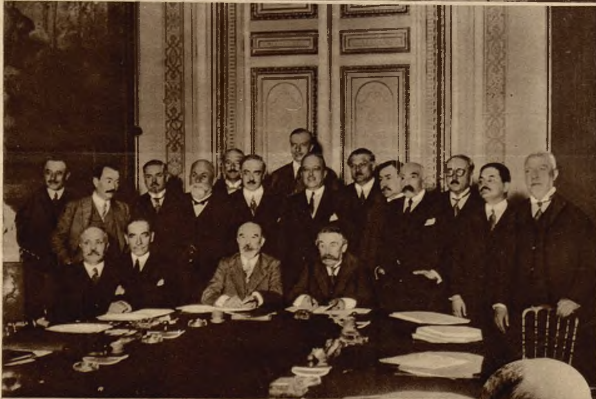
Na lewo: Prezydent ministrów Briand w otoczeniu swego, nowo utworzonego gabinetu.