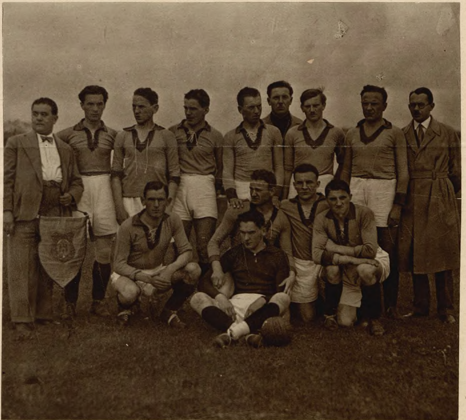
Mecz piłki nożnej Kraków-Lwów o srebrną wazę Żeleńskiego i wieniec laurowy „Gazety Porannej” zakończył się zwycięstwem Lwowa 7:5. Zdjęcie nasze przedstawia zwycięską drużynę lwowską na boisku w Krakowie.