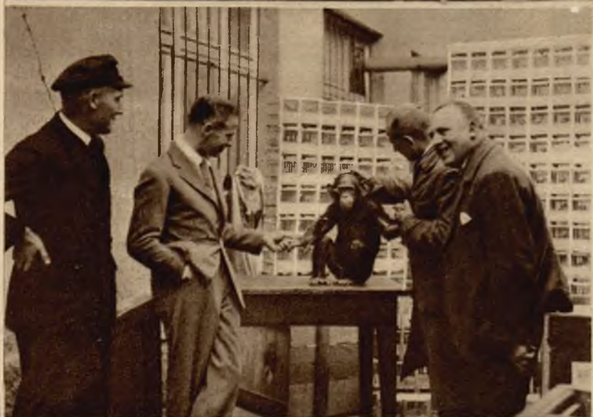
W Zeppelinie w czasie jego przelotu nad Atlantykiem znajdował się młody goryl i 600 kanarków.