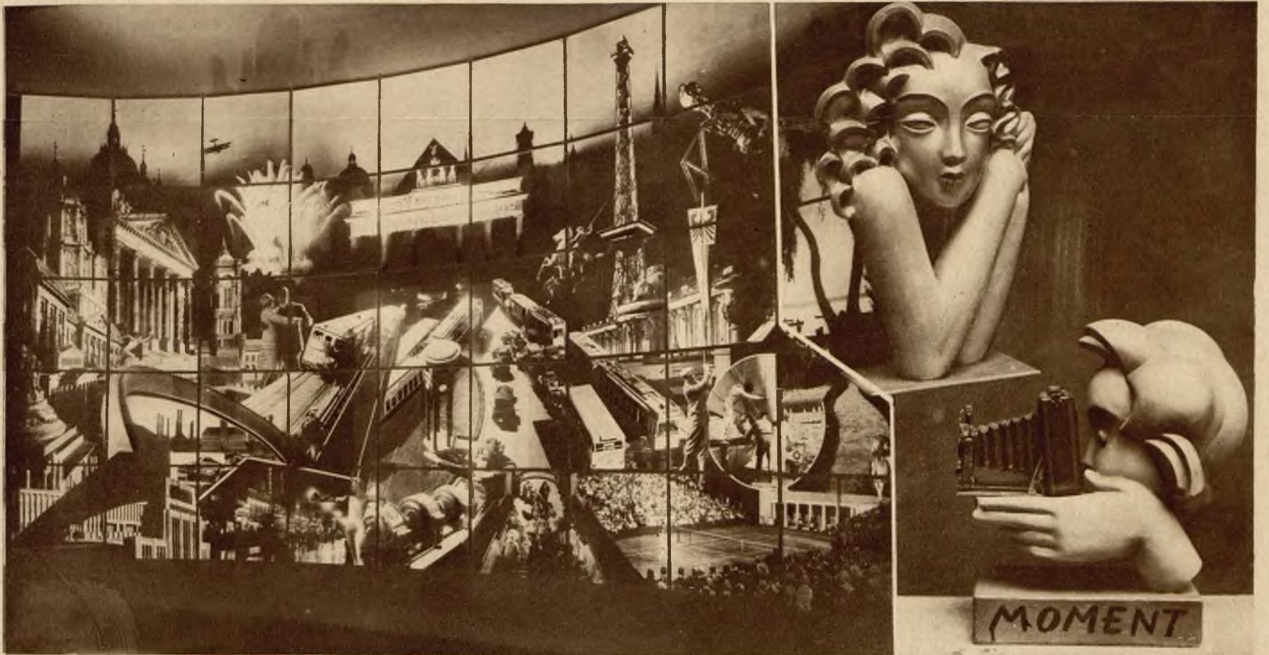
Oryginalny montaż fotograficzny znajdujący się na wystawie reklamy w Berlinie. Na prawo ciekawe plastyki z wystawy.