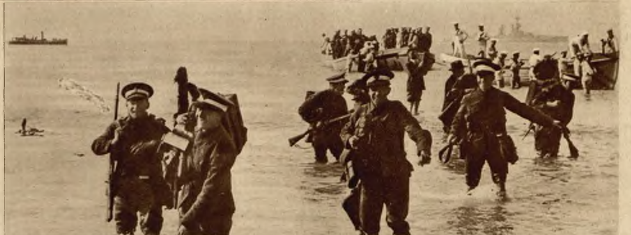
Obrazek z manewrów floty angielskiej ćwiczącej lądowanie wojska na niedostępnym wybrzeżu.