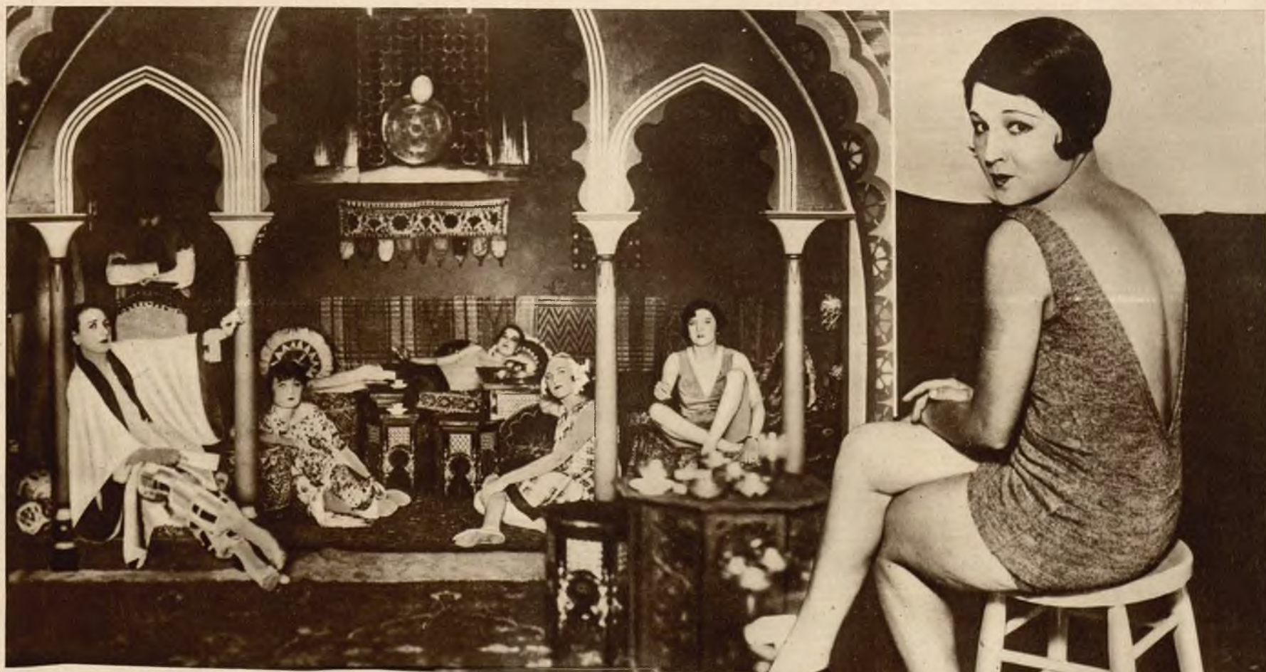
Luksusowa „komnata wschodnia“ w hotelu Ekscelsior na Lidce, w której goście hotelowi piją czarującą kawę.