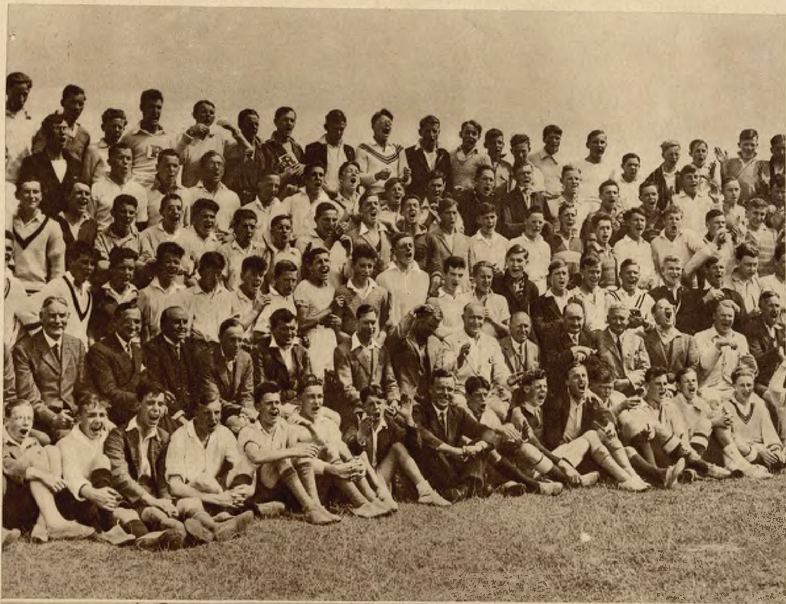
Książę Jorku, drugi syn króla angielskiego odwiedził obóz harcerski w New Romney. W czasie wizyty księcia dokonano zdjęć do filmu dźwiękowego z życia harcerzy. Zdjęcie nasze przedstawia moment „okrzyku obozowego“.