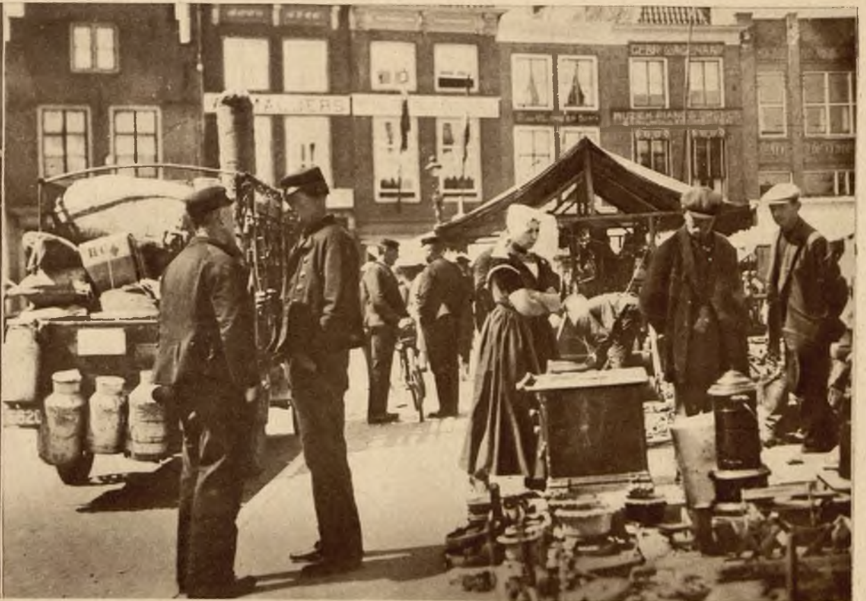
Obrazki z Holandji. Na lewo: Lalka, w stroju narodowym, którą pewna gazeta wysłała bez opieki na wystawę w Barcelonie. Lalka ma napisy na sobie z prośbą o opiekę i pomoc przy przesiadaniu oraz posiada bilety jak żywa osoba. Na prawo scena z targu w małym miasteczku.