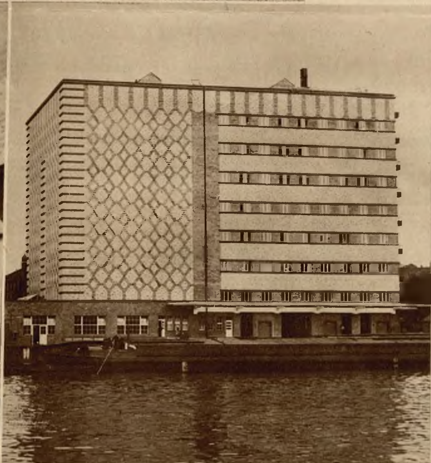
W Berlinie zbudowano obecnie największą i najnowocześniejszą urządzoną chłodnię przeznaczoną do przechowywania nabiału. Chłodnia mieści n. p. 75 milionów jaj i 160.000 cetrarów masła. U góry ogólny widok chłodni. Na lewo potężny kondensator służący do rozcieńczania stężonego amoniaku.