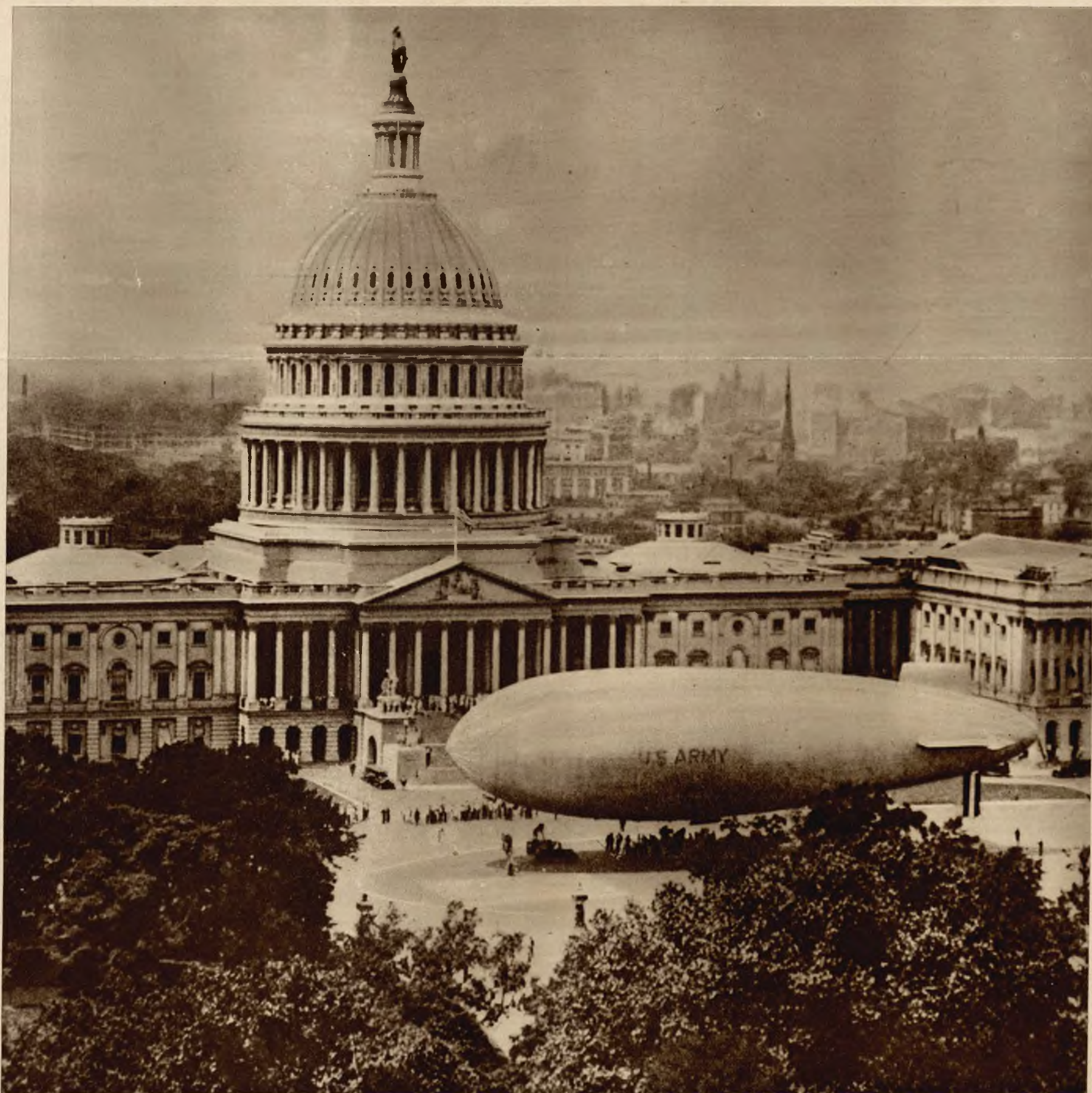
Amerykański balon wojskowy C-41 jest pierwszym sterowcem powietrznym, który wylądował na placu przed Kapitołem w Waszyngtonie.