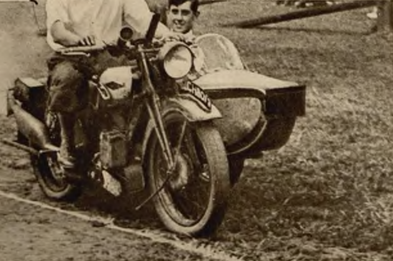
Na lewo: Scena z gymkhany motocyklowej w Derby (Anglja).