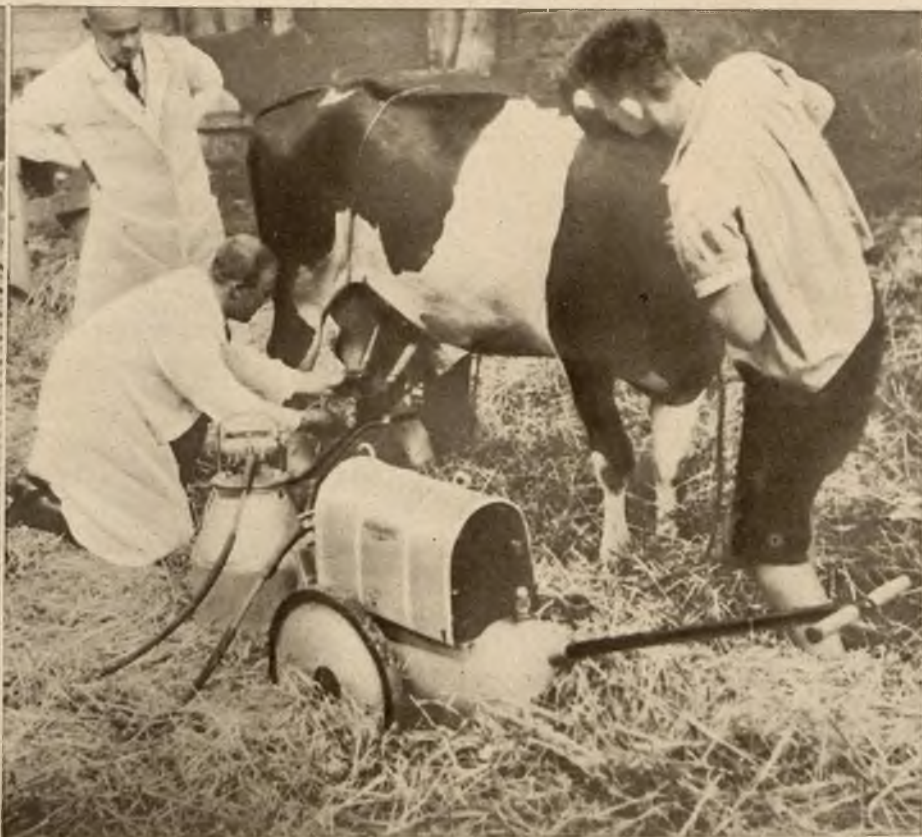
Nowy aparat elektryczny, którym można równocześnie doić dwie krowy.