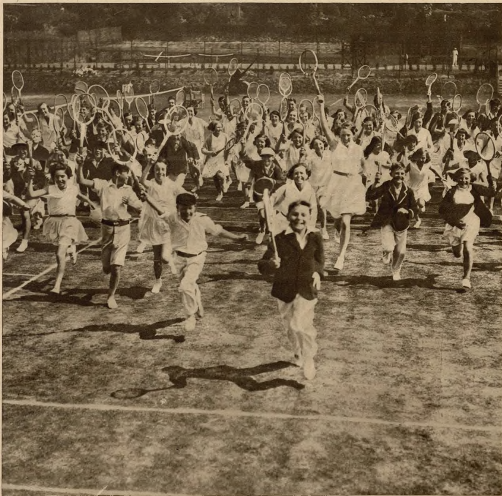
Przyszłe gwiazdy tenisu angielskiego w czasie turnieju dla młodzieży w Frinton-on-Sea „udają się” na posiłek.