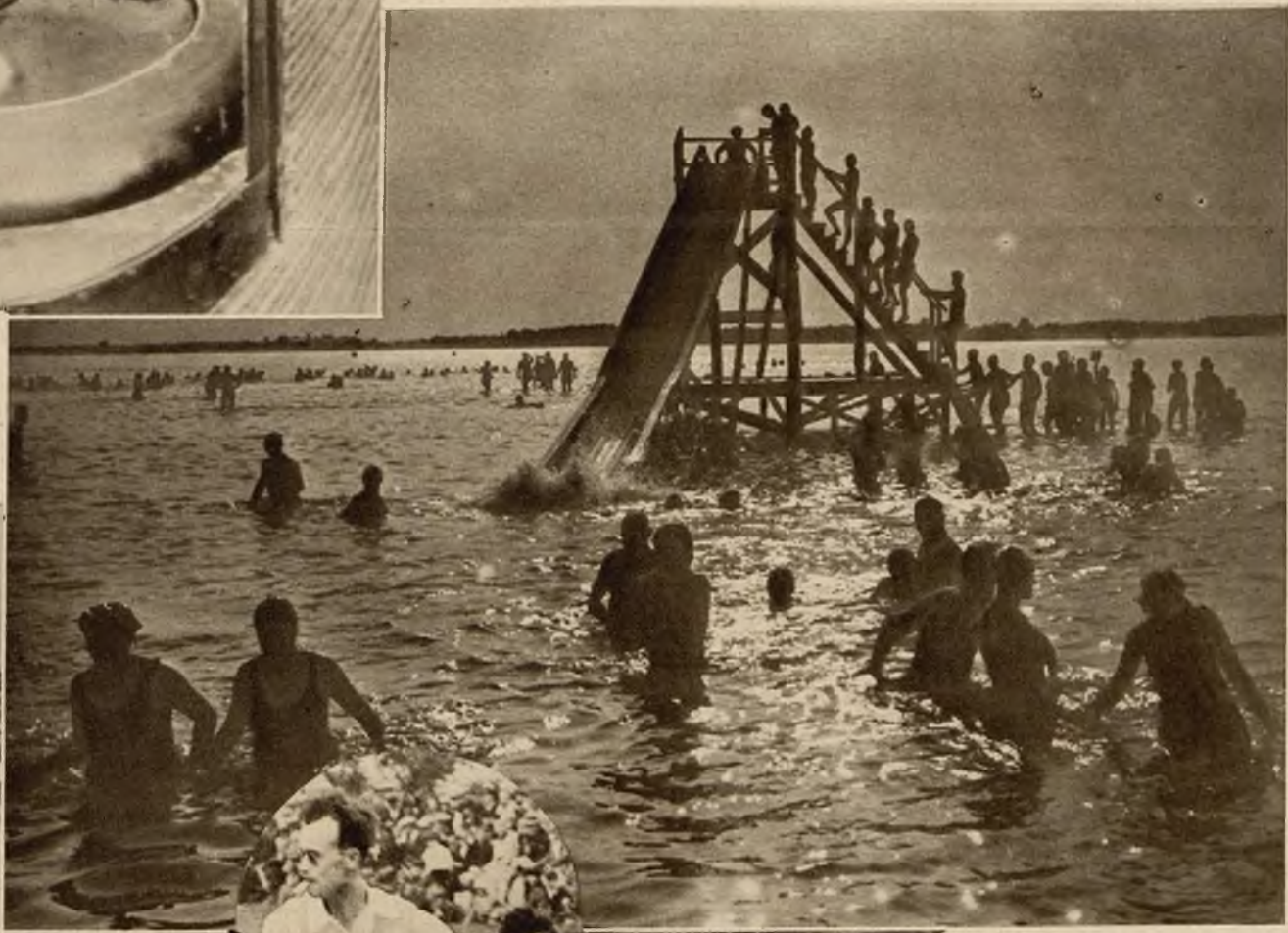
Kąpiel nocna na jeziorze Rangsdorf pod Berlinem.