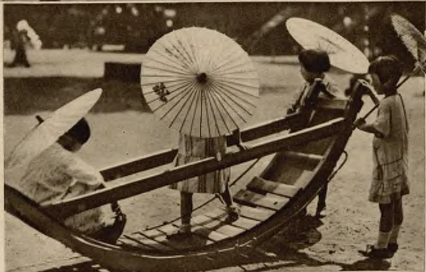
Na prawo: Zabawa dzieci w jednym z parków publicznych w Tokio.