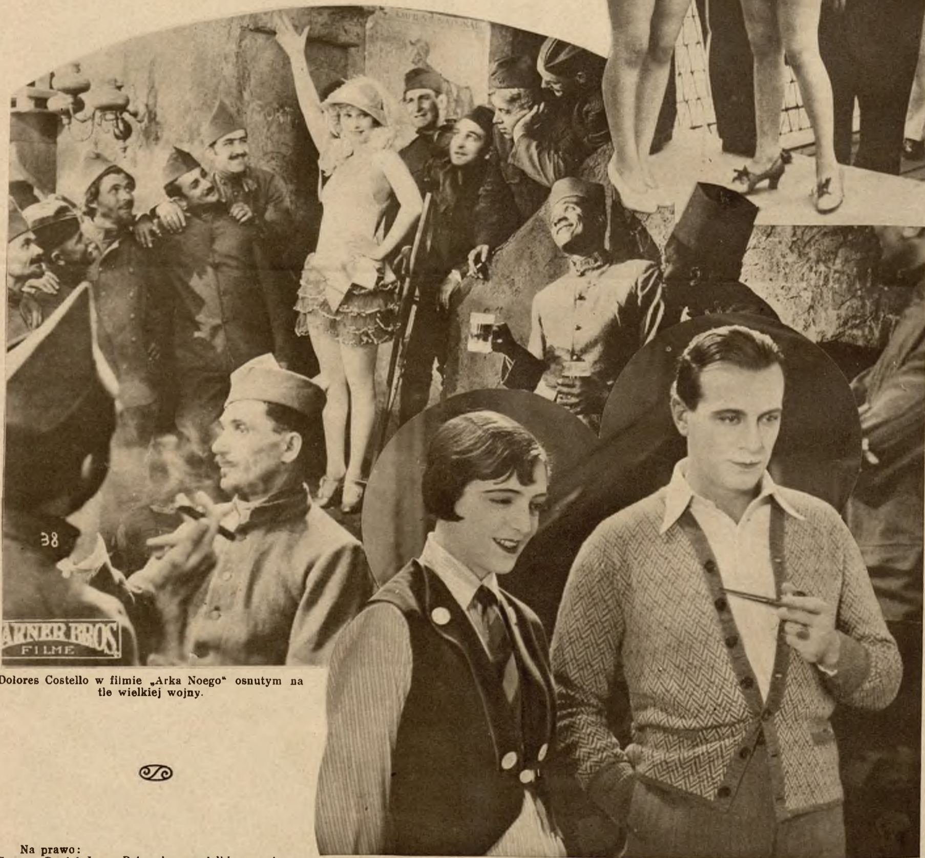
Dolores Costello w filmie „Arka Noego” osnutym na tle wielkiej wojny.