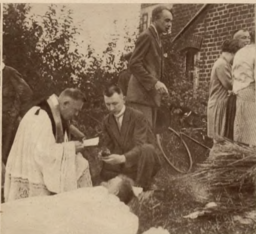
Pierwsze zdjęcia z strasznej katastrofy pociągu pospiesznego Paryż--Warszawa na przestrzeni Düren--Kolonja.