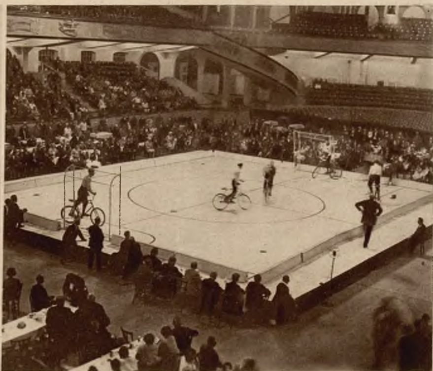
Zdjęcie z meczu piłki rowerowej rozegranego w pałacu sportowym w Berlinie.