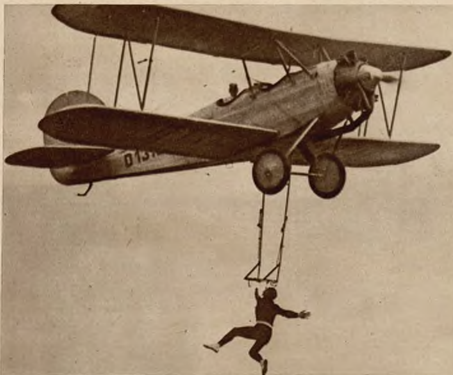
Popisy akrobatyczne na trapezie umocowanym do samolotu. Akrobata wisi, trzymając się tylko zębami.