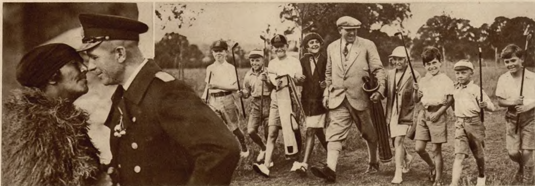
Na wyspie Nowej Zelandji znakiem przyjaznego powitania jest wzajemne pocieranie nosem.