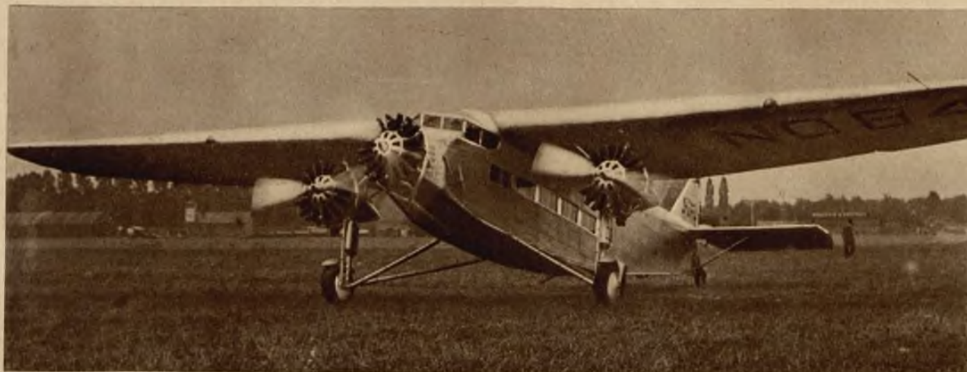
Dnia 22-go sierpnia przybył do Warszawy samolot propagandowy skonstruowany w fabrykach Forda. Samolot ten odbywa przelot po Europie i z Warszawy odlataje via Ryga do Moskwy.