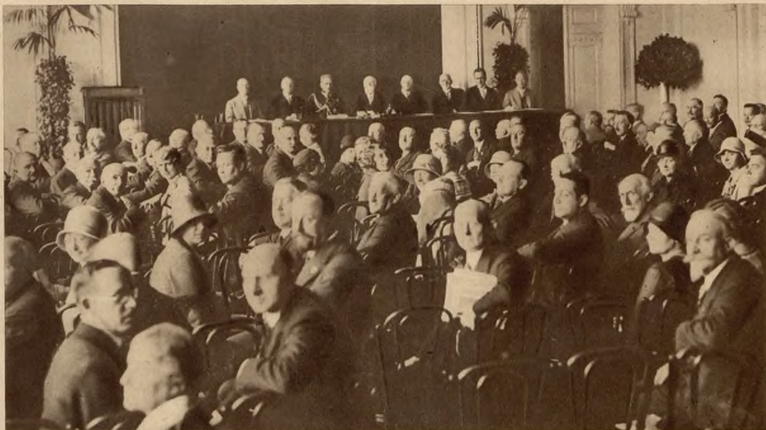
Dnia 21-go rano w gmachu Prezydium Rady Ministrów w Warszawie rozpoczęły się obrady Międzynarodowego Kongresu Statystycznego w obecności ministra spraw wewnętrznych gen. Sławojskładkowskiego.