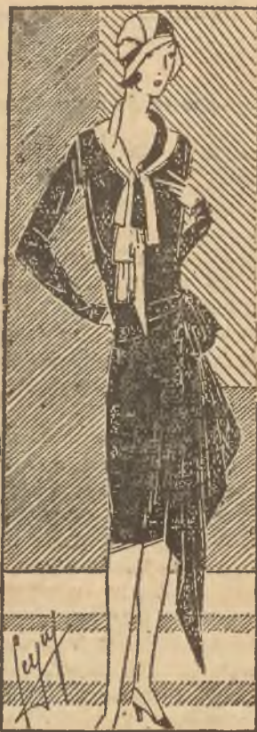
Szykowna toaleta letnia z granatowego „rodalic”.

Nowy pomysł twórców mody zaleca paniom aby w tych długich spodniach rzucały się w nurty wodne. Do