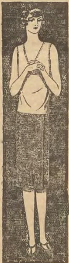
Praktyczne spodnice do bluzek ze staniczkjem.

Bo zastanówmy się z rozumą, jakie ujemne skutki może wywołać krem lub woda toaletowa nawet jeżeli rzeczywiście jest zbyt ostra, lub z nieodpowiednich składników złożona? W najgorszym wypadku może wywołać podrażnienie skóry, ostre albo chroniczne zapalenie, wypryski, trądziki lub