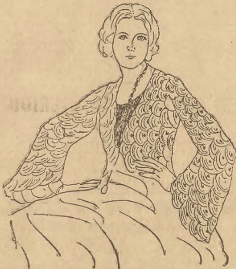
Strojny koronkowy stuleciek do sukni popołudniowej.