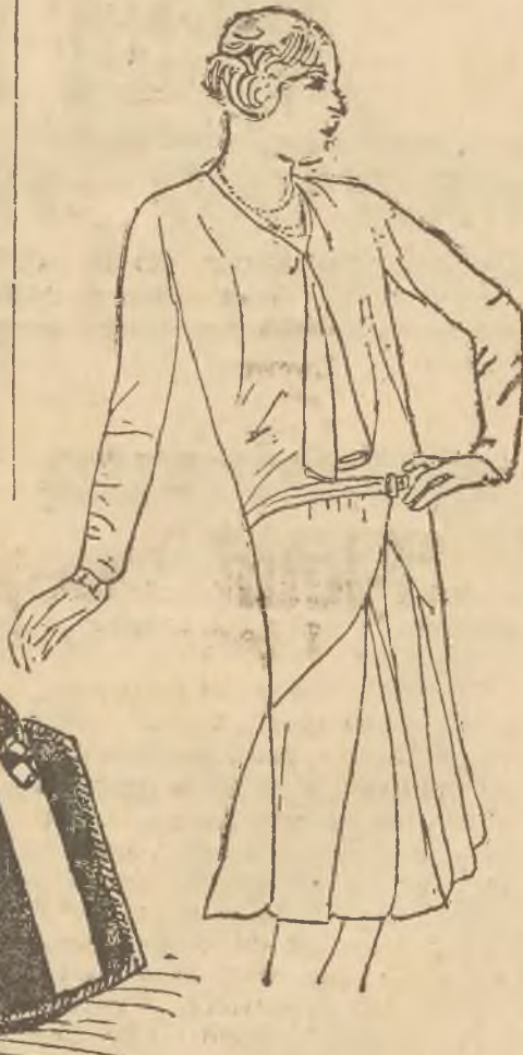
Suknia popołudniowa z srebrzystej crepe satin, spodniczka z modną obcisłą baskią.

nej skórki. Podobnie jak kostjomy, również płaszcze sportowe zachowują prostotę wykonania, chociaż i w nich widzi się często obok linii prostej, bardziej strojną linię falistą.