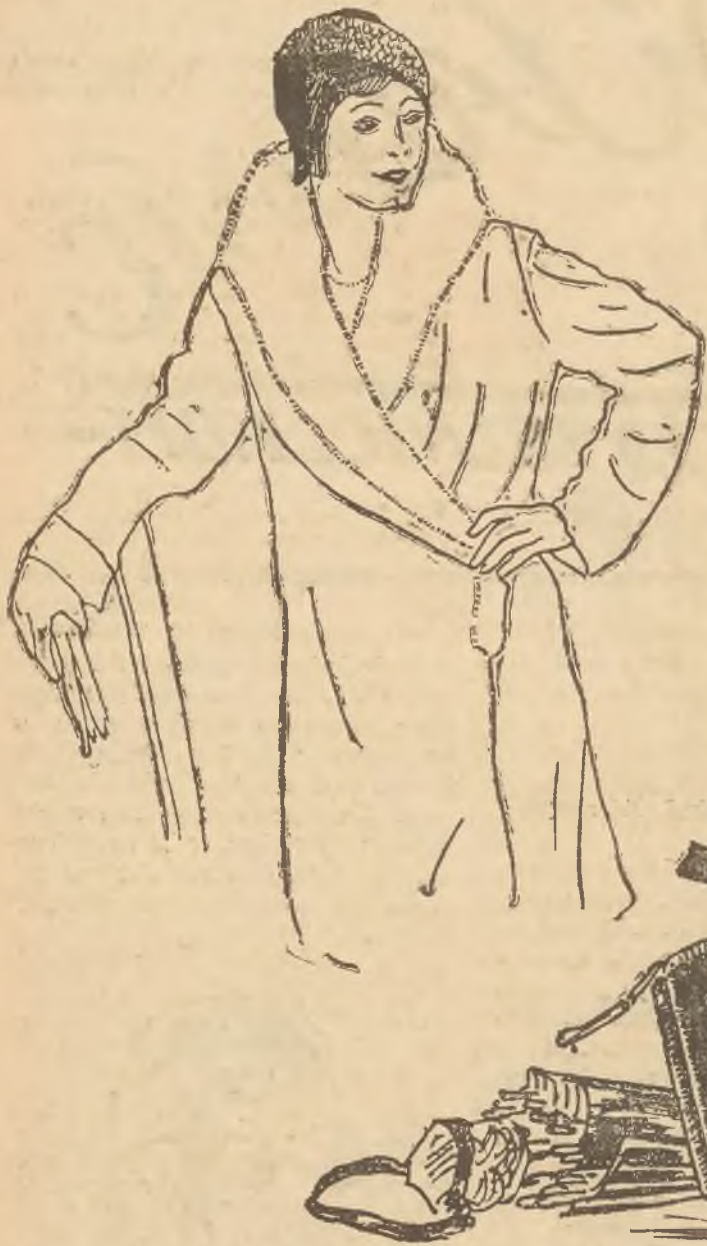
Czarny płaszcz z szalowym gronostajowym kołnierzem.