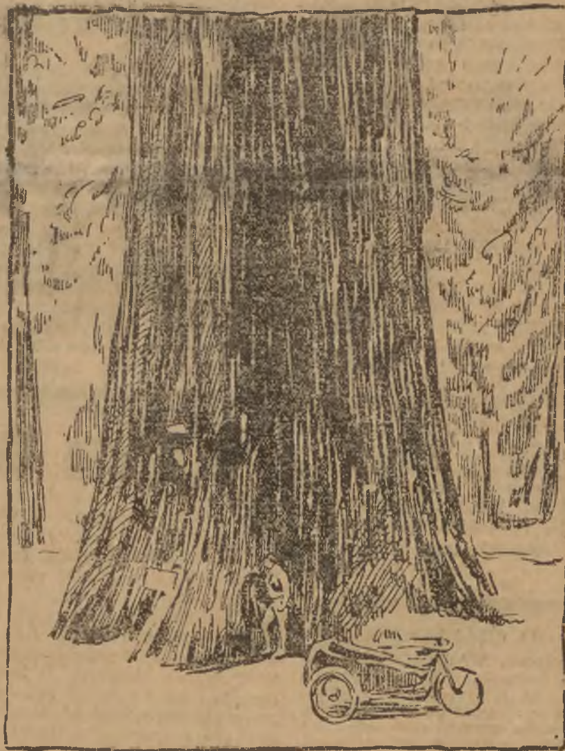
Olbrzymie drzewo w Ameryce, którego obejście trwa trzy i pół minuty.