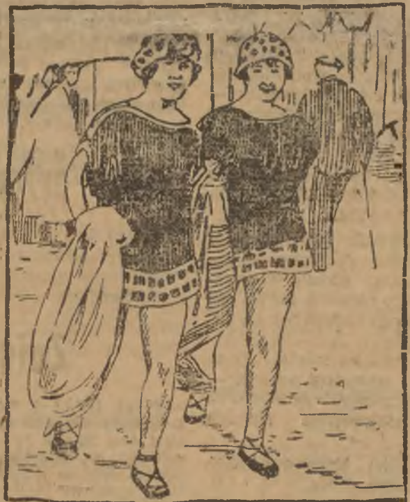
FRANCUZKI W KAPRIL

Kobieta francuska umie zachować zawsze wdzięk i szyk. To też mody prądów przeciwnych w modzie tegorocznej. Kostjomy kapelowe Francuzek odznaczały się prostotą, a jedyną ich cechą odłączną była większa, niż dotąd, pikantaria, gdyż, jak to widzimy na rycinie, estona nie zakrywała nawet od ogródkując się do koniecznego minimum.