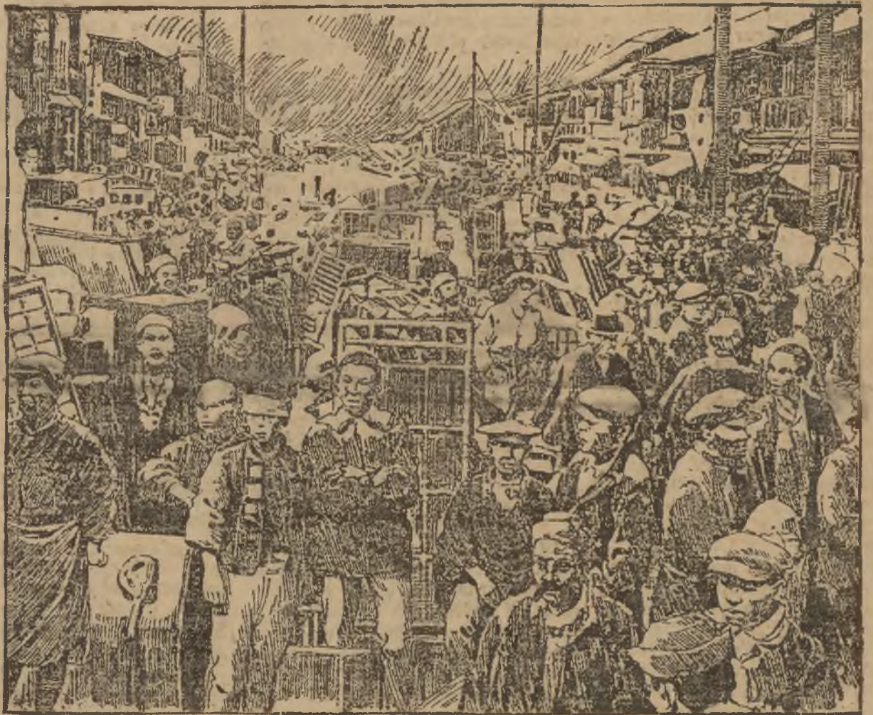
Rycina powyższa przedstawia ludność Japonji pozbawioną mieszkań i koczującą na placach i ulicach wraz z resztkami uratowanego dobytku.