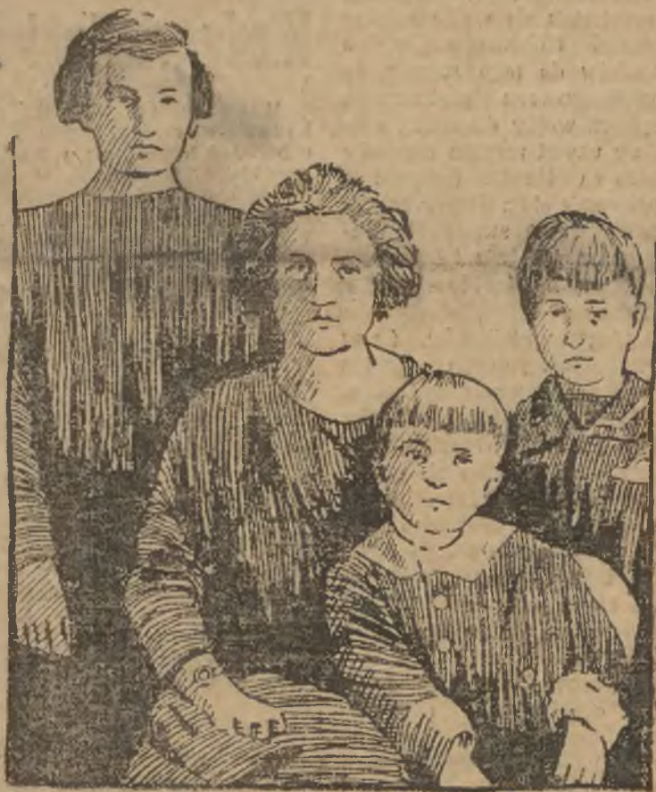
MALŻONKA DYKTATORA WŁOCH I JEGO TRÓJE DZIECI.

Z okazji pierwszej rocznicy wkroczenia faszystów do Rzymu, król włoski postanowił nadać tytuł księcia prezydentowi Rady ministrów Mussoliniemu, który to tytuł ma przejść na jego rodzinę i potomków. Rycina nasza przedstawia przyszłą księżnę wraz z dziećmi.