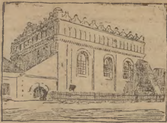
STAROŻYTNA BOŻNICA W LUBOMI.