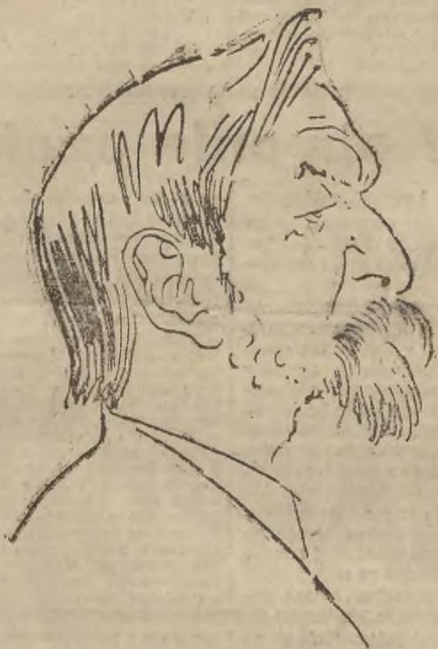
nowonolanowany tu Indster oświaty (Rysunek S. Ichulskiego).