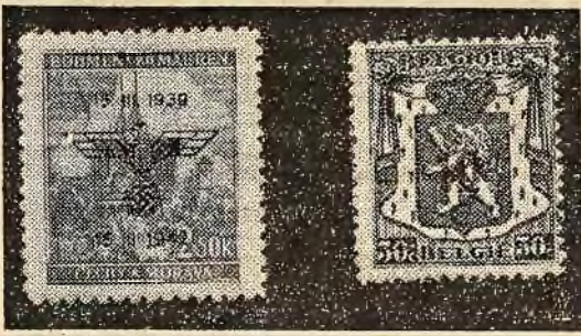
Znaczek trzecieścia Protektoratu Czech i Moraw, oraz nowy przedruk belgijski.

czerwca br. zakazuje sprzedaży i nabywania znaczków (tak czystych jak i stemplowanych) całego szeregu krajów. Każdy kupiec powinien więc nabyć ten numer Nr. 46 Dziennika Rozporządzeń, gdyż zakaz ten obowiązuje tylko dla przemysłowego handlu znaczkami pocztowymi.