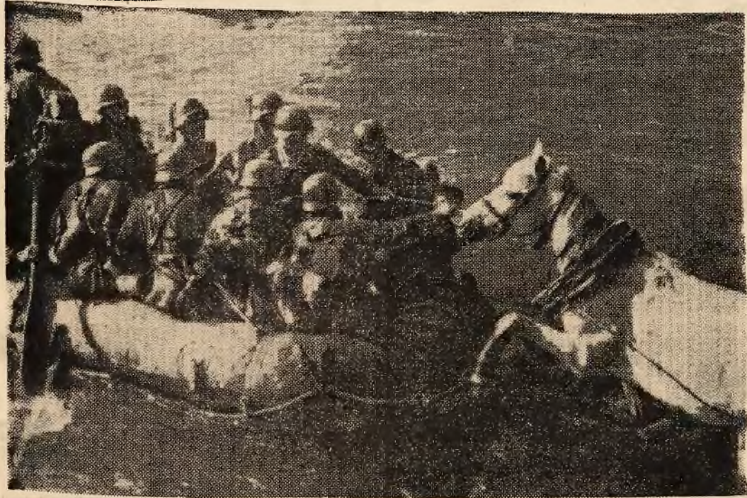
Między Donem i Dońcem.

Podczas gdy w pierwszej wojnie światowej mniejsze oddziały wojska przepływały się przez rzeki przy pomocy czółen, to obecnie do tego celu służy składana łódź gumowa, napełniona powietrzem, która jest w stanie przewieźć dość znaczną grupę żołnierzy. Ilustracja nasza przedstawia tego rodzaju łódź podczas przeprawy przez rzekę. Za łodzią postępuje koń, który okazuje się na froncie wschodnim szczególnie użytecznym.