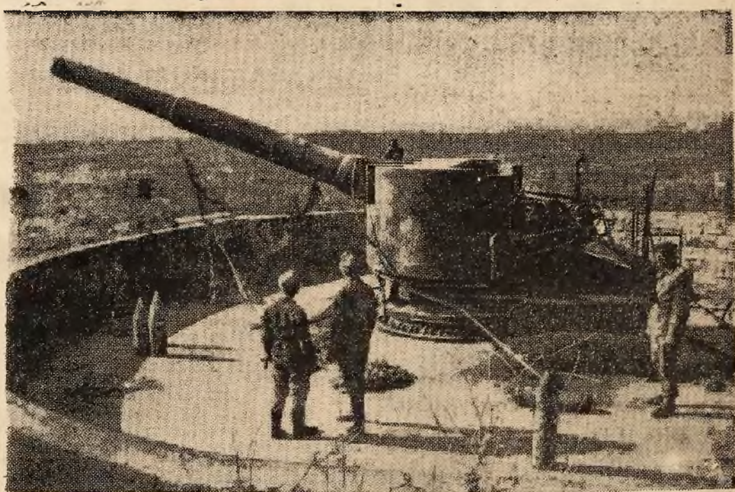
Urządzenia fortyfikacyjne Sewastopola.

Kilka baterij pod Sewastopolem zostało tak szybko opuszczonych, mimo zaciętego naogół oporu, że bolszewicy nie zdolali dokonać większego wśród nich spustoszenia. Na ilustracji naszej widzimy jedno z urządzeń fortyfikacyjnych Sewastopola, a mianowicie stanowisko potężnego działka fortecznego, obracanego przy pomocy specjalnego mechanizmu. Obok działka leżą puciski, których bolszewicy nie zdążyli wystrzelić przed swą ucieczką.