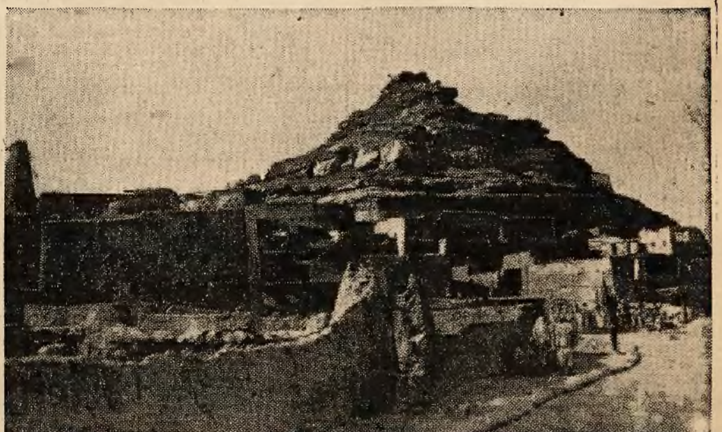
Podczas ostatnich bojów w Afryce północnej udało się armji włoskiej obsadzić oazę Siwa, położoną na granicy Egiptu i silnie umocnioną przez Anglików.