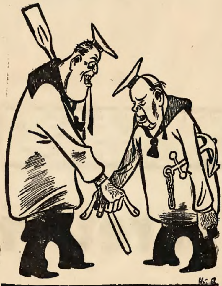
Roosevelt: Przyznaj się Winston, ile ci okrętów zatopiono! Churchill: A ty Franklin przyznaj się, ile nie dostarczyłeś z obiecanych okrętów.

bytych dnia poprzedniego w zaciętych walkach o bunkry, atak niemieckiej piechoty zyskał dalej na terenie. W walkach tych jedna bolszewicka grupa bojowa została zmuszona do ucieczki, przyczem bolszewicy pozostawili na polu walki kilkaset zabitych. Wielu bolszewików wzięto do niewoli.