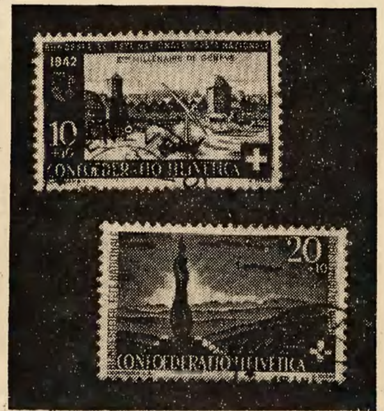
Najnowsze znaczki szwajcarskie

Strona reprodukcyjna katalogu jest więc prawdziwą paradą rarytasów europejskich, których żadna firma nie może mieć stale na składzie i które pojawiają się tylko wtedy w handlu, gdy likwiduje się zbiory prywatne. Rzecz oczywista, iż niema wśród nich egzemplarzy o wartości katalogowej ponad 5000 Michla, ale wśród znaczków najpoważniejszych krajów Europy tylko w znikomej ilości wypadków cena najrzadszej sztuki przekracza 500 punktów. Prze-