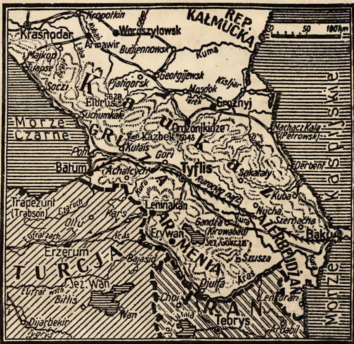
Mapka obecnego terenu wojny na Kaukazie między morzem Czarnym a morzem Kaspijskim.

Przyparto uciekające kolumny sowieckie do rzek i gór na obszarze Kaukazu. Armia niemiecka w toku swego ataku nad Donem i Donem zajęła w ciągu czterech tygodni lotniczą obszar tak wielki, jak obszarowa część Francji. Na tym obszarze znajdują się zakłady przemysłowe niezmiernie ważne dla bolszewików, a także słynie on ze swej urodzajności. Na 2 milionach ha, znajdujących się w rękach niemieckich, uprawia się intensywnie słoneczniki. Są one niezbędnie potrzebne dla zaopatrzenia bolszewików w oliwę jadalną, a nie musi