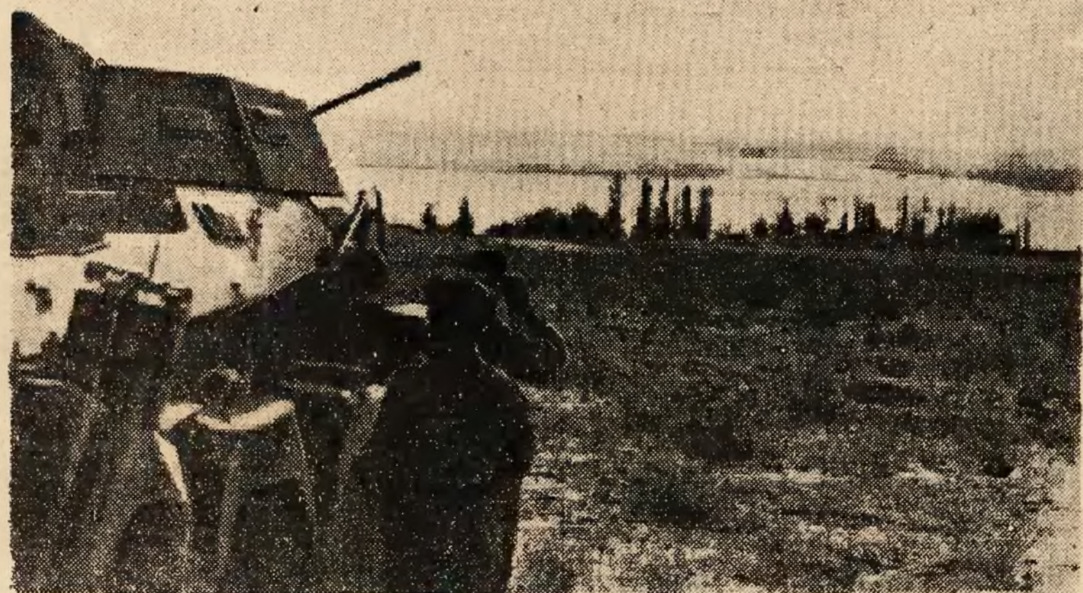
Niemieckie czołgi wywiadowe dotarły już nad Wolgę, wykorzystując utworzenie przyczółka mostowego na wschód od Donu. Ilustracja nasza przedstawia jeden z czołgów wywiadowych, zbliżający się do wybrzeża dolnego biegu Wolgi.

Niedawno przed nieudalym utworzeniem drugiego frontu czasopismo „New Statesman and Nation” pisało: utworzenie drugiego frontu byłoby aktem rozpacz. W międzyczasie ten akt rozpacz dał Niemcom sposobność do wykazania, że ich siła na oceanie jest totalna i przełamanie frontu przez Anglików i Amerykanów w tym miejscu będzie niemożliwym.