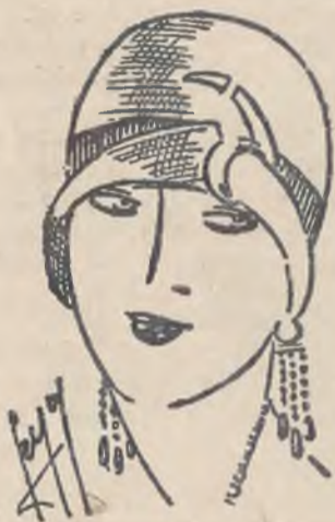
Modny kapelusz ze słomki egzotycznej i nurka.

Nowe zupełnie klamry, metalowe lub skórzane, przytuzymują w sposób