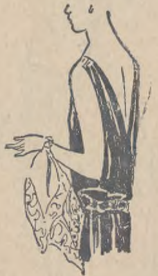
Modna chusteczka jedwabna do toalet wieczorowych.

1) Modny płaszcz wiosenny z pelerynką. 2) Pelerynka jako samodzielne okrycie.