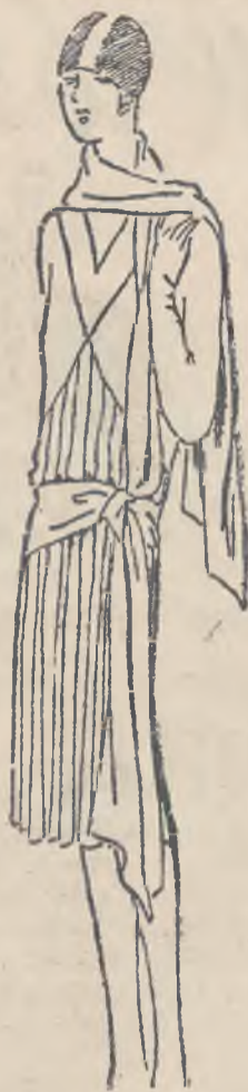
Toaleta popołudniowa z krepeliny. Modny szal i mały okrągły kapelusik.

dodatki do płaszczy, czy też jako samodzielne pelerynki, są bardzo forytowane. Czy to krótkie jak bolero, czy też owijające całą postać, nadają jej cechę i wdzięk kobiecości. Są zarazem bardzo praktyczne na lato, gdyż można je wygodnie zarzucić na ramiona gdy wczorem lekka sukienka okaże się niewystarczającą.