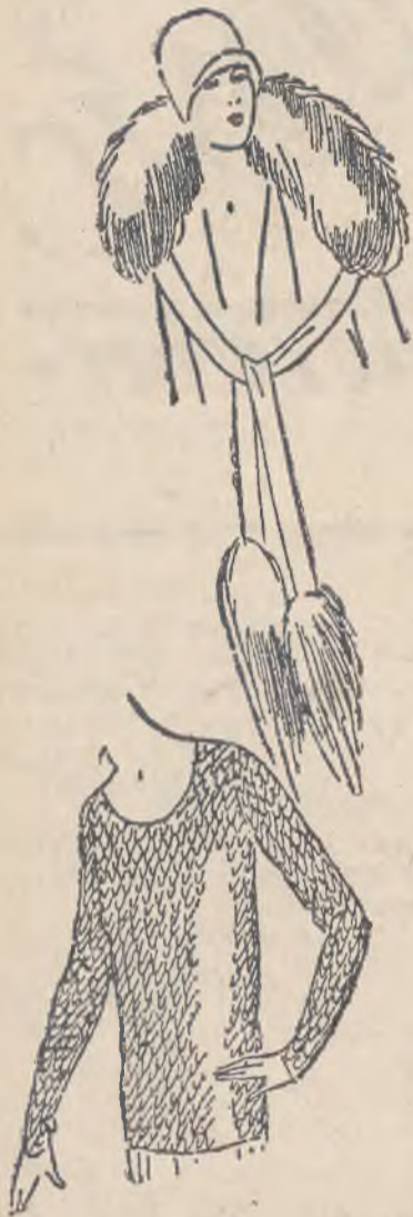
1) Nowy fason boa futrzanego. 2) Jumper haftowany w luski.

szczególniej wiele nowości widzimy w materiałach wełnianych, które w tym roku zyskują równorzędne miejsce z tak silnie uprzywilejowanymi za lat poprzednich materiałami jedwabnymi.