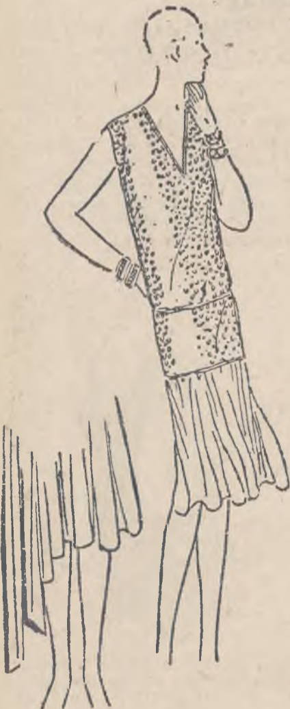
Suknia jumperowa z falistą spodnicą, jumper haftowany koralikami.

W wypadkach zwyczajnych wysłarza zastrzyk parafinowy z ewentualnem operatywnem naciąganiem skóry. Alfa.