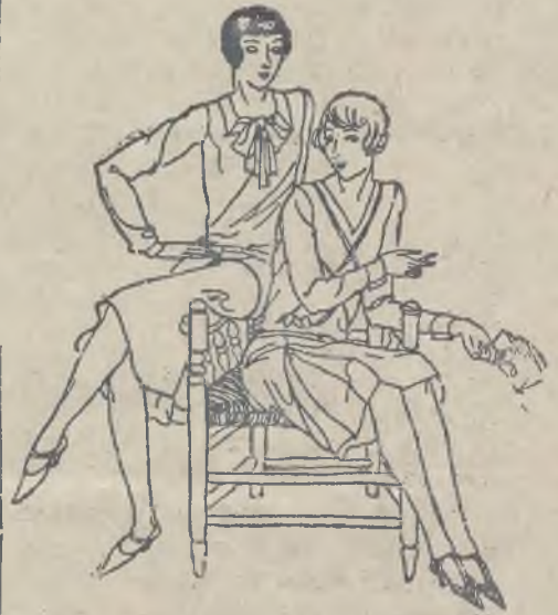
Dwie praktyczne i eleganckie sukienki dla podlotków.

Natomiast do wszelkiego koloru kombinacji daje się do przyrzczymania wąskie szelczki z crepe georgette koloru cielistego, co dobywa z pod przejrzystej sukienki nienaganną linję torsu