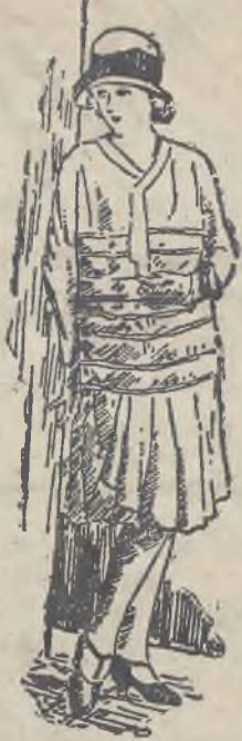
Jumperowa sukienka dla podlotka. Pastelowo niebieska kasha z białym jedwabiem i białym haftem.

Suto marszczone zaznaczające się w obfitem sfalowaniu na dolnym ob-