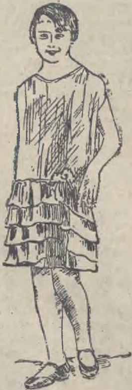
Sukienka wieczorowa z ponsowej tafty z falbankami.

wodzie, przybrane wązkiemi ruszkami lub wstążeczkami, haftowane kolorowo, przewijane wstążeczkami, stanowią śliczną namę dla naturalnego wdzięku dziecka.