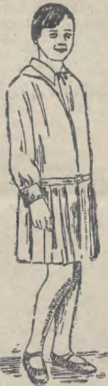
Praktyczna sukienka granatowa z plisowaną spodniczką i białym garniturem.