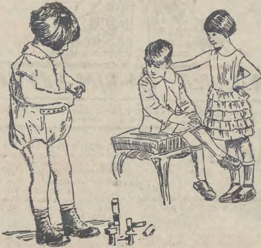
Jednostajne kombinacje dla chłopczyka czteroletniego.

wodzie, przybrane wązkiemi ruszkami lub wstążeczkami, haftowane kolorowo, przewijane wstążeczkami, stanowią śliczną namę dla naturalnego wdzięku dziecka.