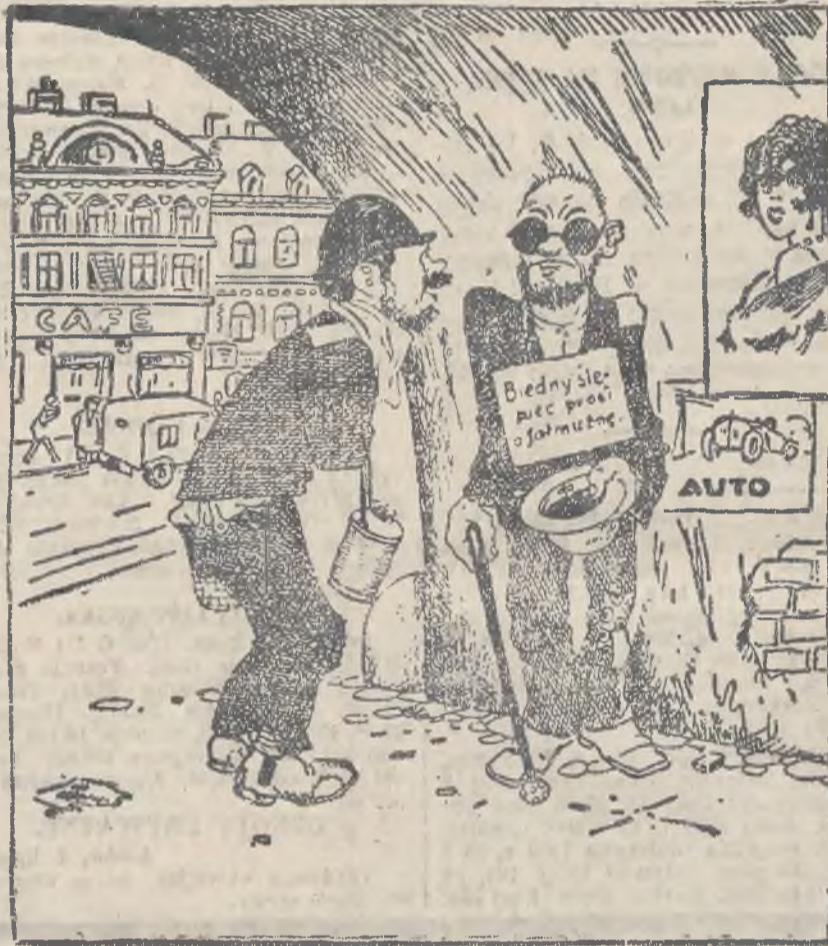
Dziad I: Te, ślepy, wynoś się stąd, bo jak nie, to ci jałmużkę zbakieruję! Dziad II (Ślepiec): Oho, chciałbym to zobaczyć!