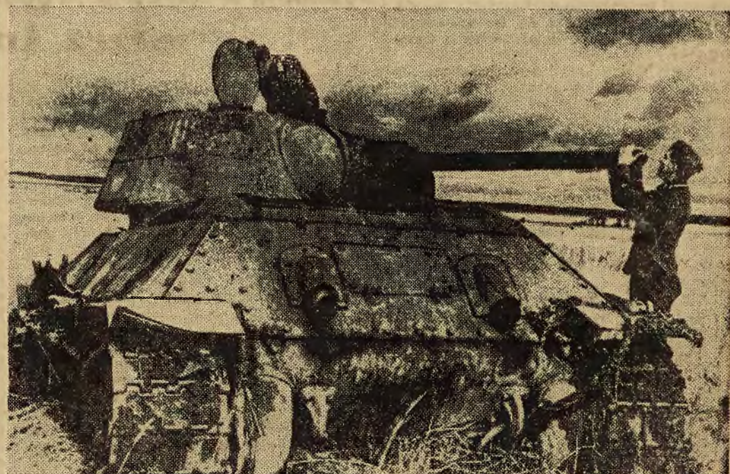
W walkach na froncie wschodnim wielką rolę odgrywa artylerja. Na zdjęciu na lewo widzimy niemiecki moździerz kalibru 21, używany obecnie również w walce z najcięższymi czołgami sowieckimi. Zdjęcie na prawo przedstawia czołg sowiecki typu „T 34”, zestrzelony przez niemiecką artylerję przeciwlotniczą.