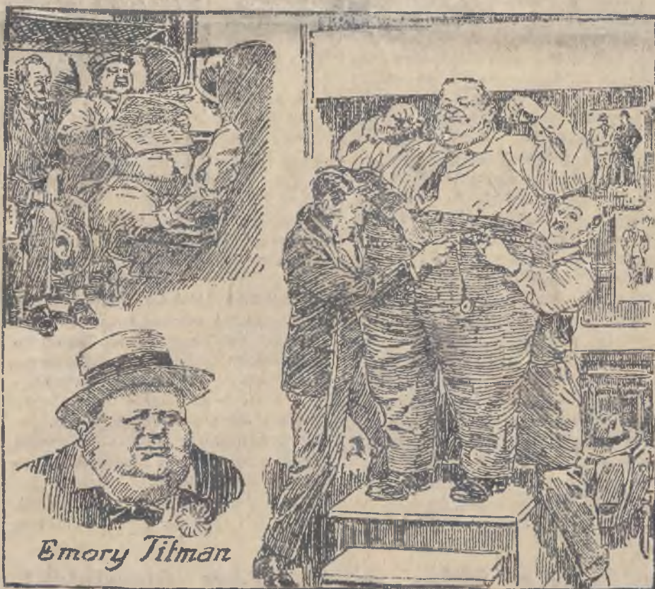
NAJCIEŹSZY I NAJGRUBSZY CZŁOWIEK ŚWIATA. (Do artykułu na str. 7.).