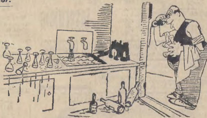
Słomiany wdowiec (telefonuje do nieobecnej żony): „Tak, Halinko, teraz właśnie myję naczynia.”

PRACOWNIA KUŚNIERSKA JAKOBA NACHTWÄCHTERA Lwów, ul. Kopernika 16 przyjmuje wszelkie roboty w zakresie kuśnierstwa wchodzące. 6894-6