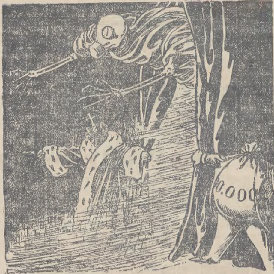
GAZOWE „MEMENTO MORI”.

nie kiedyś w przyszłej wojnie nie chcemy postradać tak drogo okupionej niepodległości, popierajmy LOPP, i w czasie jej Tygodnia okażmy pełne zrozumienie dla jej celów państwotwórczych, zbudujmy silny i liczny huciec skrzydlatych ptaków-samolotów, na których synowie naszej Ojczyzny przy pomocy innych środków wyprodukowanych w kraju potrafią obronić nasze rubieże! Dla tych haseł i w imię tych idei, które powinny złączyć całe społeczeństwo Rzeczypospolitej, wstępujemy wszyscy w szeregi LOPP., spełnijmy swój obowiązek względem Ojczyzny!