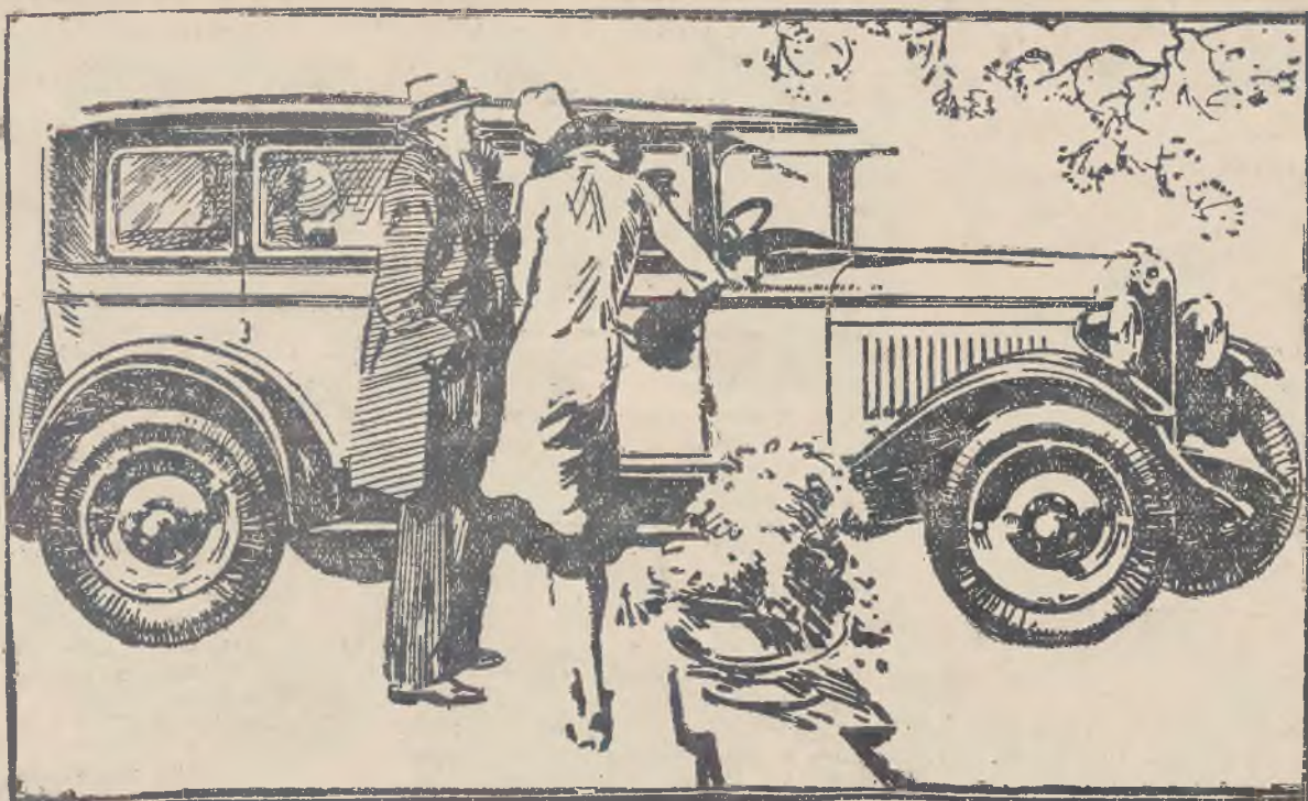
Każdy samochód Chevrolet zaopatrzony jest w jednoroczną gwarancję

POKÓJ wejście ze schodów, natychmiast wynajmę paup. Piekarska 26. Sawaryn 7508