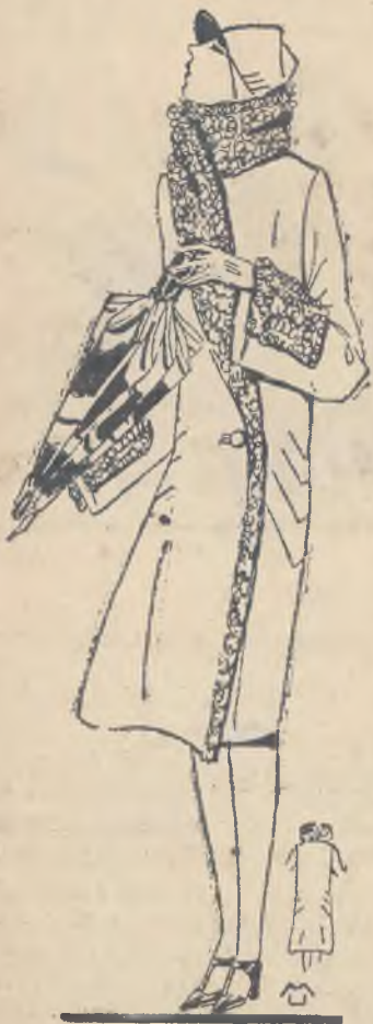
Elegancki płaszcz z czarnego xilseline podbity futrem i przybrany perskim barankiem.

piły miejsca futrom, przerabianym jako materiał wierzchni. Ten nawrót do podbijania materiałów wełnianych futrem może być pożądanym dla wielu pań, posiadających już nieco podniszczone płaszcze futrzane. To bowiem, co nie nadaje się już jako materiał wierzchni, może być bardzo dobrze użyte jako podbicie i tak małym kosztem można zdobyć elegancki płaszcz zimowy, który wystarczy znowu na kilka sezonów.