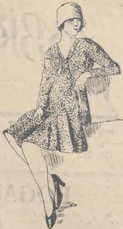
Elegancka toaleta popołudniowa z velours chiffon imprimé.

Zbyt wodniste kartofle należy przed użyciem położyć na parę godzin w pobliżu ciepłego pieca, co sprawia, że wilgoć wyparowuje, a kartofle po ugotowaniu będą smaczne i sypkie.