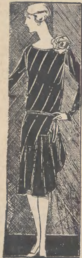
Suknia wizytowa z crepe marocain beige, z skośnym aranżowaniem zakładek i przybrania.

Elegancji dodaje takiemu płaszczowi wysoki kołnierz futrzany i także mانشety, które dzisiejsza moda podnosi niemal do łokcia lub nadaje im formę bufiastą. Futrzane