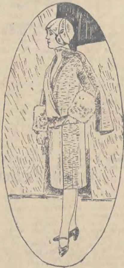
Plaszcz zimowy z pelerynką i wysokimi manszetami futrzanymi.

Linja jest dzisiaj wszystkim — przybranie musi się zadowolnić rolą dekoracyjną. Zadaniem jego jest ożywienie sukni, a także podkreśle-