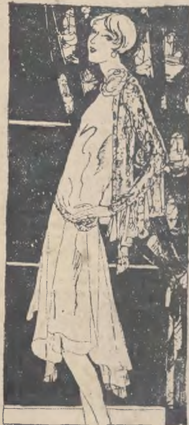
Strojna toaleta wieczorowa z muszlinu jedwabnego z koronki.