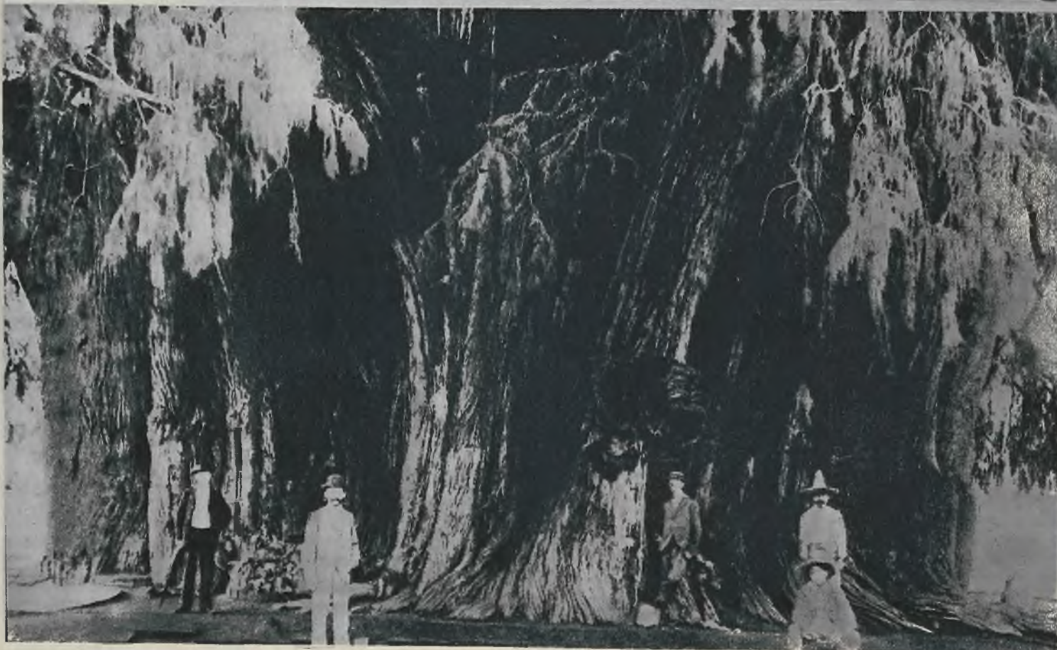
U dołu: Z pośród niezliczonych drzew „olbrzymów” Meksyku, to chyba jest najpotężniejsze. Powstało ono wskutek zrosnięcia się kilku pni.