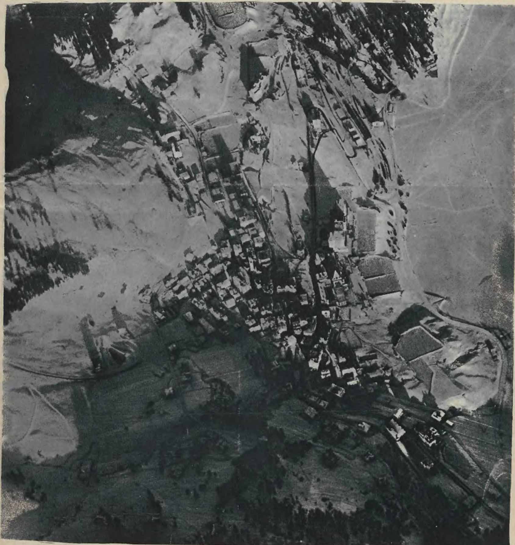
W dniach 11—19 lutego odbędzie się w St. Moritz (Szwajcaria) II Olimpiada zimowa, w której wezmą udział polscy narciarze i hockeyści. Obraz nasz przedstawia St. Moritz, zdjęte z lotu ptaka.