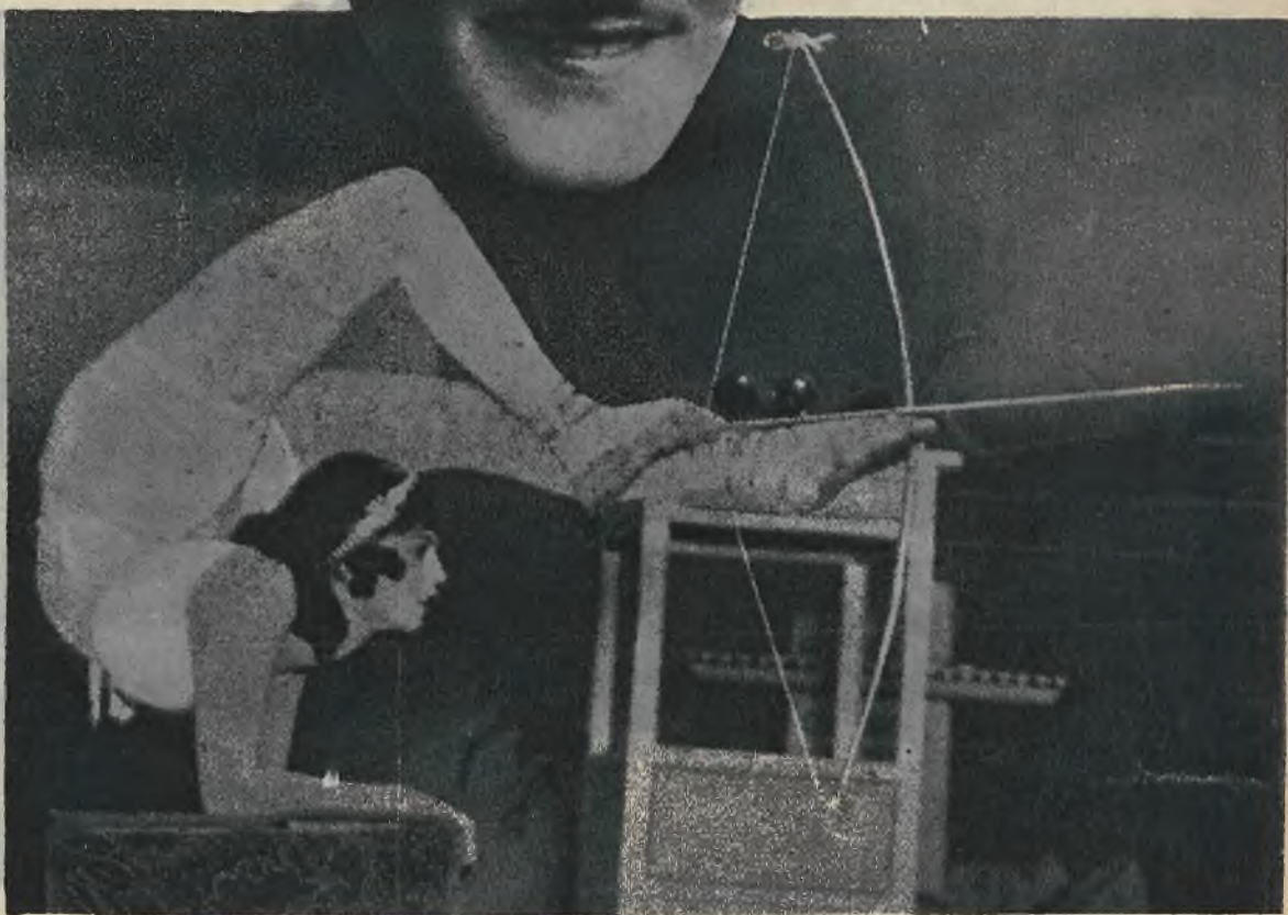
„...Strzela baba z łuku!” Ale jak! Zazdrości jej zapewne każdy a raczej każda z nas, pracująca mozolnie nad linią.