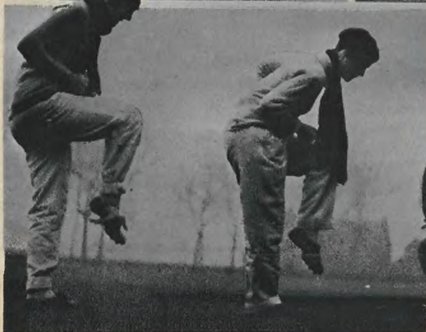
Nasze lekko-atletki przy treningu zimowym