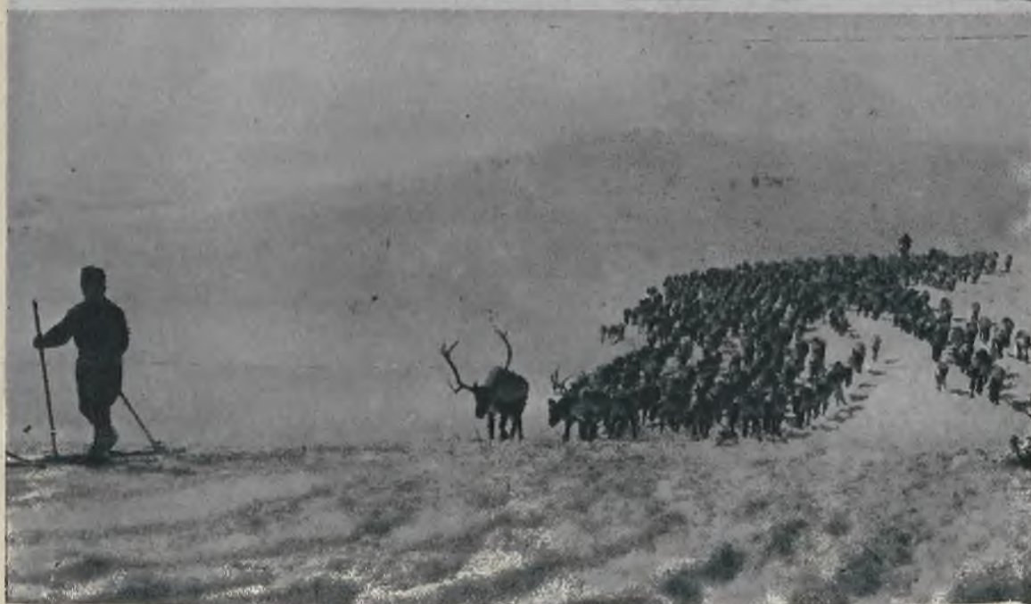
Olbrzymie stado renów udające się na leża zimowe, prowadzone przez dwu lapońskich pasterzy idących na nartach.