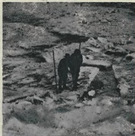
Ostatnie mrozy ścięły powierzchnię rzek i uniemożliwiły żeglugę. Zdjęcie drugie przedstawia prace nad usunięciem zapory.