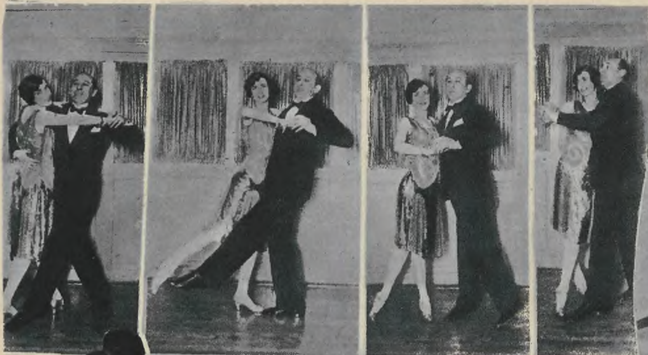
Fazy najmodniejszego tańca, „Yale Blues” importowanego z Ameryki.