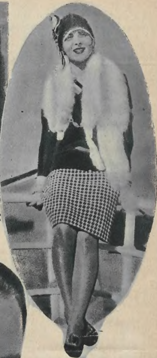
Cheć zobaczyć tę damę, musisz jechać do... Honolulu, albowiem tam ona mieszka i tam została uznana za najpiękniejszą wyspiarkę Hawańskiego archipelagu.