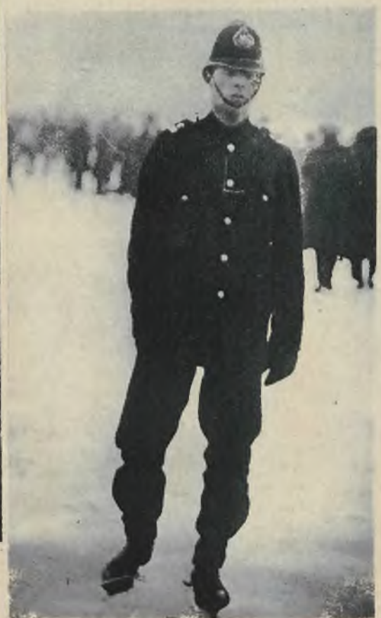
Na prawo: Policjant pełniący służbę na łyżwach i pilnujący porządku na ślizgawce w Londynie.