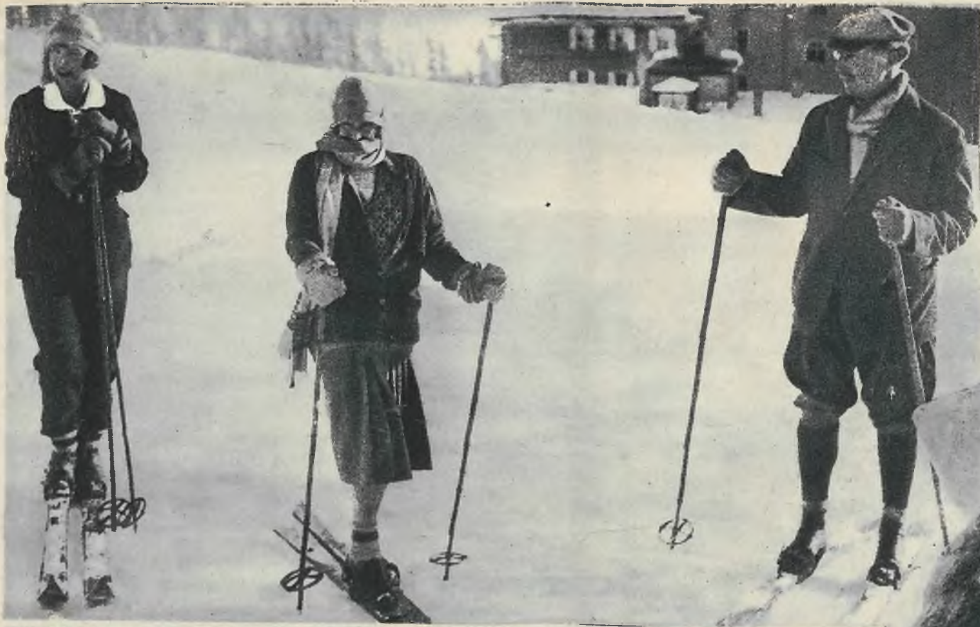
Król belgijski wraz z żoną i córką przebywa w St. Moritz. Rodzina królewska z zapalem jeździ na nartach.