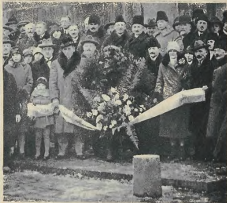
Delegacja zjazdu stanu średniego nad grobem Nieznanego Żołnierza w Warszawie.