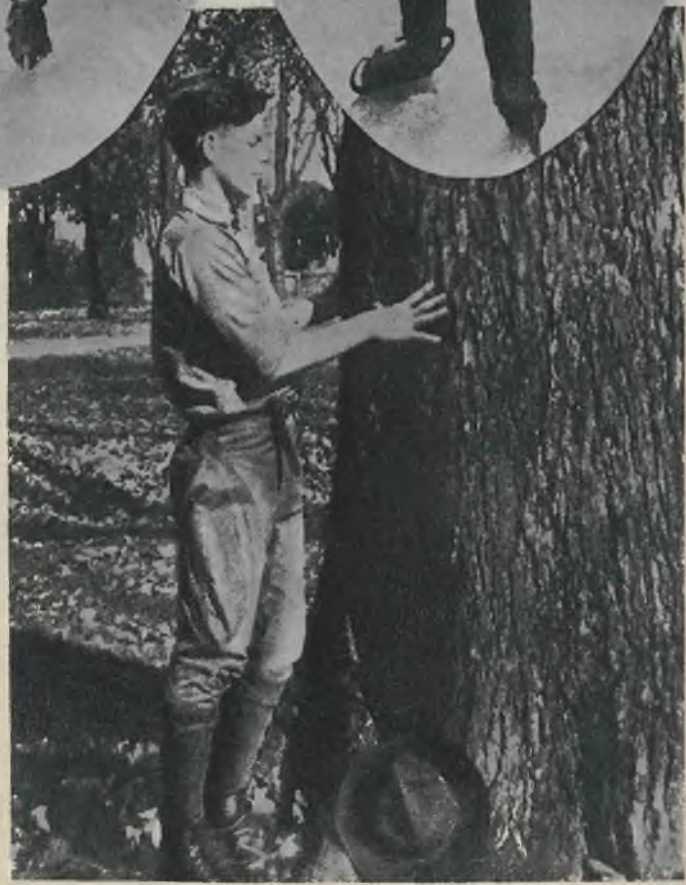
15-letni skaut amerykański, ślepy od urodzenia, rozpoznaje doskonale gatunki drzew zapomocą dotyku.