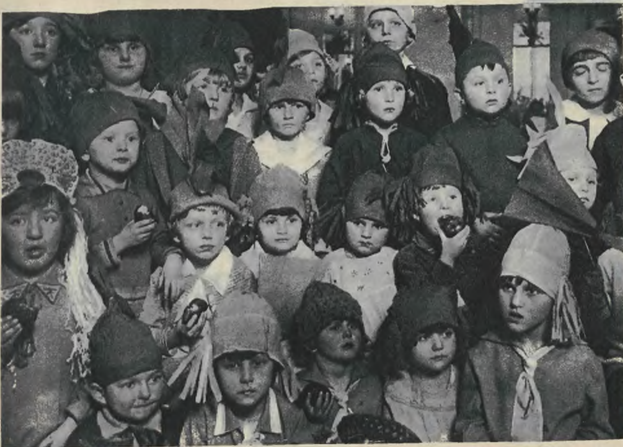
Staraniem Rodziny Wojskowej odbyła się w Warszawie zabawa dla dzieci p. t. „Król migdałowy“. Oto dzieci ze smakiem zjadają pączki w poszukiwaniu migdałka.