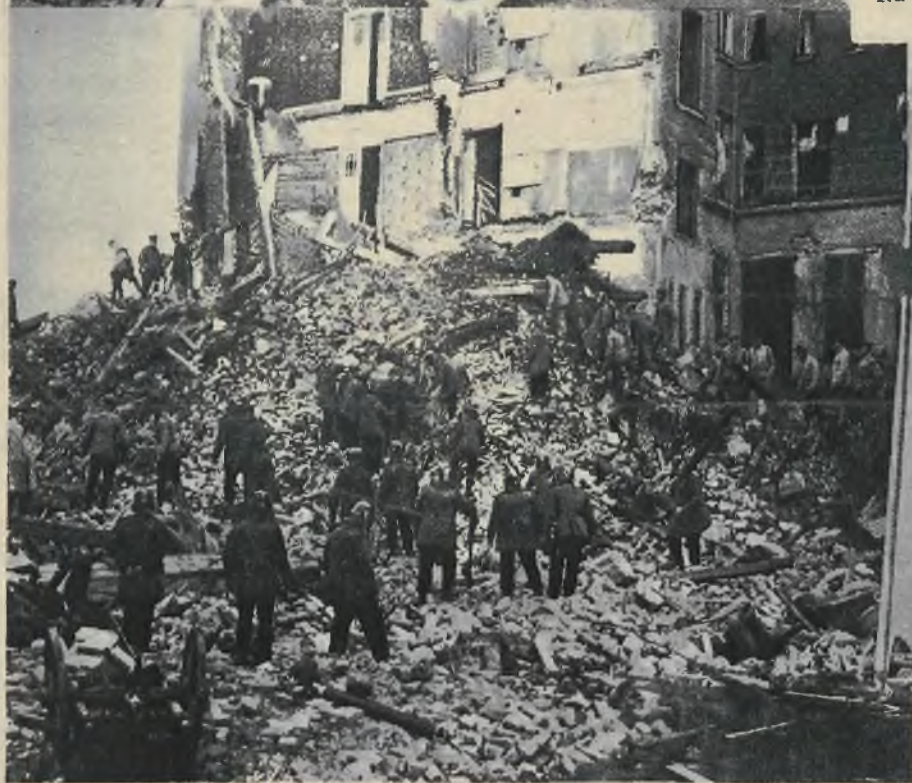
W Berlinie zawalił się dom siedmiopiętrowy grzebiąc pod gruzami oprócz całego dobytku, licznych mieszkańców domu.