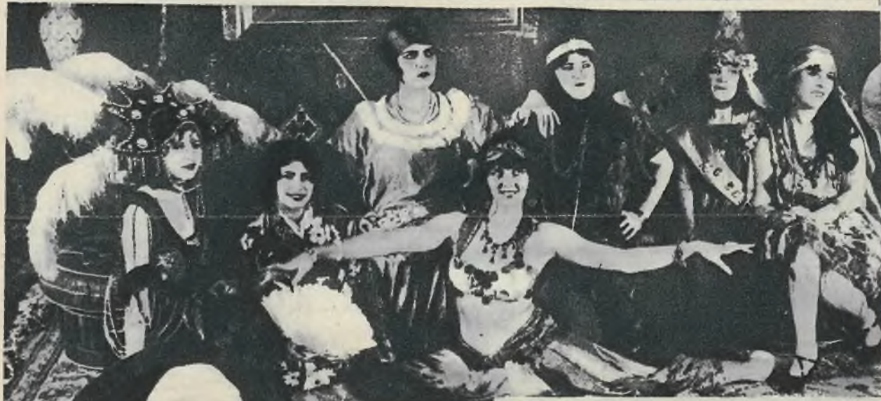
7 uroczych przedstawicieli wschodu od Egiptu do Japonji.