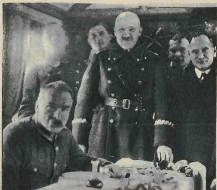
Marszałek Piłsudski w wagonie salonym w przejeździe z Krynicy do Warszawy.