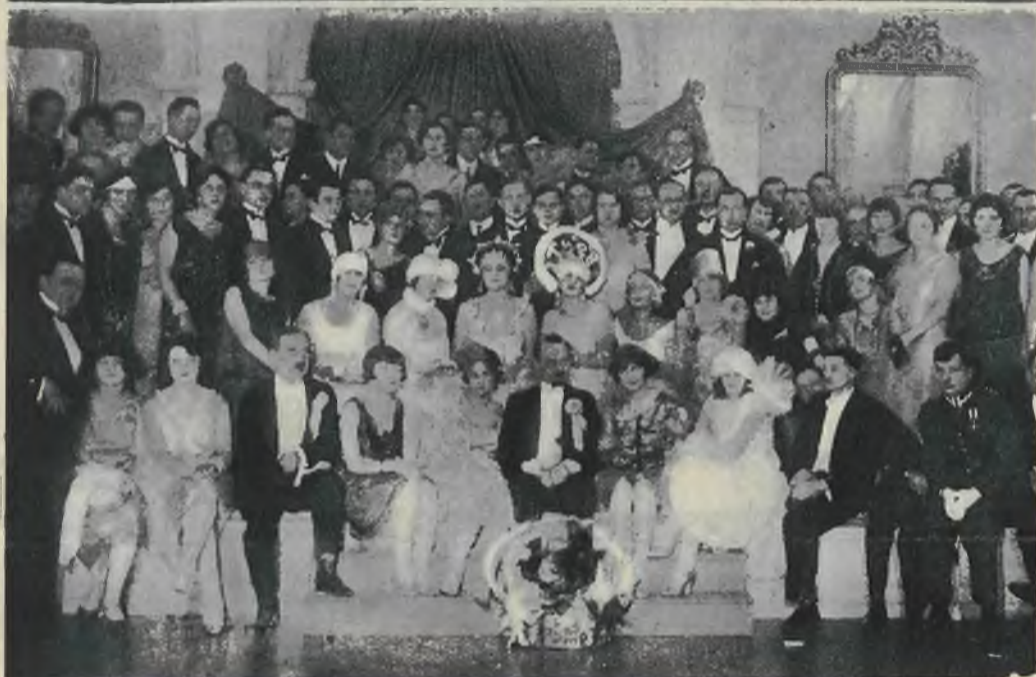
Noc sylwestrowa w sali Kasyna i Koła literackiego we Lwowie.