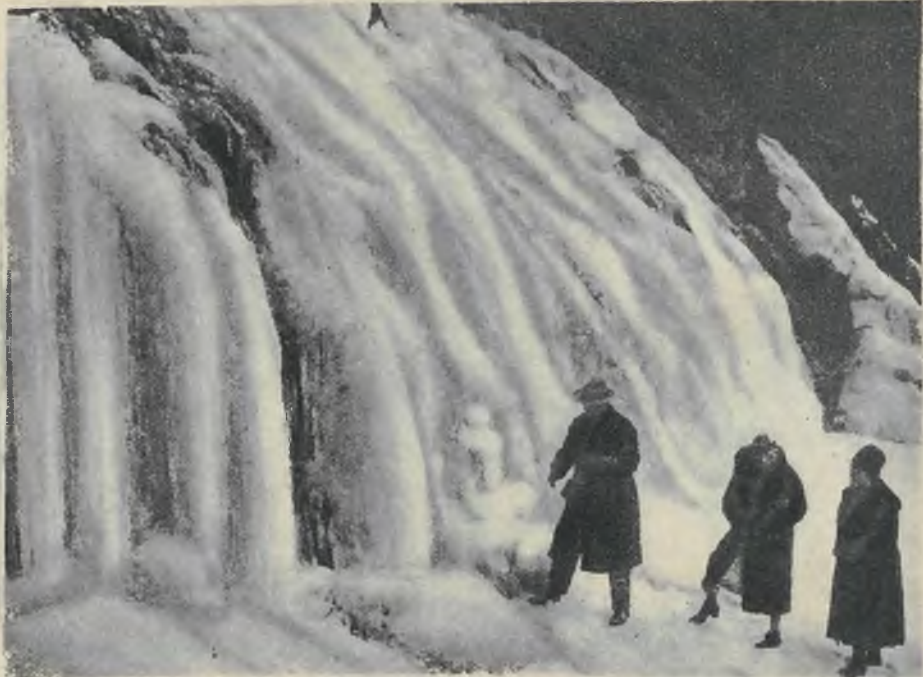
Jeden z największych wodospadów europejskich zamarzł ostatnio i znowu w zmienionej szacie przyciąga licznych turystów.