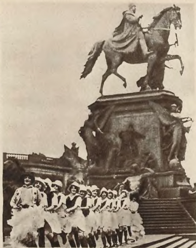
Uroczę „Gils“ z „music-hallu“ wykonują swe piosenki pod pomnikiem cesarza Wilhelma w Berlinie.