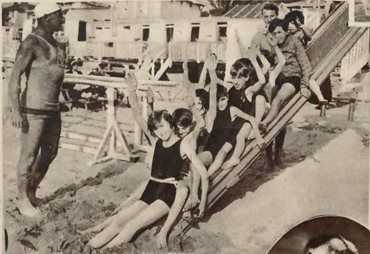
Uczniowie i uczennice szkoły gimnastyki w Cannes (Riviera) odbywają ćwiczenia na plaży, pod dobroczynnym działaniem słońca.