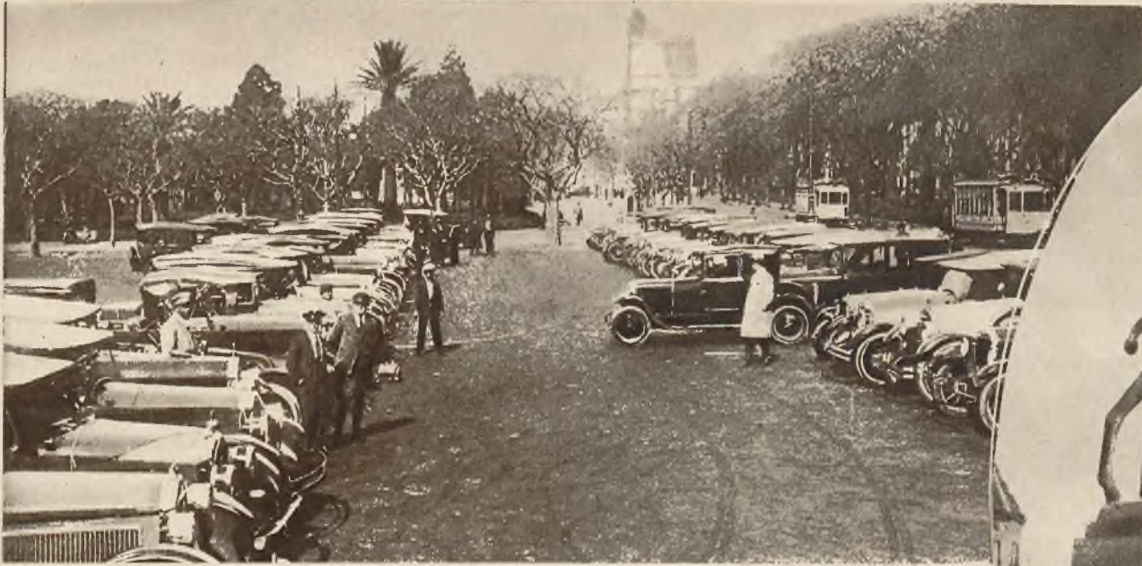
Przed głównym urzędem pocztowym w Buenos-Aires, stoją długie szeregi pięknych taksówek, i samochodów prywatnych, świadcząc o wielkiem bogactwie Argentyny, a także o taniości aut w tym kraju.