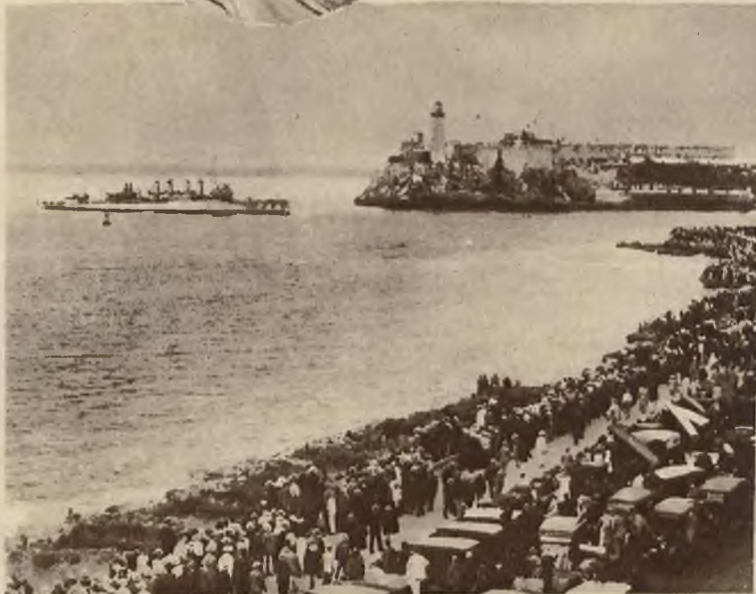
Przyjazd prezydenta Stanów Zjednoczonych do Havanny na Kubie na kongres Panamerykański. Wjazd do Portu.

Na lewo: Gliniana figurka przedstawiająca hinduskiego księcia. Na prawo: Gliniana figurka przedstawiająca pogromcę tygrysów.