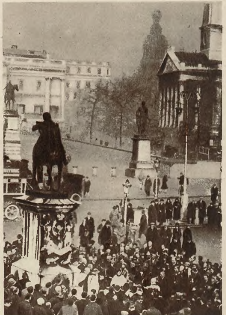
W każdą rocznicę ścięcia króla angielskiego, Karola I, skazanego przez Cromwella, odbywa się przed pomnikiem Karola I, w śródmieściu Londynu nabożeństwo żałobne.