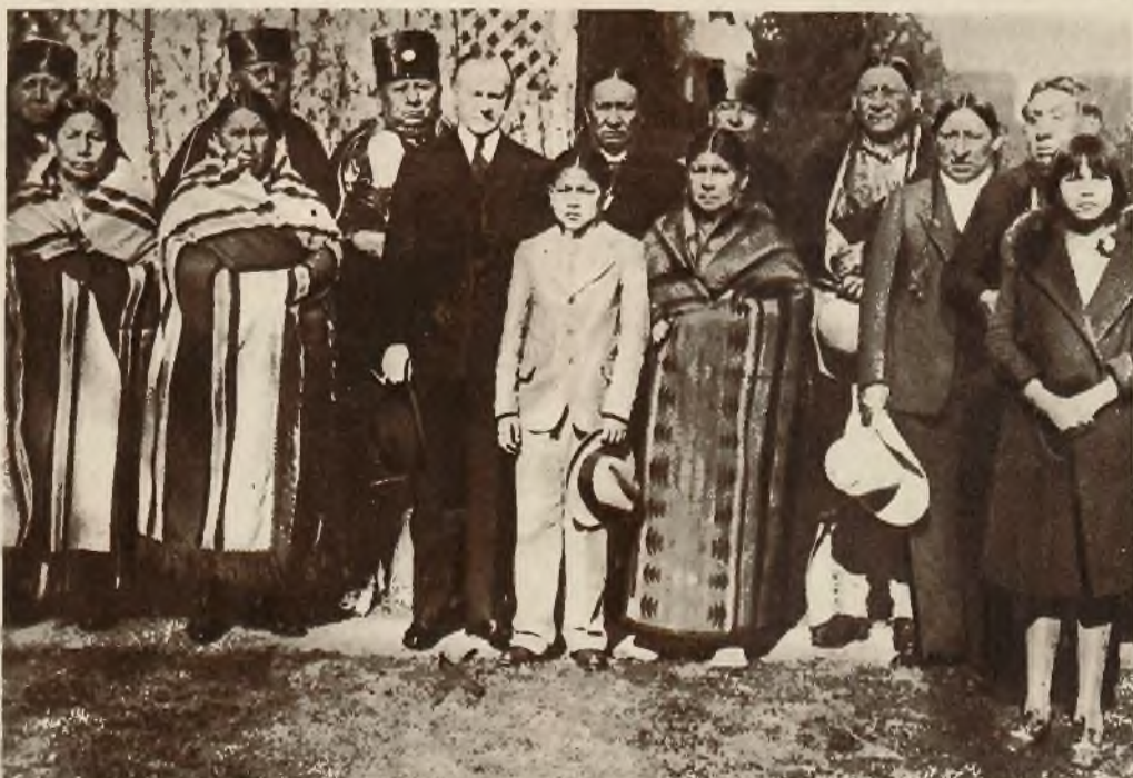
Indianie amerykańscy najszlachetniejszych rodów składają corocznie hołd prezydentowi Stanów Zjednoczonych. Na fotografii widzimy prezydenta Coolidge (X) w otoczeniu czerwono-skórych.