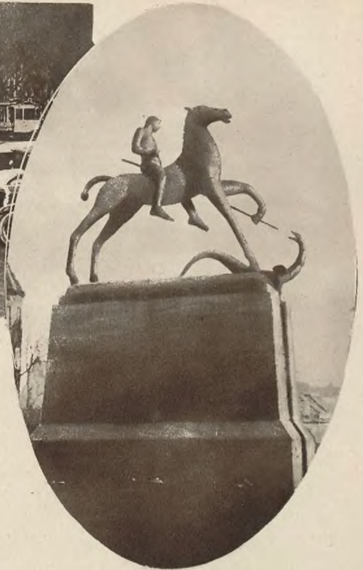
Starożytna Bazylea posiada obok pięknych dawnych zabytków także pomniki nowoczesne. Jeden z tych nowych pomników, przedstawiający św. Jerzego, walczącego ze smokiem; widzimy na naszym zdjęciu.