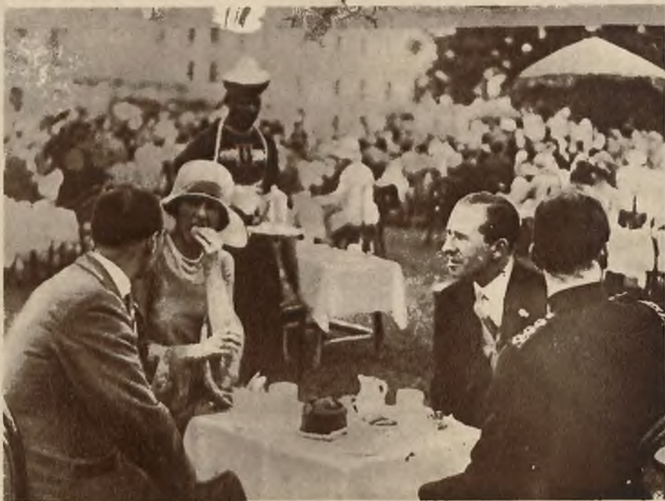
Przyjęcie towarzyskie w ogrodach pałacu wicekróla Indji, bar. Irvina.