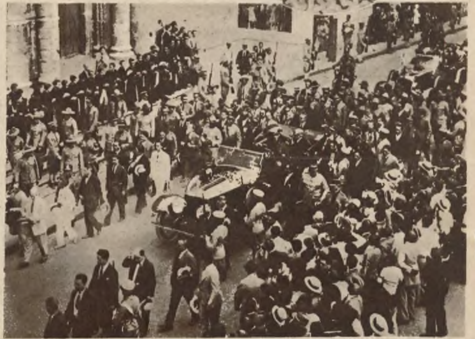
Prezydent Coolidge w towarzystwie prezydenta Kuby Machado, jedzie otoczony eskortą policji do pałacu rządowego.