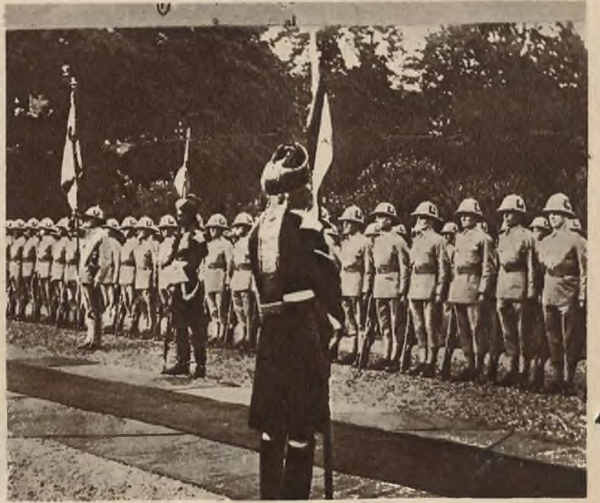
Gwardja honorowa wita nadchodzącego wicekróla Indji.