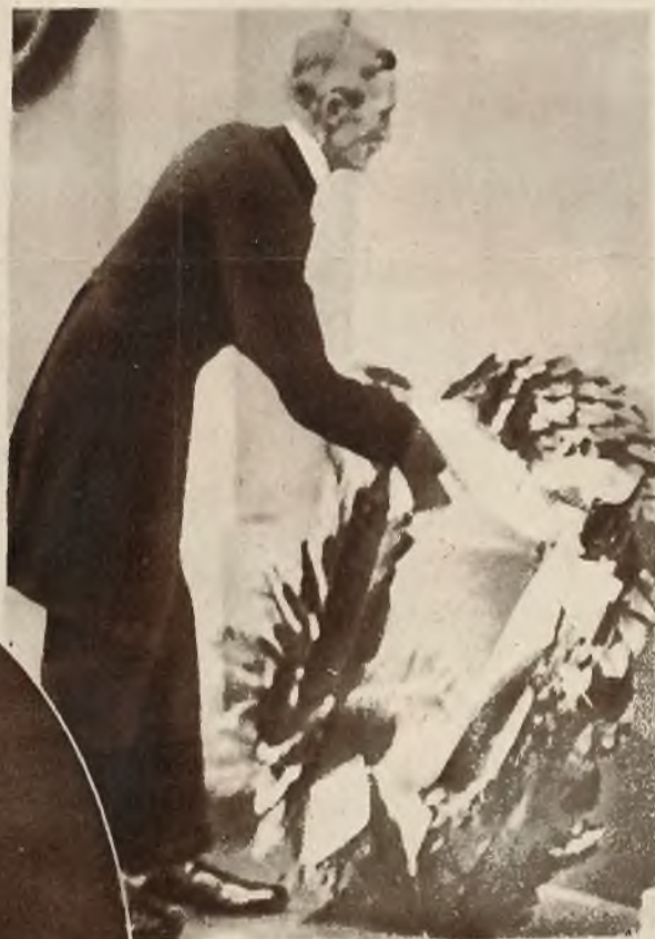
Nowomianowany generalny gubernator Irlandji Mc. Neill, składa wieniec na pomniku Collinsa.