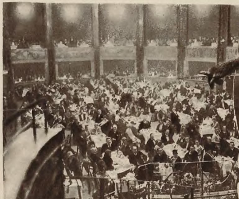
Nowo zbudowane, przebogate, „foyer“ opery Kroll w Berlinie.