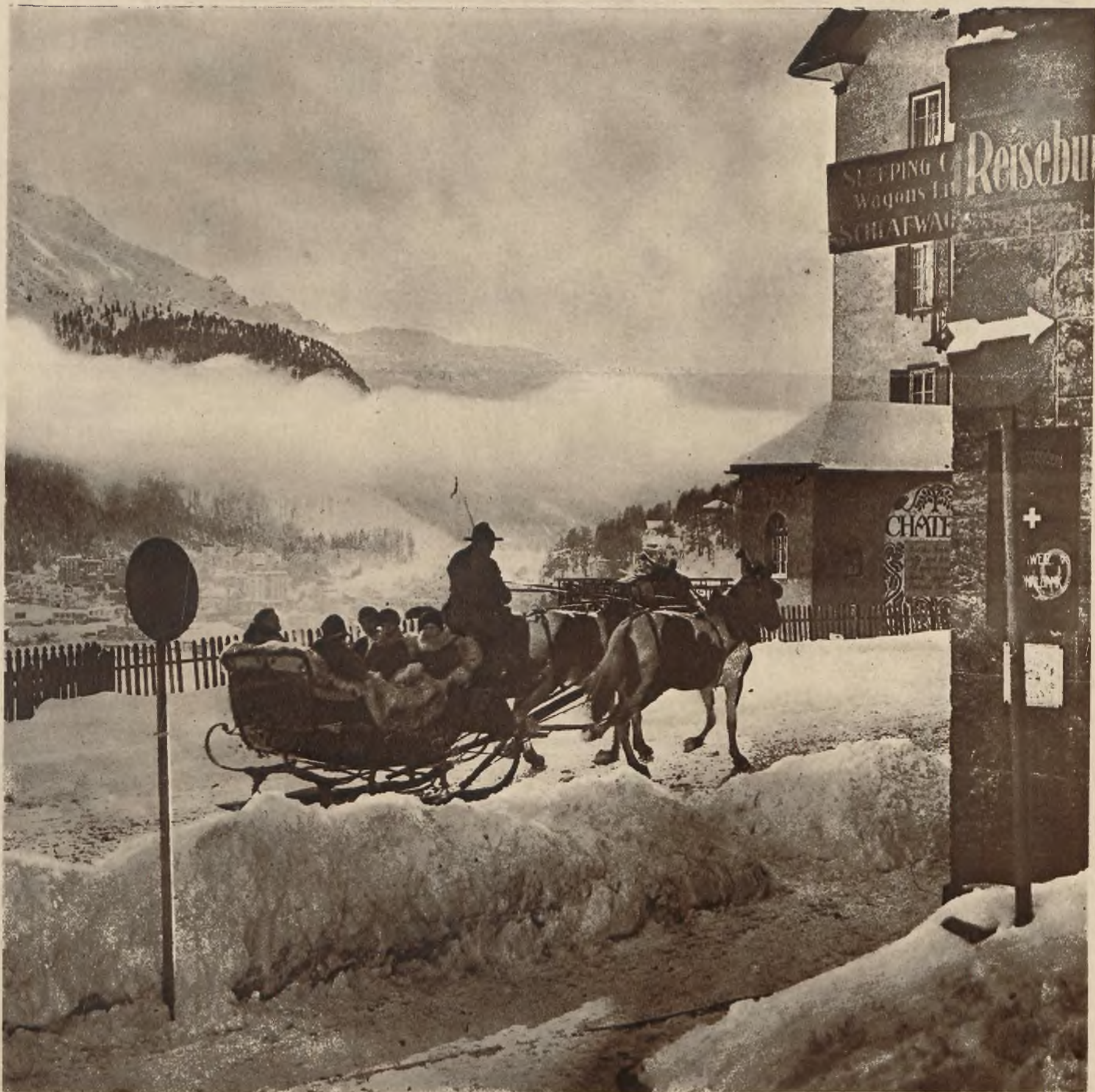
Na zimową Olimpiadę zjeżdżają się do St. Moritz coraz liczniej przedstawiciele całego cywilizowanego świata. Zdjęcie nasze przedstawia grupę nowoprzybyłych gości przed budynkiem stacji kolejowej.