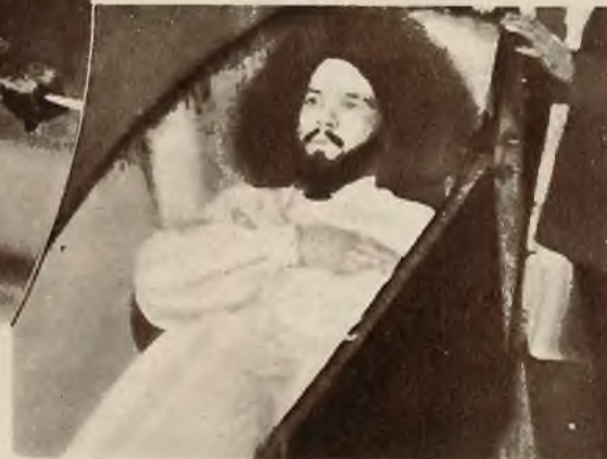
Fakir, który daje się pogrzebać w ziemi na przeciąg 24 godzin, występuje obecnie w Paryżu, gdzie budzi swymi produkcjami łatwo zrozumiałe zainteresowanie.