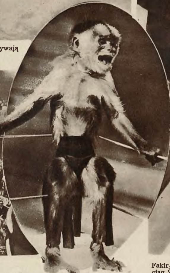
W jednym z zagranicznych cyrków odbywają się zapasy bokserskie małp. Zwycięzca stoi dumnie, czekając na oklaski.