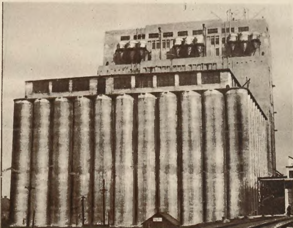
Olbrzymi spichlerz w Port-Richmond (Pensylwania), wybudowany niedawno kosztem 4-ech milionów dolarów.