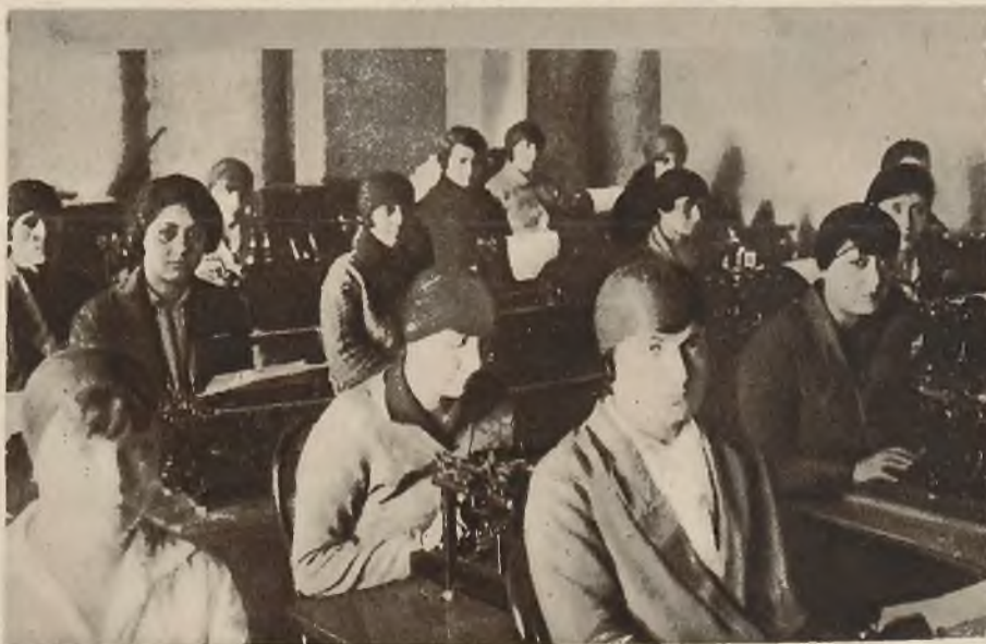
Nowoczesne tureczynki zwyciężają szybko w walce o swe prawa i dzisiaj pracują już w biurach i urzędach na równi z mężczyznami.