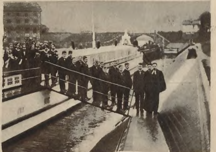
Jeden z okrętów stojących w dokach w Berlinie jest zamieniony na kościół i tam odbywają się nabożeństwa dla rybaków. Na zdjęciu widzimy grupę dzieci rybaków wracających z confirmacji.