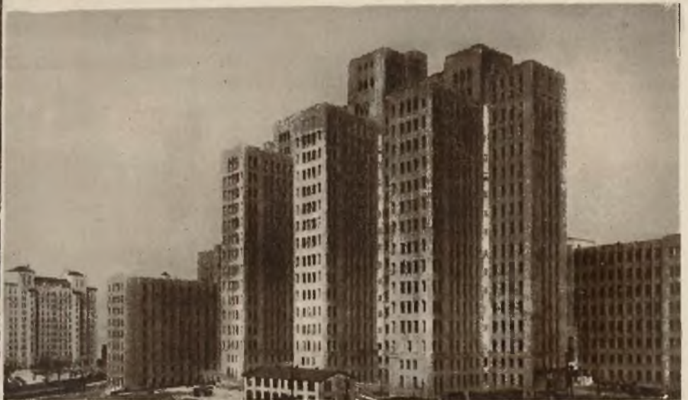
Największe budynki szpitalne posiada New-York, a mianowicie kompleks 15-to piętrowych klinik i szpitali na Broadway.