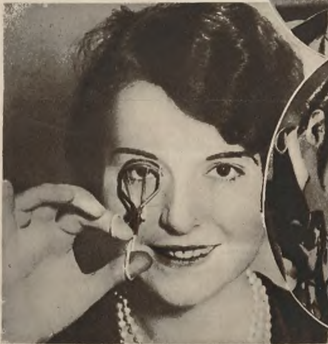
Kobiety dzisiejsze dla swej piękności zdolne są wiele wycierpieć. Oto przyrząd, którym posługują się Amerykanki chcąc powiększyć oczy.