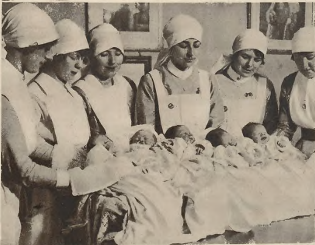
„Biedne dzieci“ będą obchodzili urodziny tylko raz na 4 lata, bo przyszli na świat 29-go lutego.

Na prawo: Plakat wyborczy japoński przedstawiający kandydata na posła rzucającego grochem w złe demony, by je nciszyć.