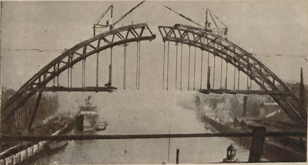
Nowy most kolejowy w New Castle (Anglja) ma 200 m. rozpiętości i jest tak wysoki że oceaniczne okręty mogą pod nim przejeżdżać.