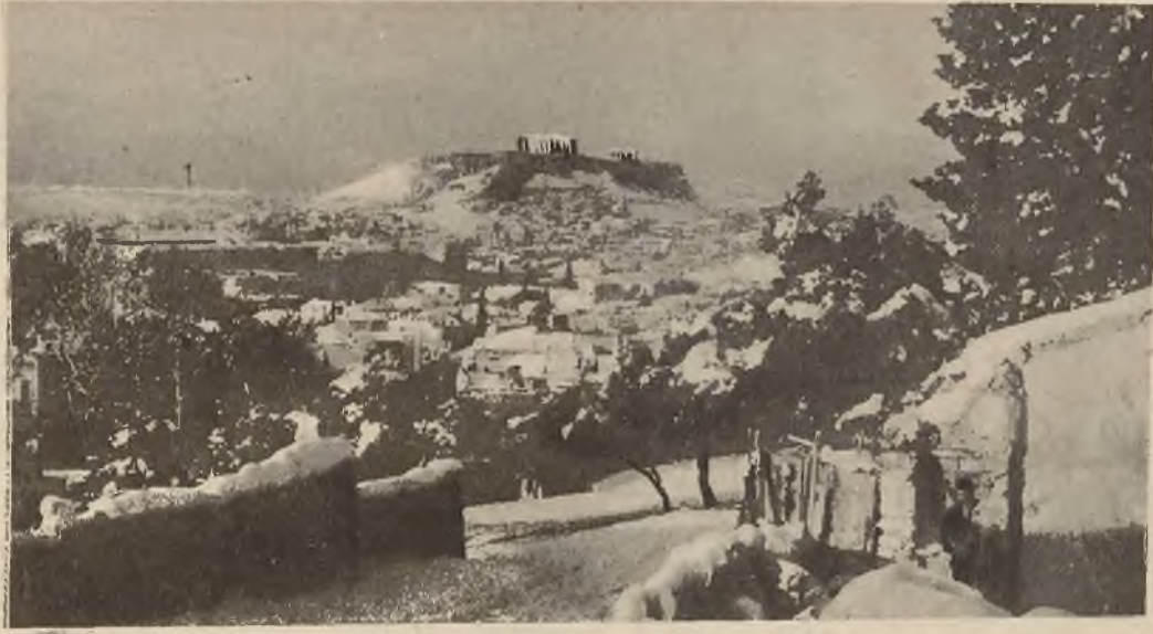
Pierwszy raz od 30 lat w Atenach spadł śnieg i pokrył całe miasto grubą warstwą. Widok miasta i wzgórza Akropolis w szacie śnieżnej.