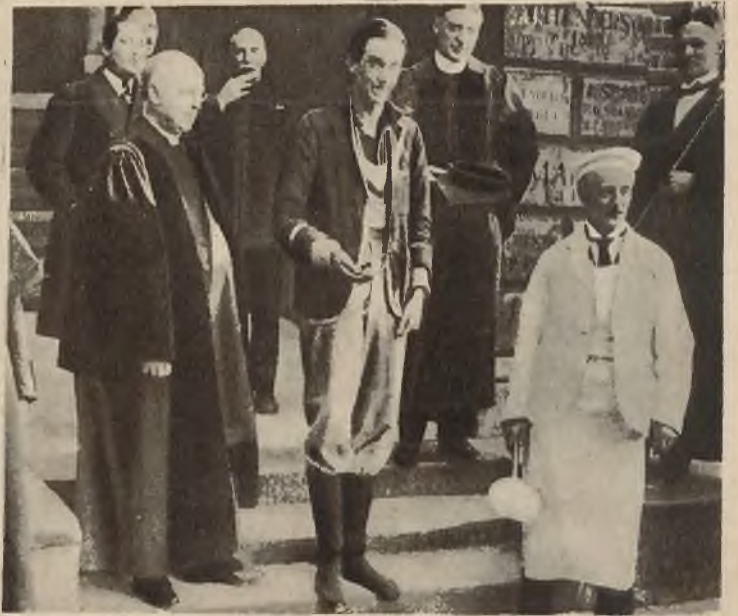
Tłusty wtorek w Anglii święcony jest z wielką pomysłowością w szkołach. Między innymi zabawami odbywa się walka o wielki pączek; zwycięzca który zdobył największy kąsek pączka odbiera powinszowania od uczniów i rektora.