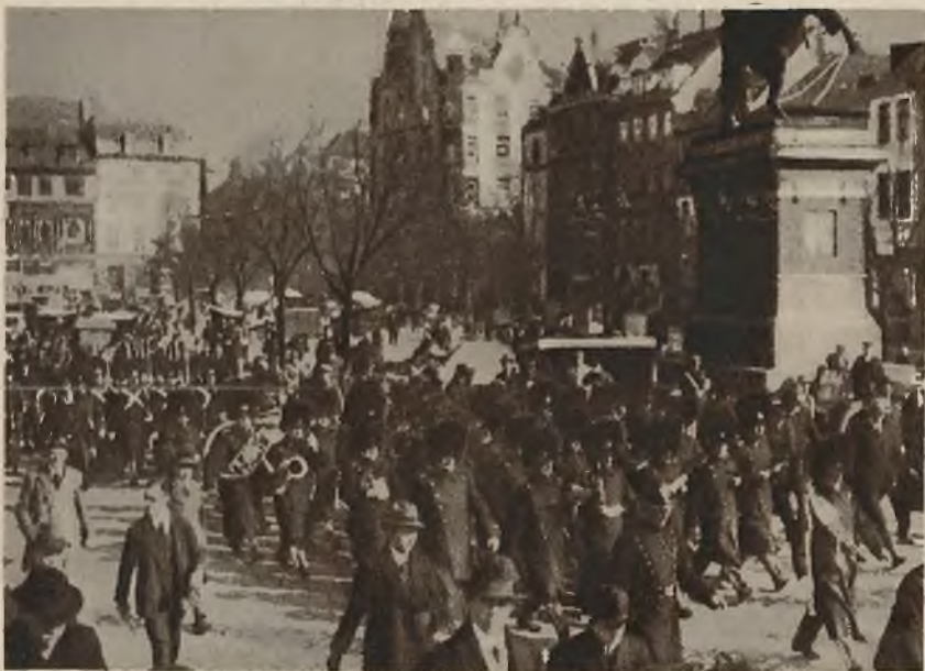
Parada gwardji królewskiej w Kopenhadze.