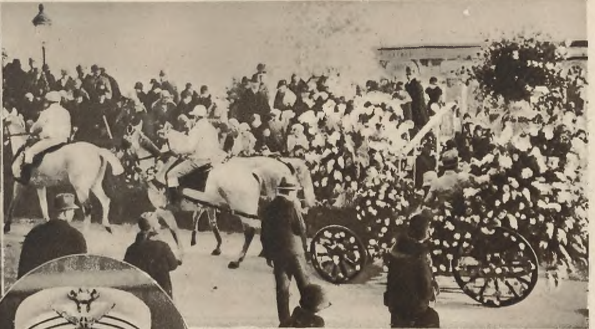
W „Półpoście“ (Mi-Càreme) odbyły się w Nicei tradycyjne bitwy kwiatowe. W owalu: Zmarły dowódca naczelny armji włoskiej podczas wojny, marszałek Diaz.