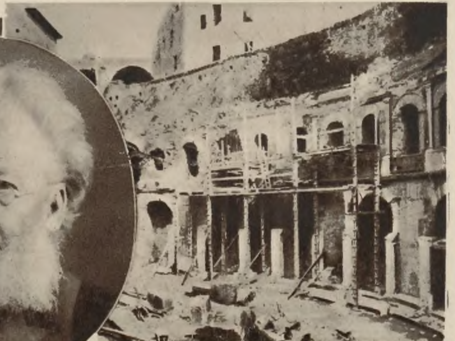
W Rzymie przeprowadza się obecnie restaurację jednego z budynków starożytnych z czasów Trajana stojącego między Forum Trajana a Villa Nazionale.