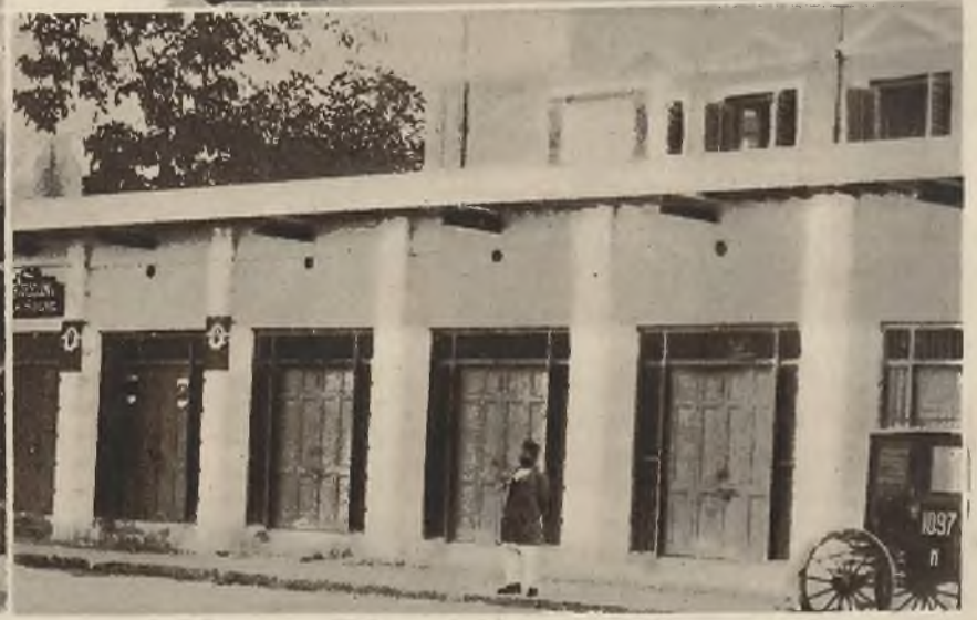
Ludność Indji protestuje przeciwko mieszaniu się rządu angielskiego w jej prywatne interesy i w odpowiedzi na przybycie angielskiej komisji gospodarczej, dla zbadania stanu ekonomicznego kraju, kupcy Kalkuty zamknęli sklepy.