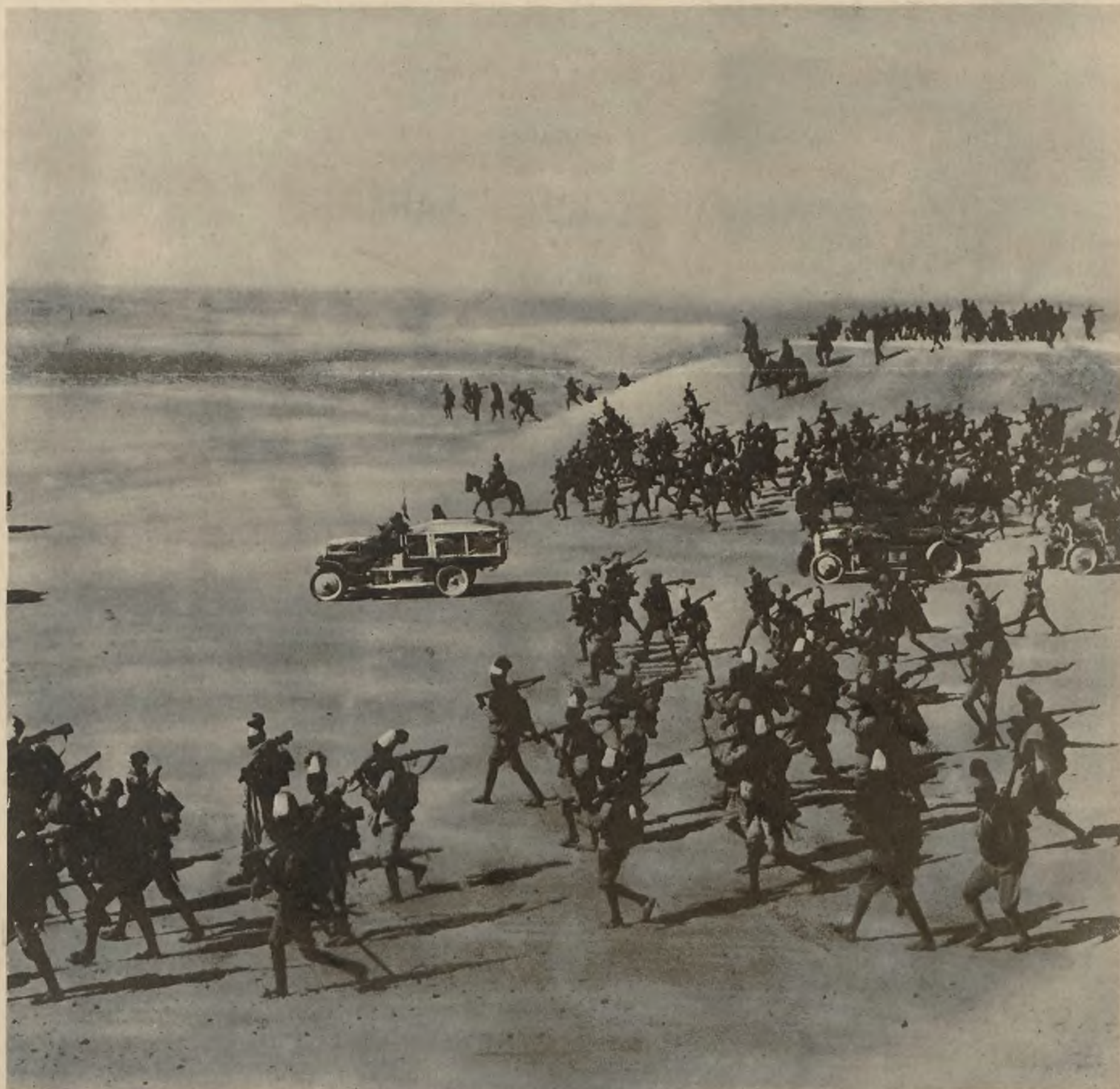
Po uśmierzeniu nowych rozruchów w Libji, wywołanych przez szcep Senussi, kolonialne wojska włoskie składające się z Iscarich, wkraczają włąb pustyni, kierując się ku Cyrenaice. Wojskom towarzyszą samochody pancerne, ciężarowe i tanki.