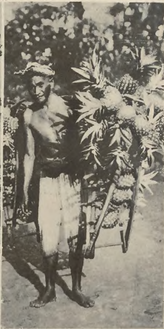
W krajach podzwrotnikowych jest obecnie pora pierwszych zbiorów. Zdjęcie na lewo przedstawia Indianina z puszczy brazylijskich dźwigającego potężny ładunek orzechów kokosowych. W środku widzimy murzynki z brytyjskiej Afryki wschodniej niosące na głowie wspaniałe banany. Na prawo krajowiec na wyspie Jawa z obfitym zbiorem ananasów.