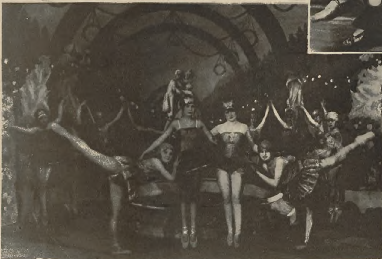
Scena z baletu „Zaczarowany kurant“, którego premiera odbyła się 7 b. m. w Operze warszawskiej.