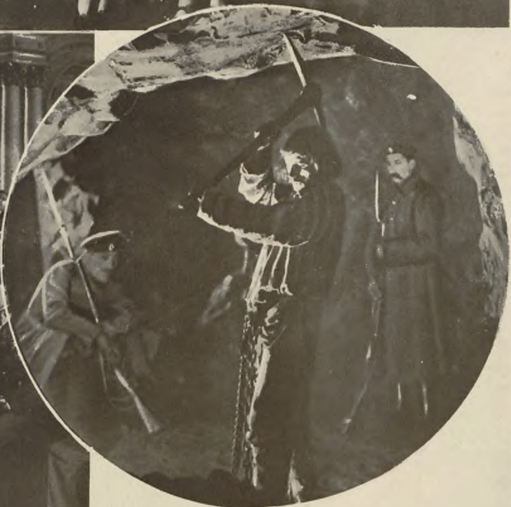
Scena z największego polskiego filmu historycznego „Huragan”, którego akcja toczy się w czasie powstania styczniowego.