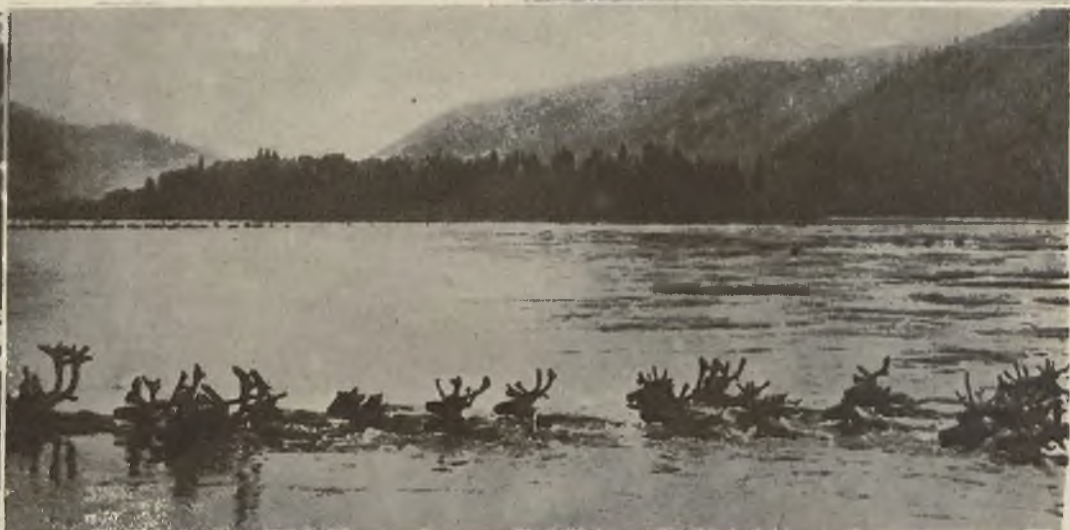
Horda północno-amerykańskich reniferów, żyjących w dzikim stanie, przepływa gromadnie rzekę.