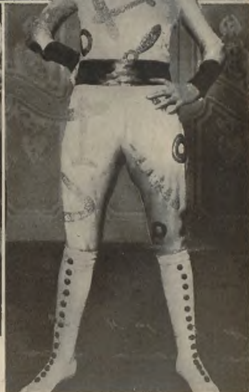
Na prawo: Na balu „Dream of Fair Women“ w hotelu Claridge w Londynie, nagrodę otrzymała miss Campbell za fantastyczny kostjum z r. 1940.