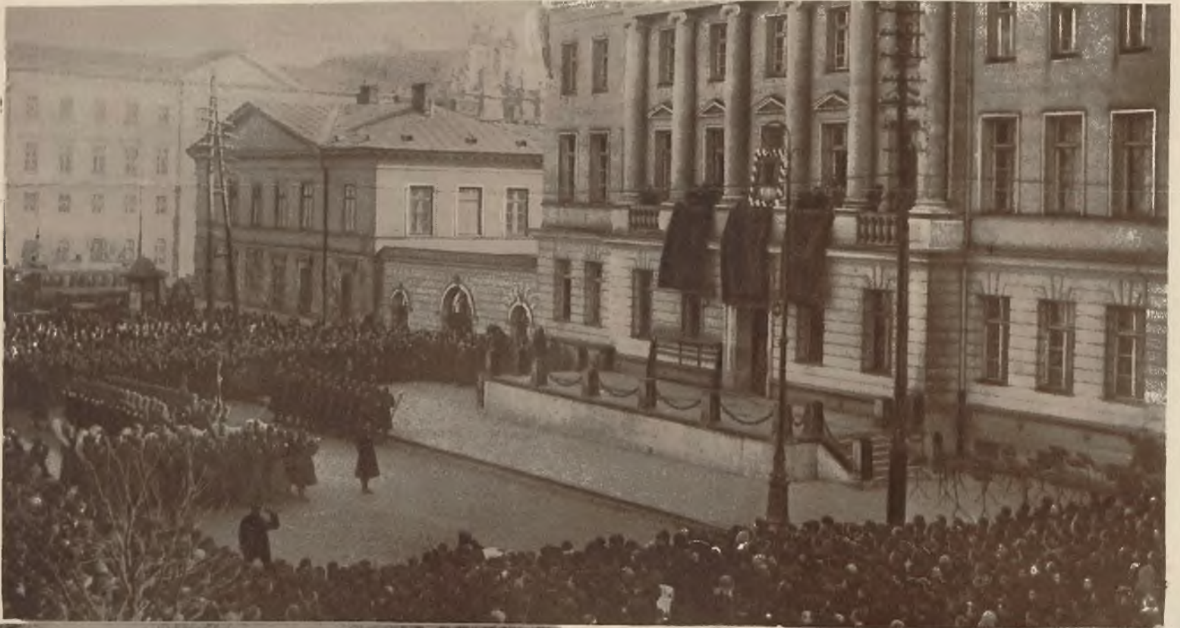
Uroczysta zmiana warty w Warszawie przed komendą miasta przez oddział 36 p. p. ze sztandarem z okazji imienin pierwszego marszałka Polski Józefa Piłsudskiego.