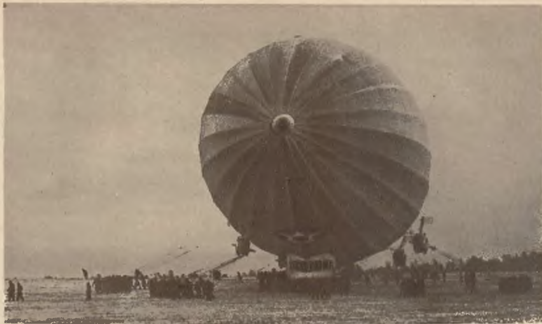
Los Angeles znany Zepelin zbudowany w Niemczech dla Ameryki, dokonał ostatnio lotu rekordowego przez kanał Panama, przy którym wykazał nadzwyczajną wytrzymałość motorów. Zdjęcie przedstawia powrót Zepelina na lotnisko w Lakehurst.