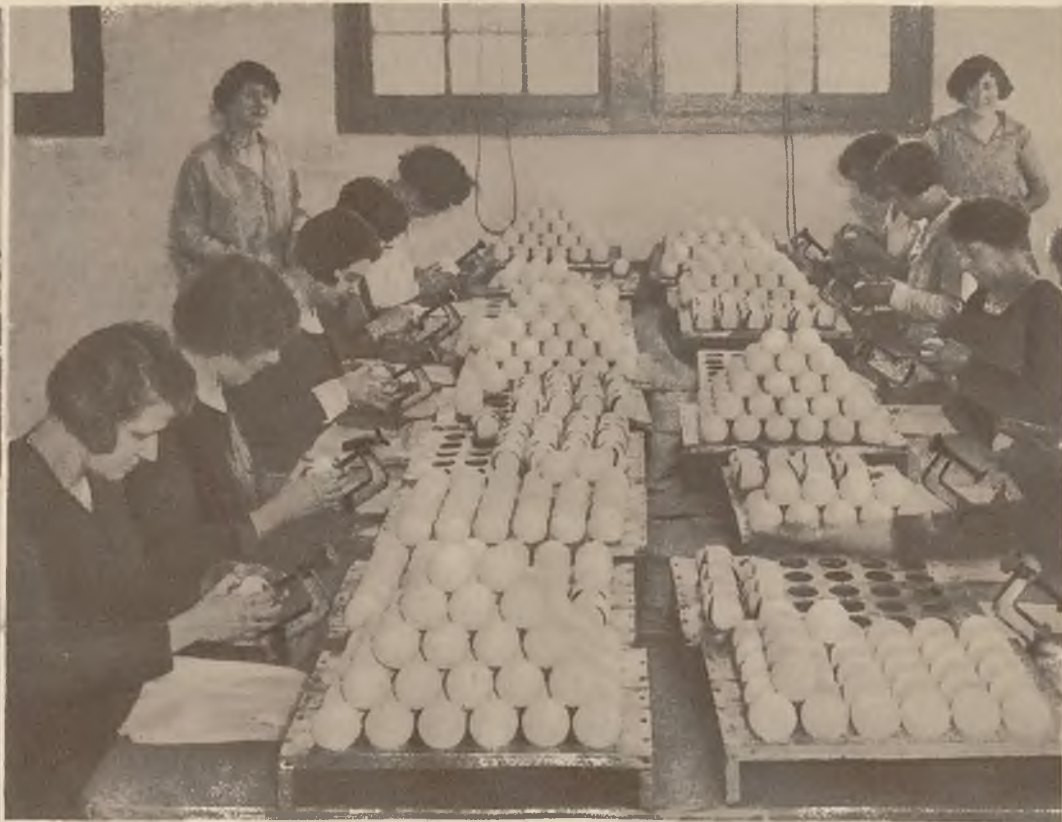
Fabrykacja piłek tenisowych w Anglii przed sezonem.

Na lewo: Dnia 6 kwietnia mija 40 lat od śmierci wielkiego malarza niemieckiego Albrechta Dürera.