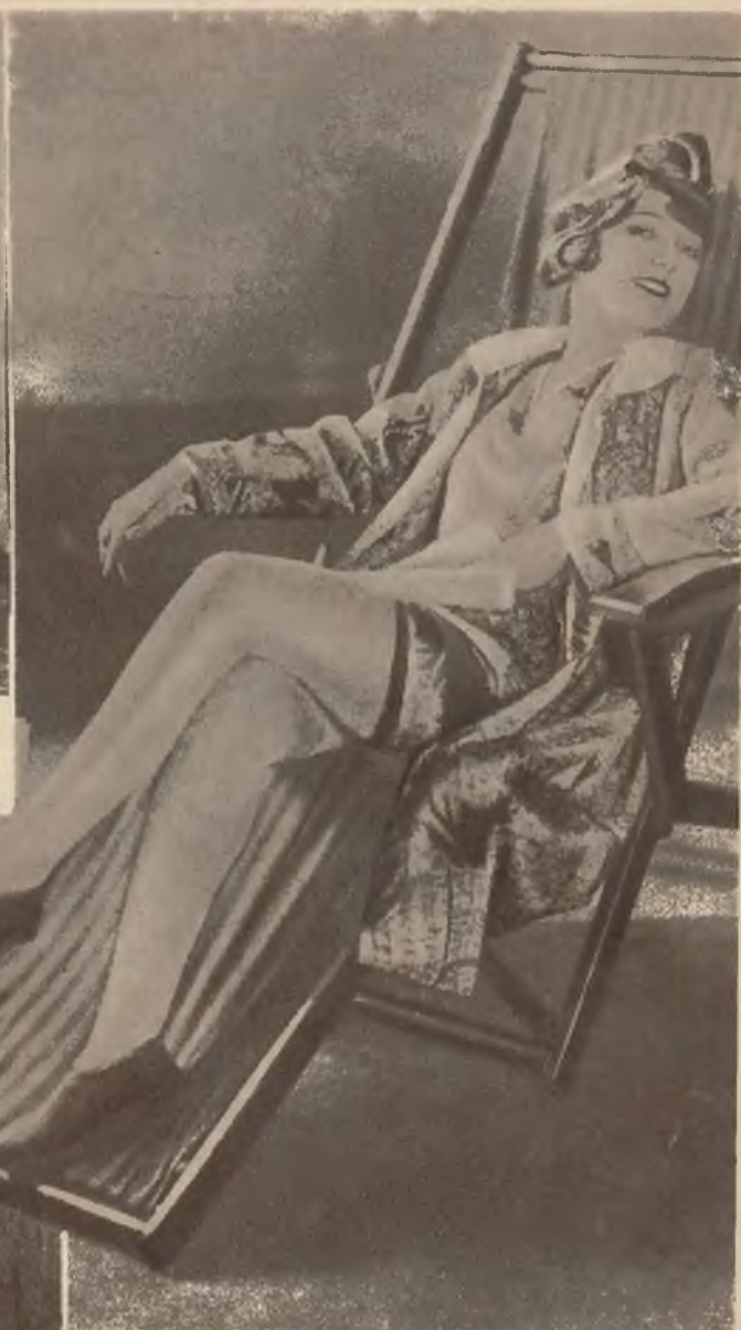
Na Florydzie, która jest amerykańską Rivierą, cały rok trwa sezon kąpielowy.