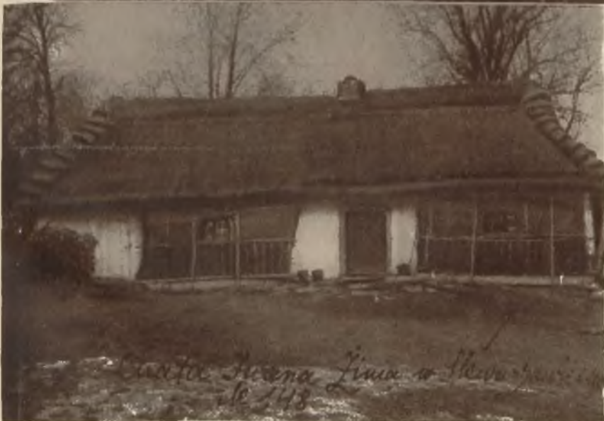
Niesamowite zjawiska, których widownią jest wieś Skwarzawa Nowa obok Żółkwi, gdzie w mieszkańcin miejscowego chłopca Iwana Zinia jakaś nadprzyrodzona siła wyprawia harce, wywołały zrozumiałe zainteresowanie wśród naszych Czytelników. Zamieszczone dwie fotografie przedstawiają chatę Iwana Zinia oraz jego samego z rodziną.