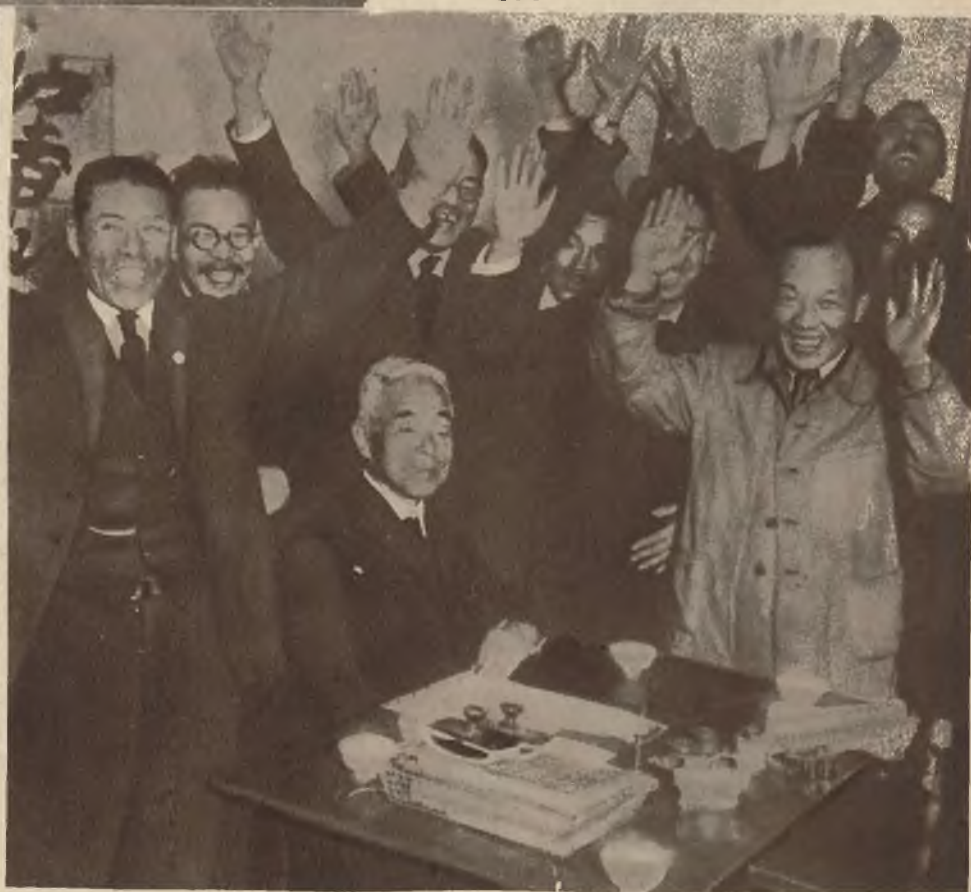
Ciekawy obrazek z wyborów w Japonii, na którym widzimy, że nawet spokojni Japończycy zapalają się jeżeli chodzi o politykę.