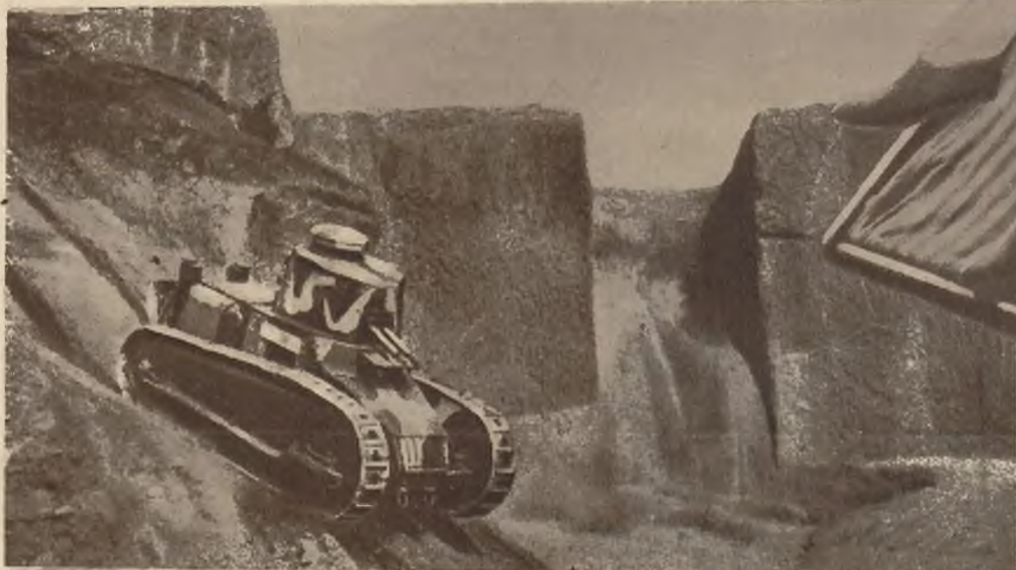
Na lewo: Podczas manewrów armii włoskiej demonstrowano olbrzymie tanki bojowe, które są tak zbudowane, że mogą pokonać największe trudności terenu.