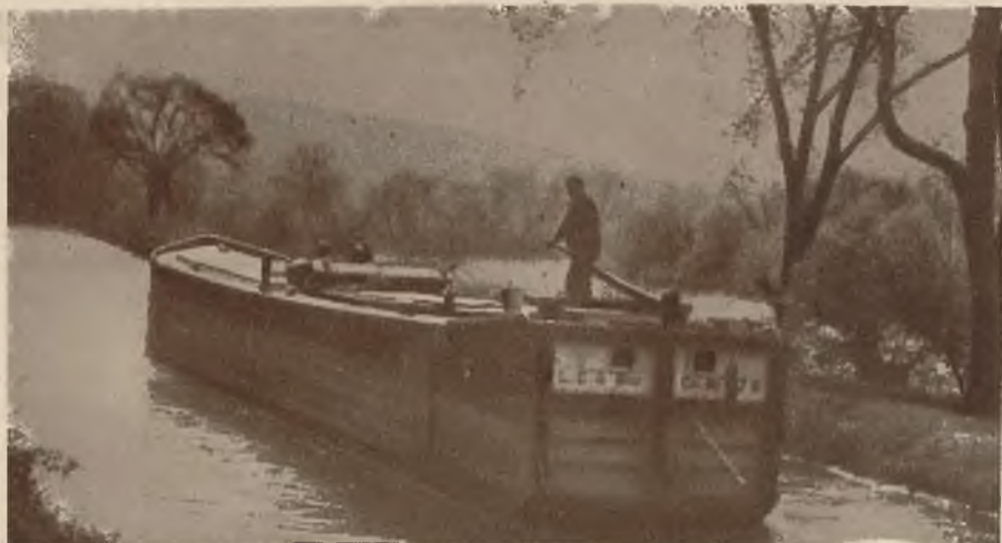
Obrazek z żeglugi śródlądowej. Mały stateczek kursujący po kanałach łączących Odrę i Wisłę.