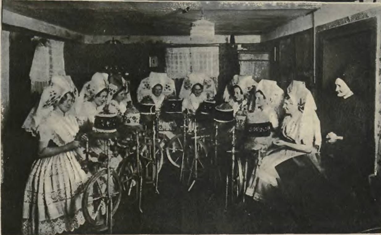
Na lewo: Rzadki obecnie obraz prądek przy wrzecionach, w malowniczych strojach Serbów lużyckich z Spreewaldu.