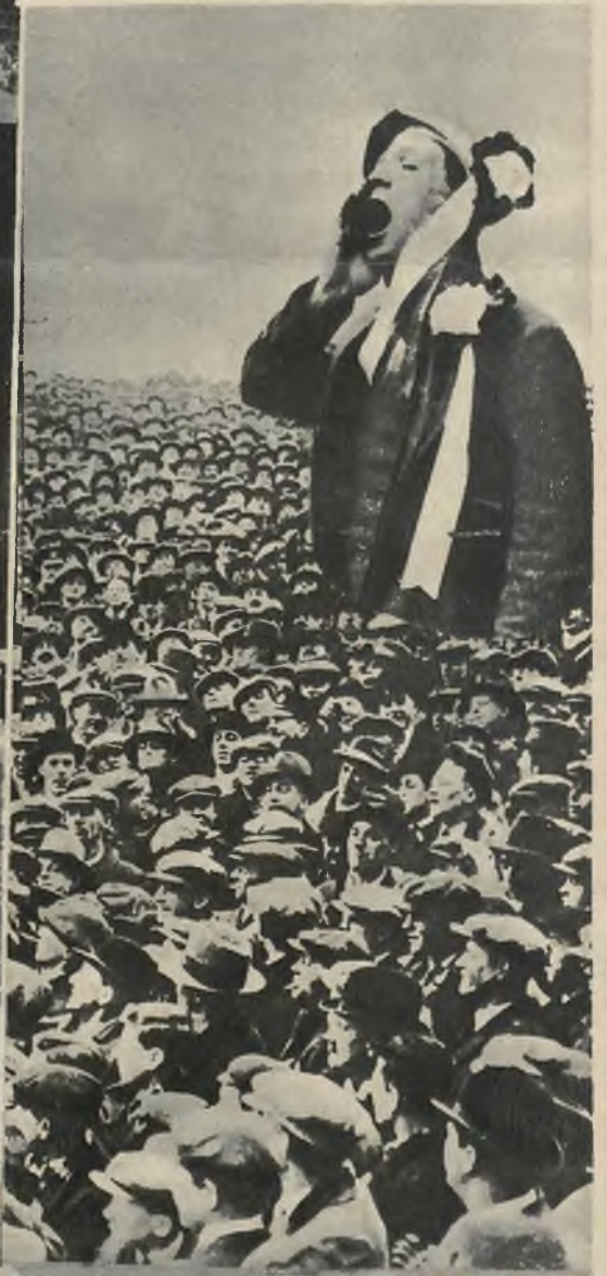
Publiczność na meczu finałowym o puchar Anglii w Londynie. U góry fanatyk klubowy zachęcający podczas meczu swą drużynę.