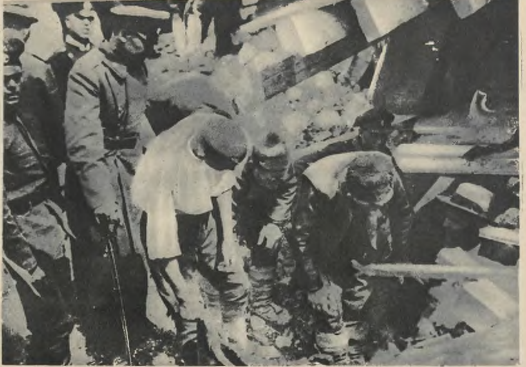
Pierwsze zdjęcia z strasznego trzęsienia ziemi w Bułgarii. Obrazy z Filipopolu, który podczas katastrofy najwięcej ucierpiał. Na lewo ruiny kompletnie zniszczonego domu. Na prawo ruiny restauracji, w której gruzach zginęło kilkanaście osób.