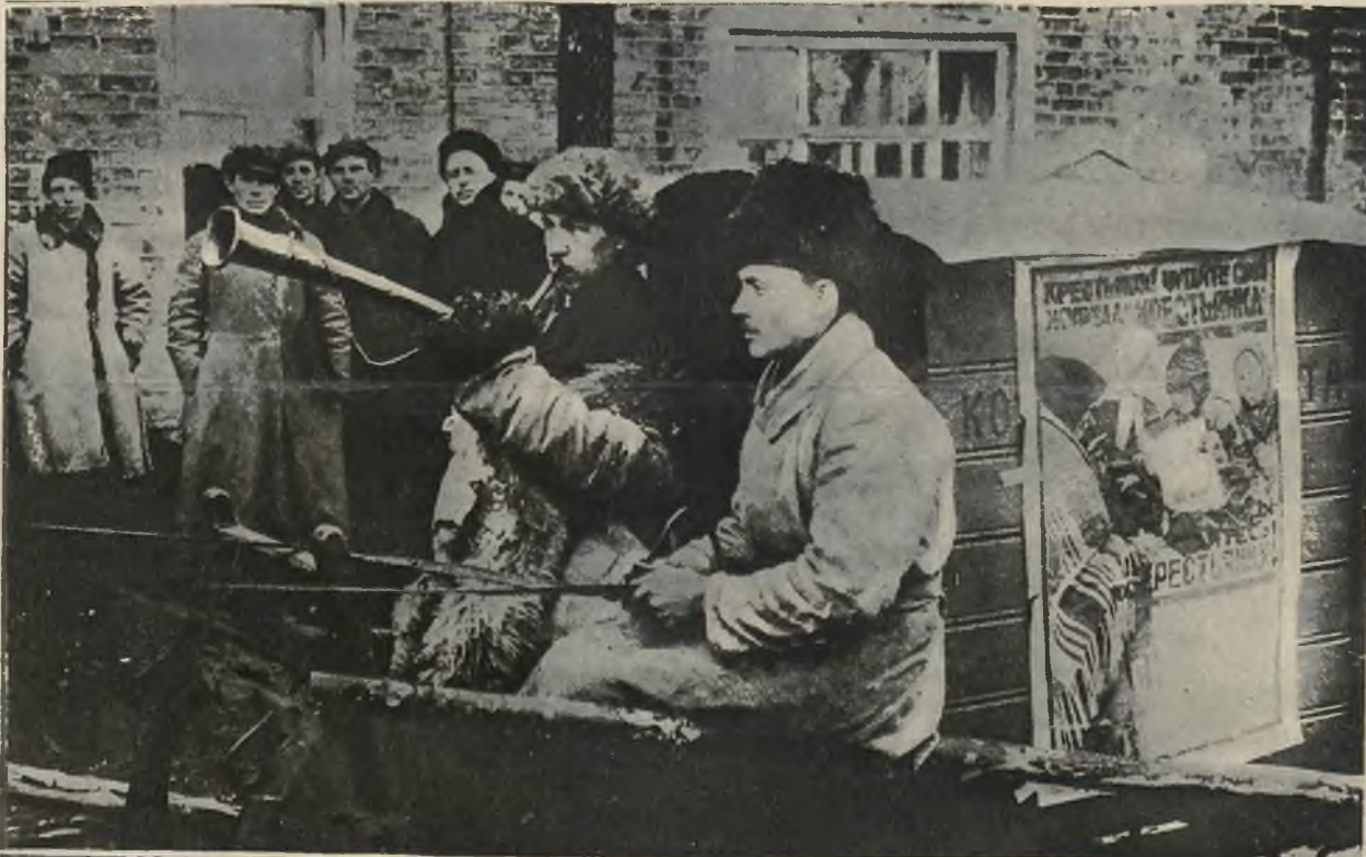
Na lewo: Rosyjska poczta na saniach daje trąbką znać o swym przyjeździe.