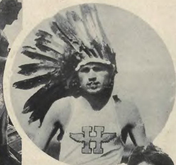
Amerykański lekkoatleta Buchanan, zwycięzca biegu maratońskiego, w którym udział brali także liczni Indianie, otrzymał jako odznaczenie tytuł i ozdobę wodza indyjskiego.