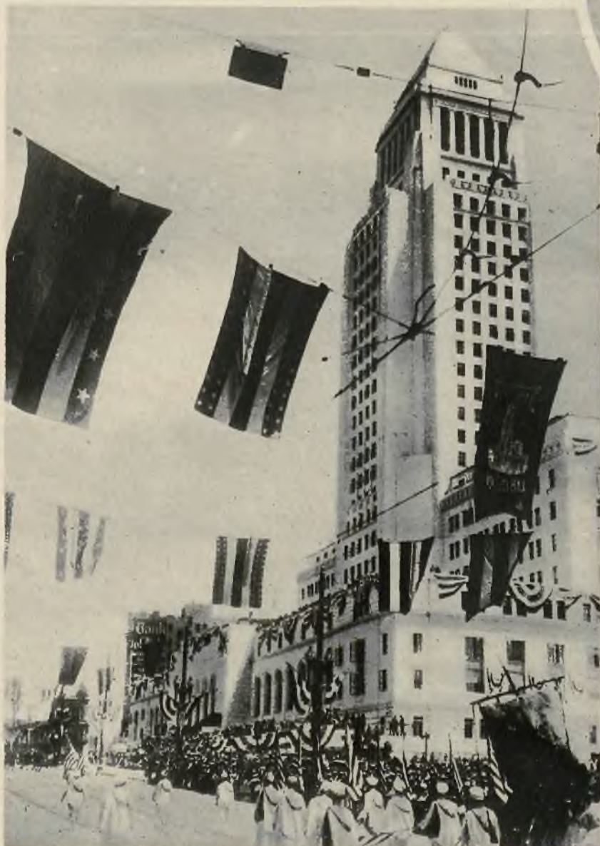
Uroczystości otwarcia nowego gmachu magistratu w Los Angeles.