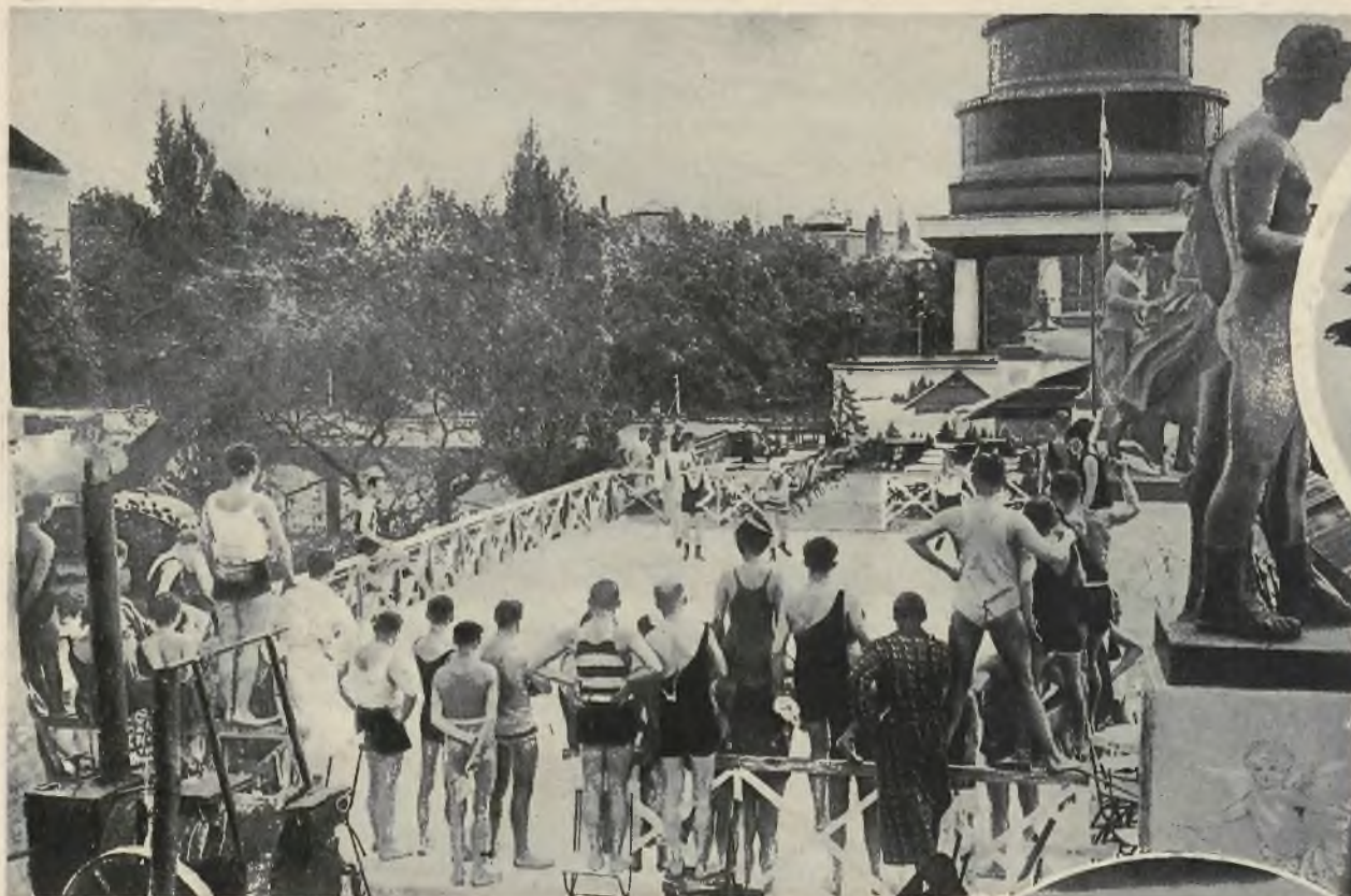
Ślizgawka na dachu. Pewien wielki berliński dom rozrywkowy urządził na dachu dla swych gości sztuczną ślizgawkę, na której w cieniu drzew i w promieniach słońca, w kostjumach kąpielowych zażywać można sportu łyżwiarskiego.