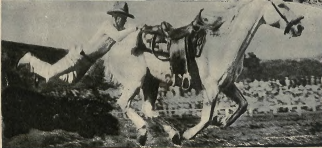
Na lewo: Zdjęcie z popisu cowbojów w Sacramento. Jeździec wskazuje od tyłu na konia będącego w pełnym galopie.