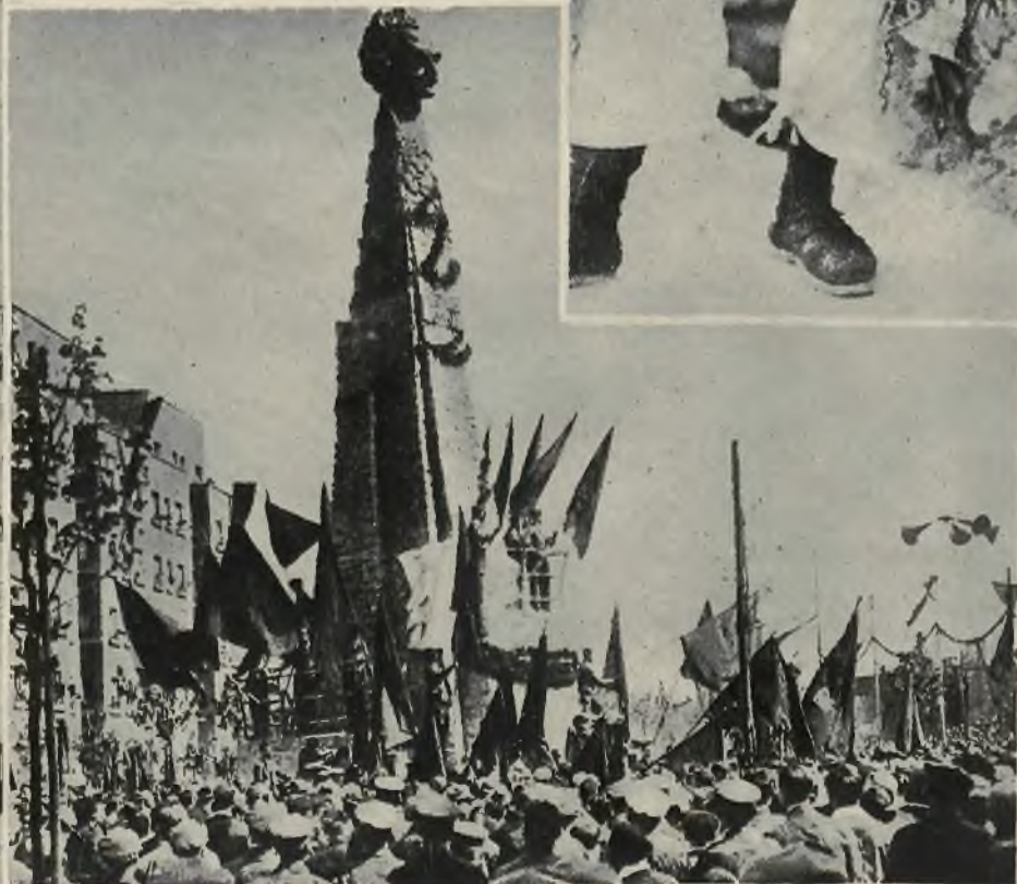
Pierwszy pomnik socjalistyczny w Anstrji. Pomnik Ferdynanda Lasalle'a w Wiedniu.