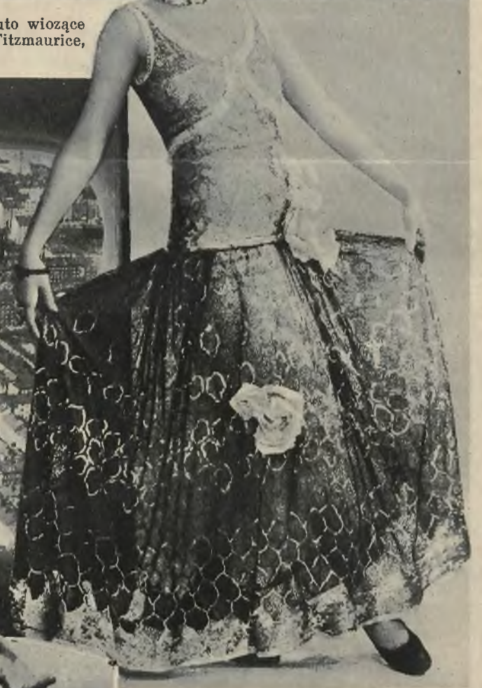
Toaleta wieczorowa nagrodzona pierwszą nagrodą na konkursie w Hollywood.