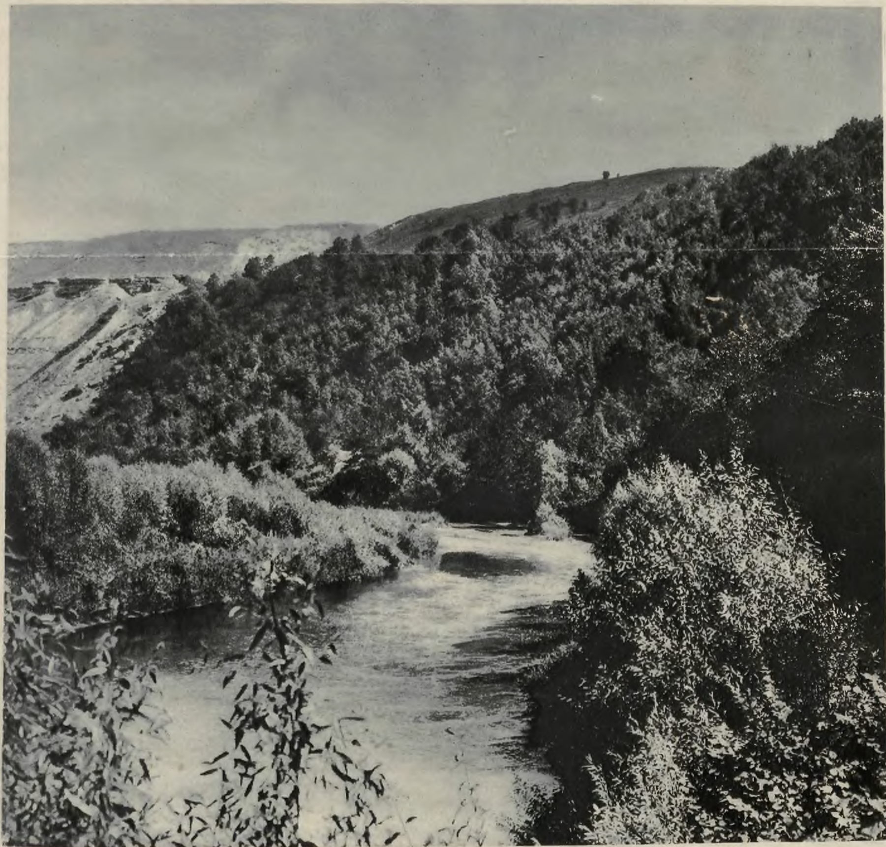
Jar Seretu w Holihradach w województwie tarnopolskiem.