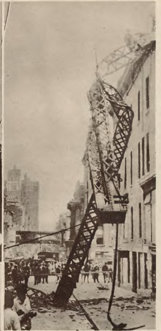
W czasie budowy olbrzymiego drapacza chmur w Nowym Jorku zwałił się na ulicę potężny dźwigar metalowy tamując zupełnie ruch na jednej z najruchliwszych ulic.