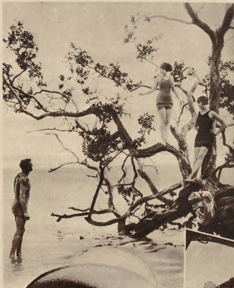
Na lewo: Sielanka kąpielowa, która przy panujących u nas wciąż zimą, działa groteskowo.