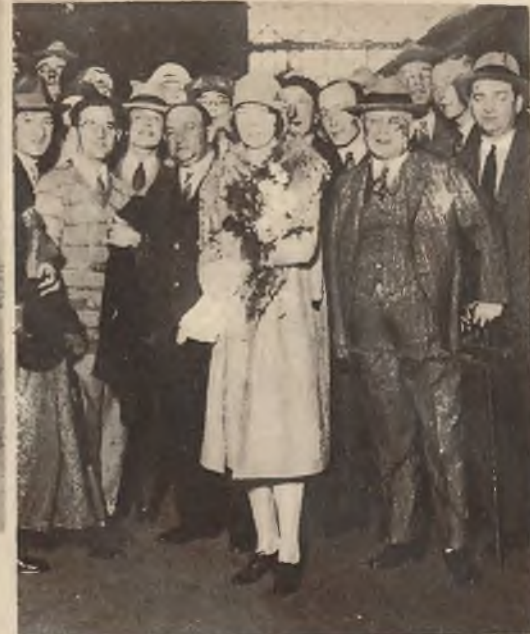
Słynna gwiazda filmowa amerykańska Liljana Gish przybyła do Berlina.