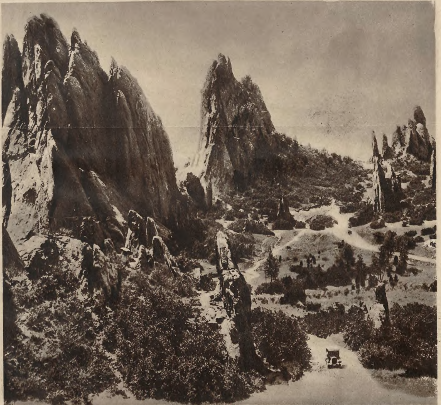
„Ogrodem Bogów“ nazywają Amerykanie przedstawioną na powyższym zdjęciu część gór Piaskowych w Colorado. Wygodne drogi samochodowe uprzystępniają ten uroczy zakątek najszerszymi rzeszom turystów.