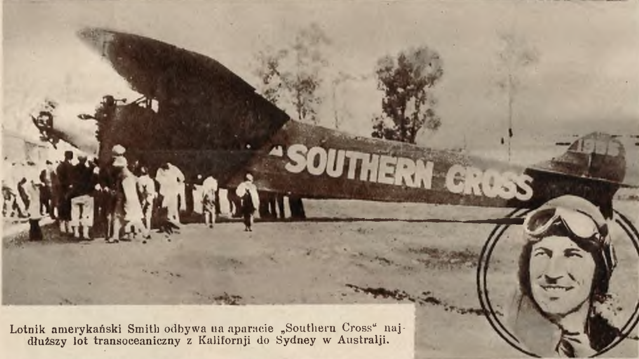
Lotnik amerykański Smith odbywa na aparacie „Southern Cross“ najdłuższy lot transoceaniczny z Kalifornji do Sydney w Australji.