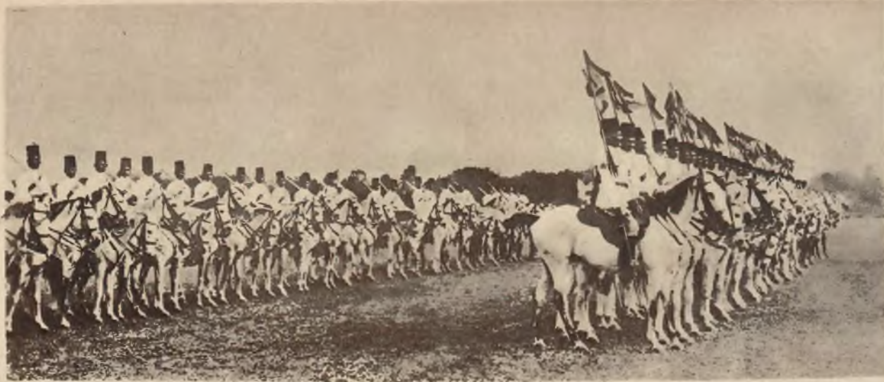
Défilada egipskiej kawalerji przed królem Fuadem w Kairo. Uwagę zwracają wspaniały materiał koński.