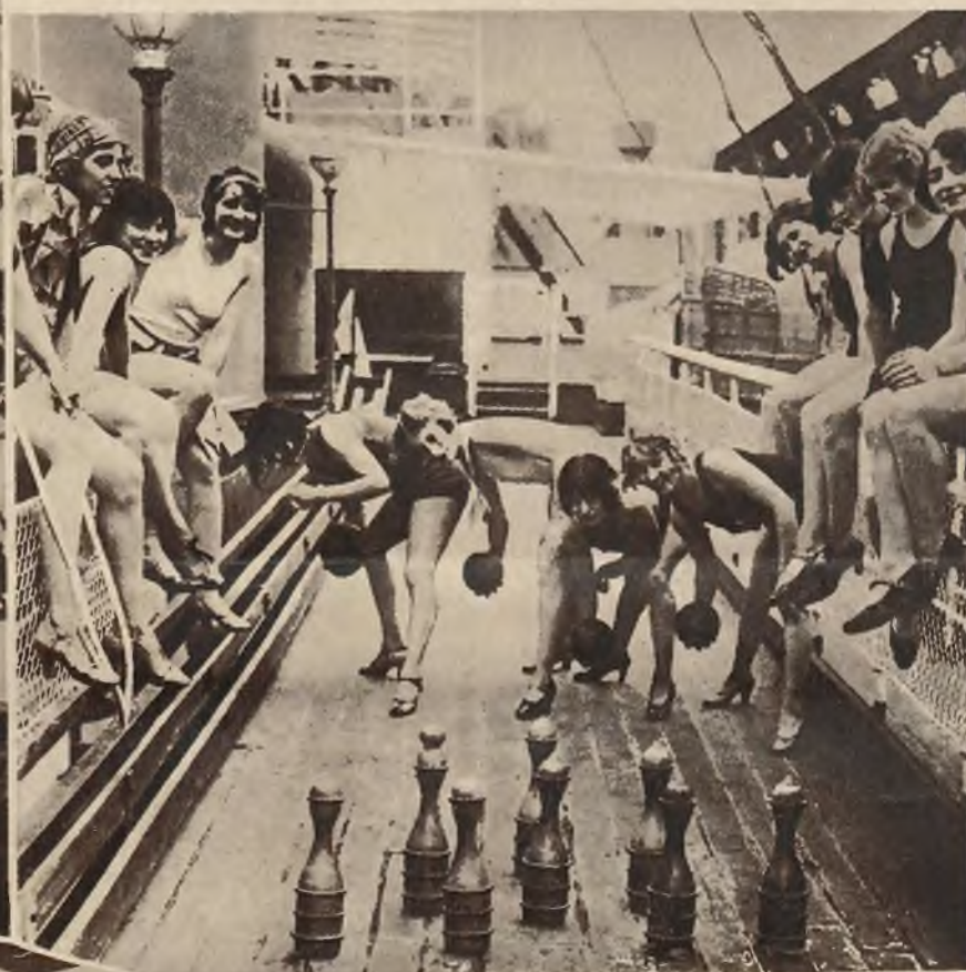
Słynne Tiller Girls w czasie jazdy przez Ocean, zabawiają się na pokładzie grą w kręgle.