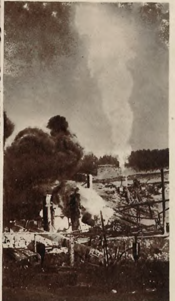
Zdjęcie z olbrzymiego pożaru w szynach naftowych w zagłębiu runońskim w Moreni.