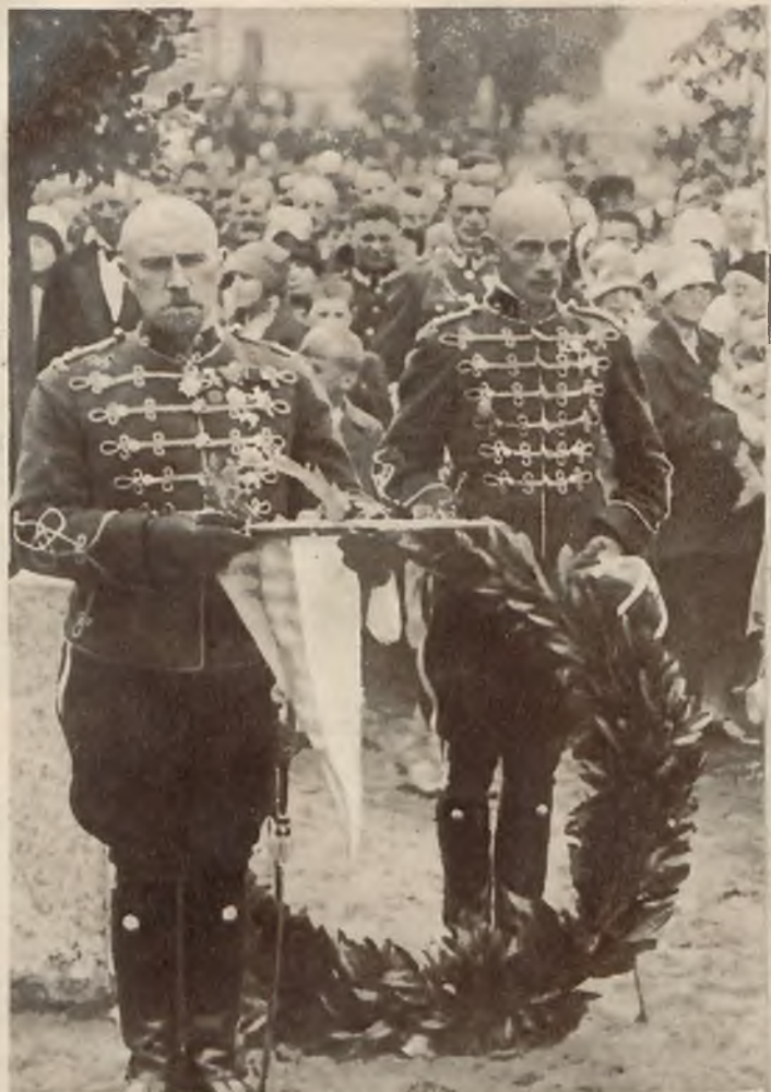
W czasie uroczystości 10-lecia powstania 2-go pułku ułanów w Suwałkach, złożyli oficerowie estońscy wieniec na grobie żołnierzy pułku, poległych w wojnie z bolszewikami.