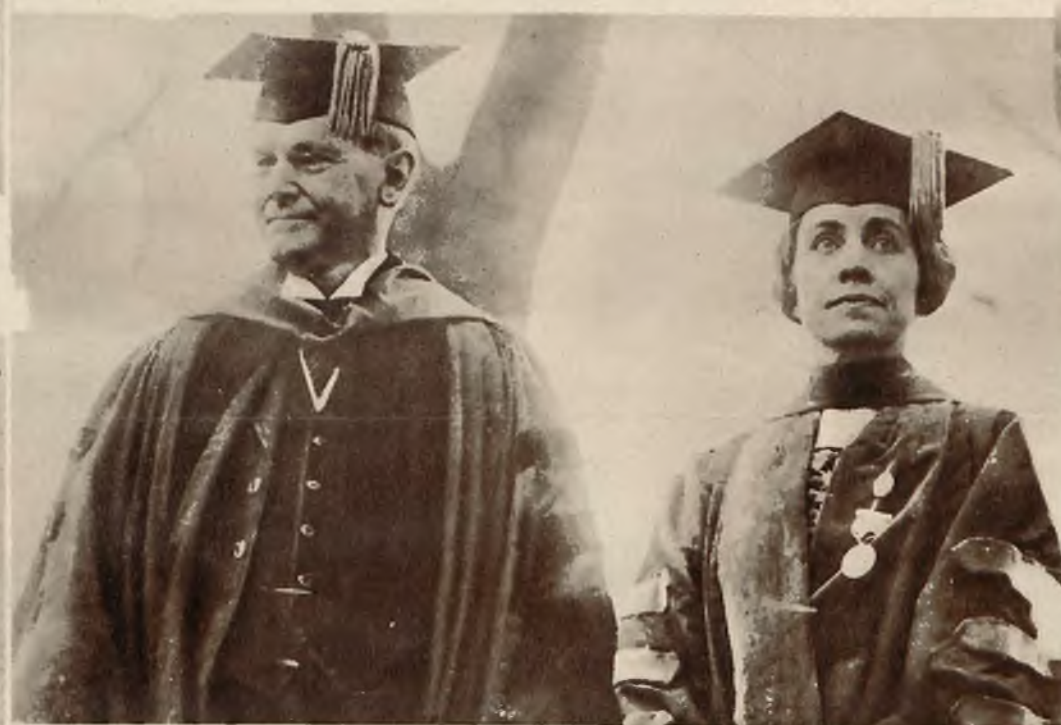
Prezydent Stanów Zjedn. Coolidge z małżonką wzięli udział w uroczystościach 150-lecia najstarszego uniwersytetu amerykańskiego t. zw. Philip Academy w Andover.