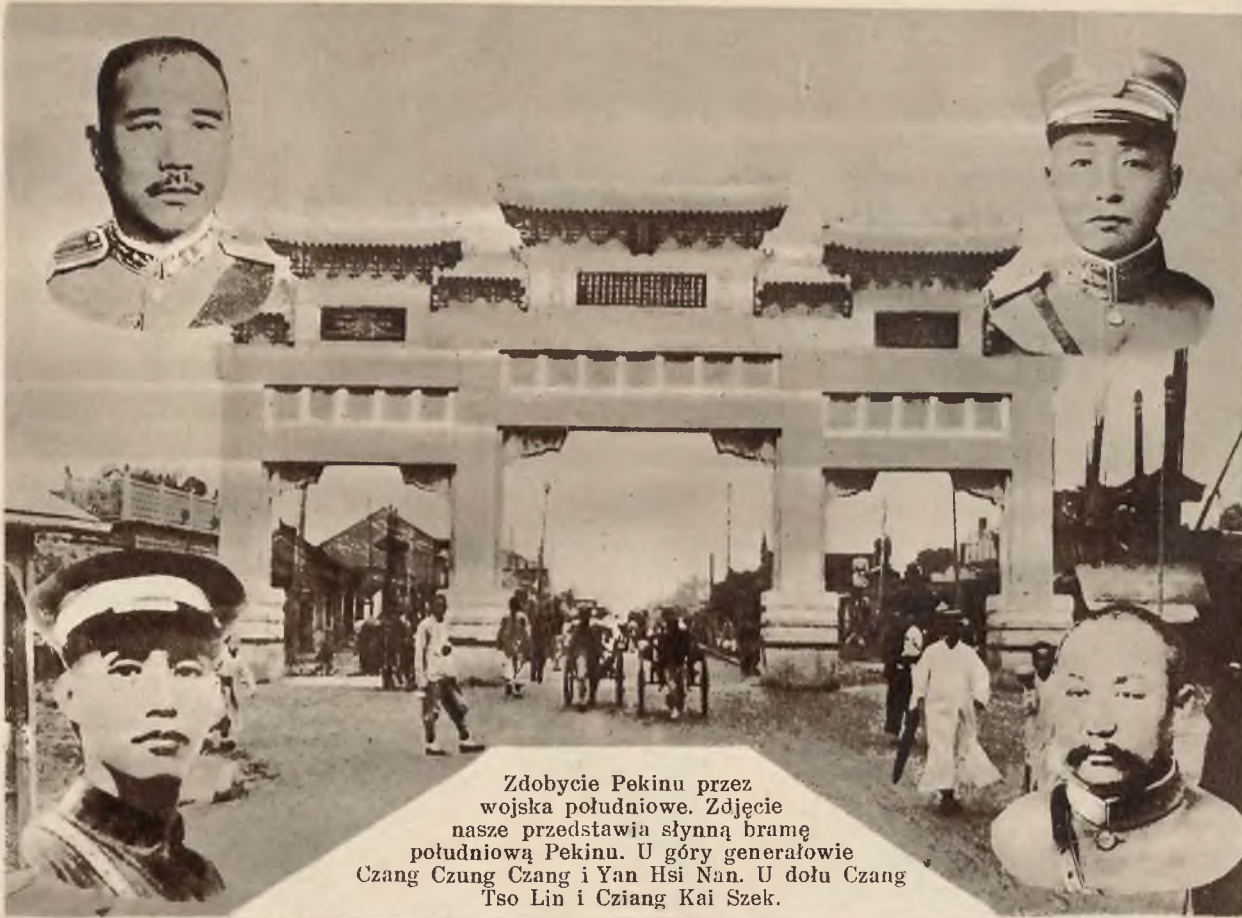
Zdobycie Pekinu przez wojska południowe. Zdjęcie nasze przedstawia słynną bramę południową Pekinu. U góry generałowie Czang Czang i Yan Hsi Nan. U dołu Czang Tso Lin i Cziang Kai Szek.