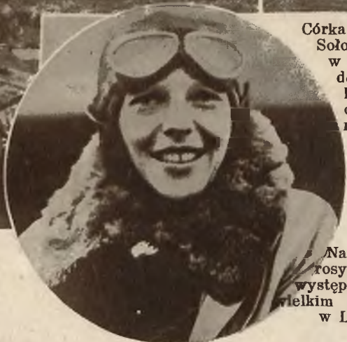
Na prawo: Amerykanka Earhart jest pierwszą kobietą która przeleciała cały Atlantyk.