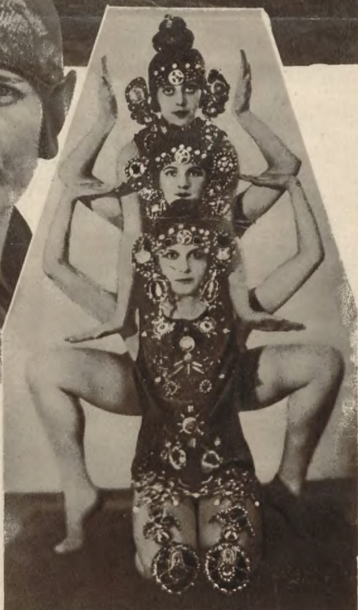
Na prawo: Balet rosyjski Tsaszhenki występuje obecnie z wielkim powodzeniem w Londynie.