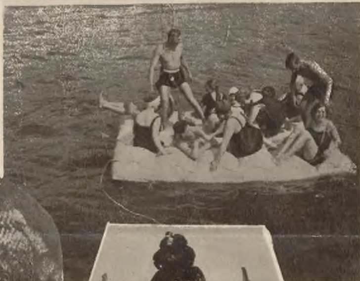
Na prawo: Oryginalna łódź gumowa napełniona powietrzem, która nie może utonąć.