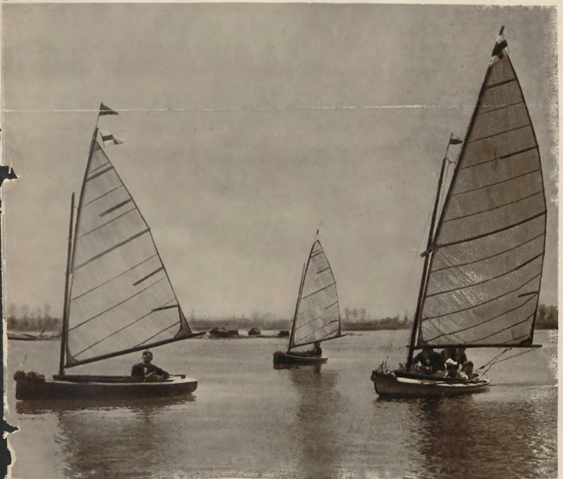
Inicjatywy dyrektora teatru Tadeusza Skarżyńskiego powstał w Płocku klub mający za zadanie propagandę sportu żaglowego. Zdjęcie nasze przedstawia członków klubu na jolkach sportowych pod żaglami.