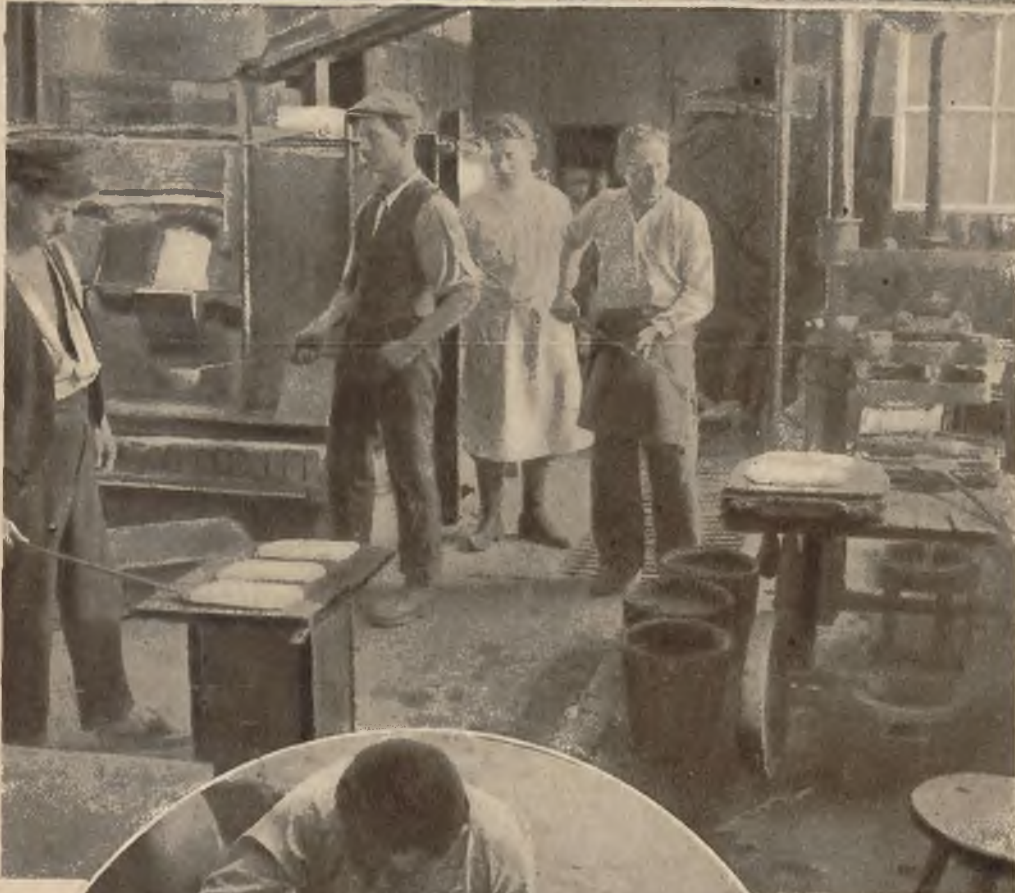
Na lewo: Wnętrze pracowni szklanych mozaik. Wspaniałe barwne mozaiki powstają przez nakładanie różnokolorowych sztabek szklanych na płytę pokrytą miękkim kitem.