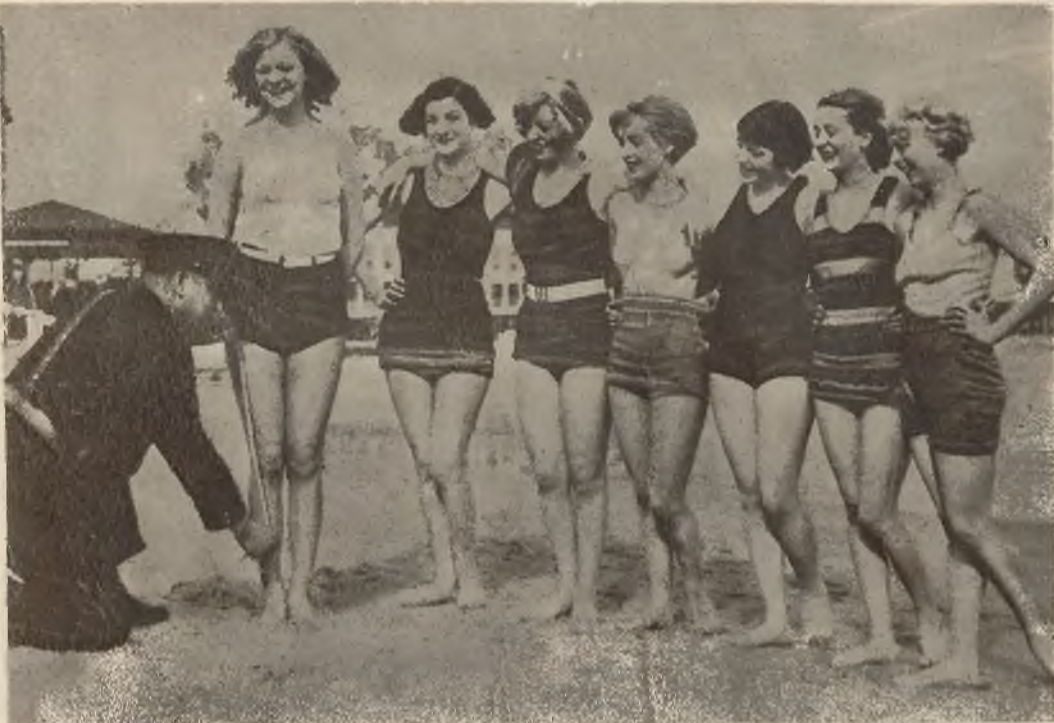
Amerykańska moralność. Oficer policji mierzy kąpiącym się w Atlantic City „girls“ kostjomy, czy nie są — niewiadomo — czy za krótkie czy za długie.