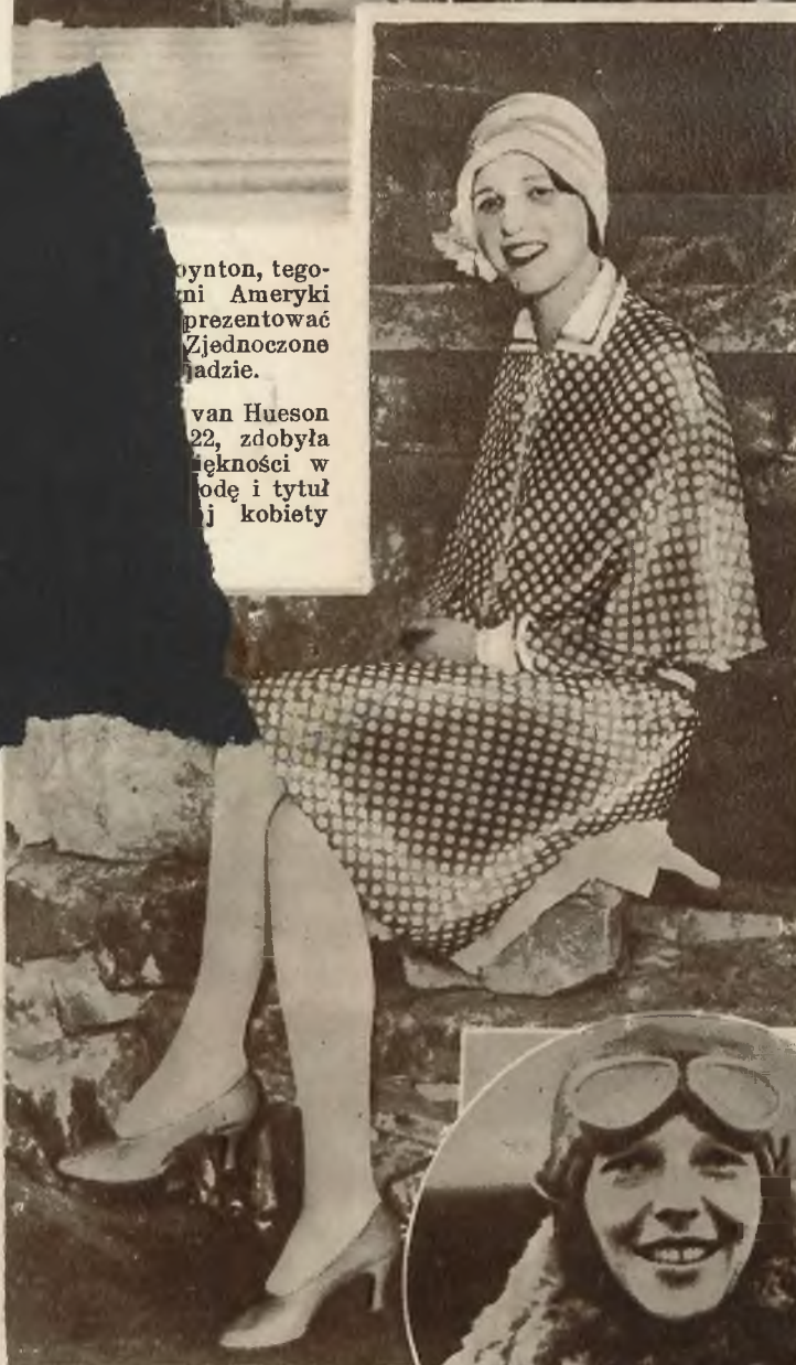
nynton, tego- ni Ameryki prezentować Zjednoczone ładzie.