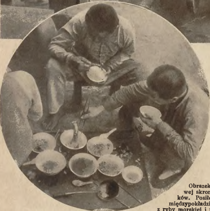
Obrazek z przysłowiowej skromności chińczyków. Posiłek kulisów na międzypokładzie składający się z ryby morskiej i ryżu.