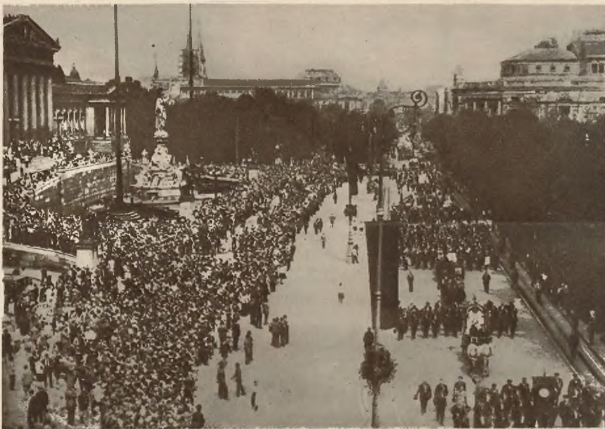
Na lewo: Z uroczystości szubertowskich w Wiedniu. Pochód 180 000 śpiewaków na tle parlamentu, uniwersytetu i teatru.