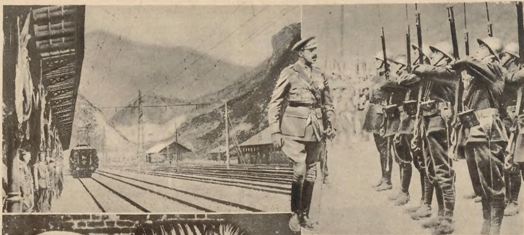
W ubiegłym tygodniu oddano do użytku pierwszy tunel przez Pireneje łączący Francję z Hiszpanią. Na lewo widzimy stację przed tunelem Canfrance. Na prawo król hiszpański Alfons XIII, który wziął udział w uroczystości.