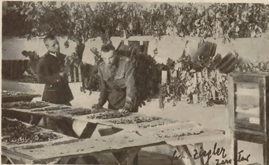
Na lewo: Hodowla jedwabników uprawiana jest z wielkim powodzeniem w 3 p. p. Legjonów w Jarosławiu.