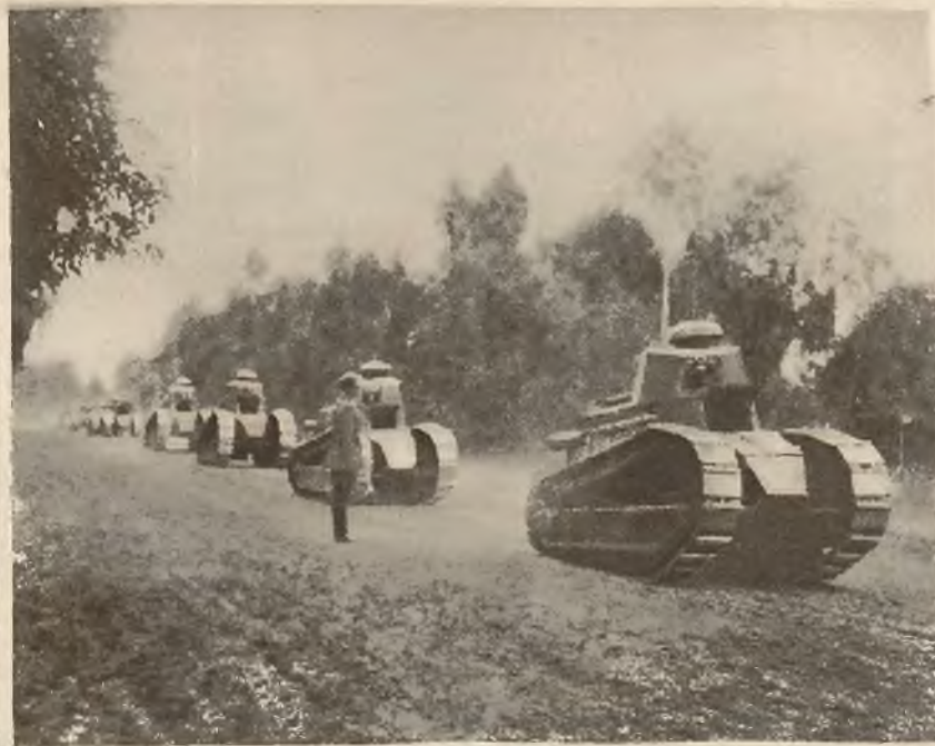
W manewrach garnizonu poznańskiego w Biedrusku wziął udział p. prezydent Rzeczypospolitej, udając się osobiście na poszczególne odcinki walk. Na lewo trybuna dla p. prezydenta na ruchomym aucie podczas defilady. Na prawo defilada czołgów.