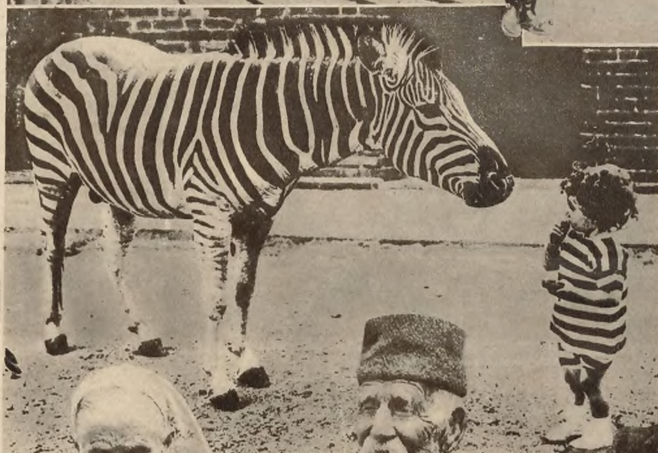
Na lewo: Studium białoczarne. Obrazek z zwierzyńca londyńskiego: wzajemne zdziwienie.