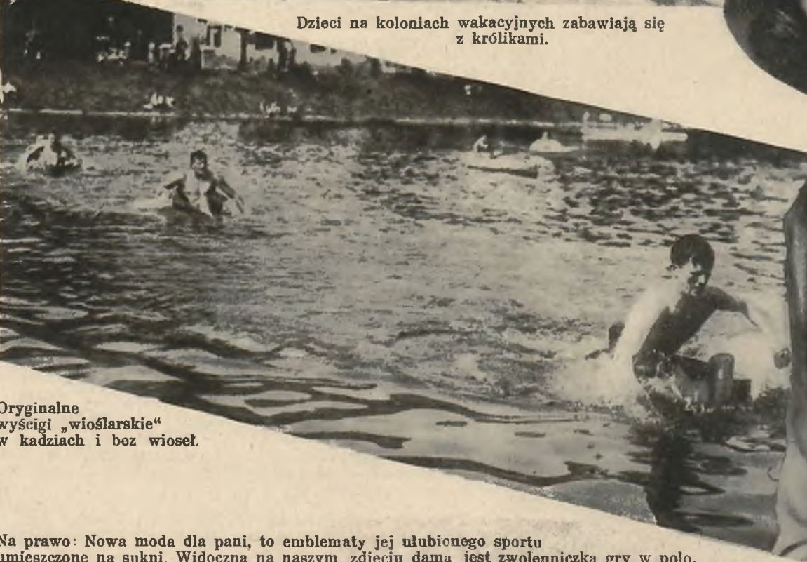
Oryginalne wyścigi „wioślarskie“ w kadziach i bez wiosel.