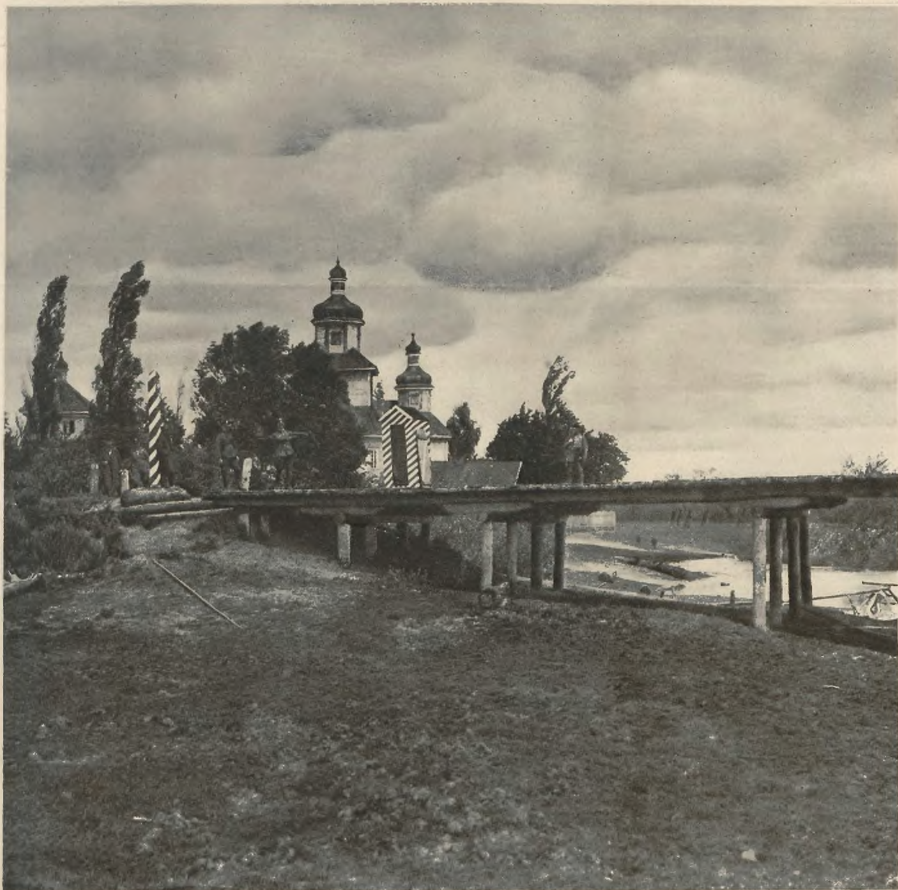
Cerkiew w Leninie (miasteczko w powiecie łuninieckim, woj. poleskie). Rzeczka widoczna na zdjęciu, to Stucz północna, stanowiąca na przestrzeni 184 klm. granicę polsko-sowiecką.