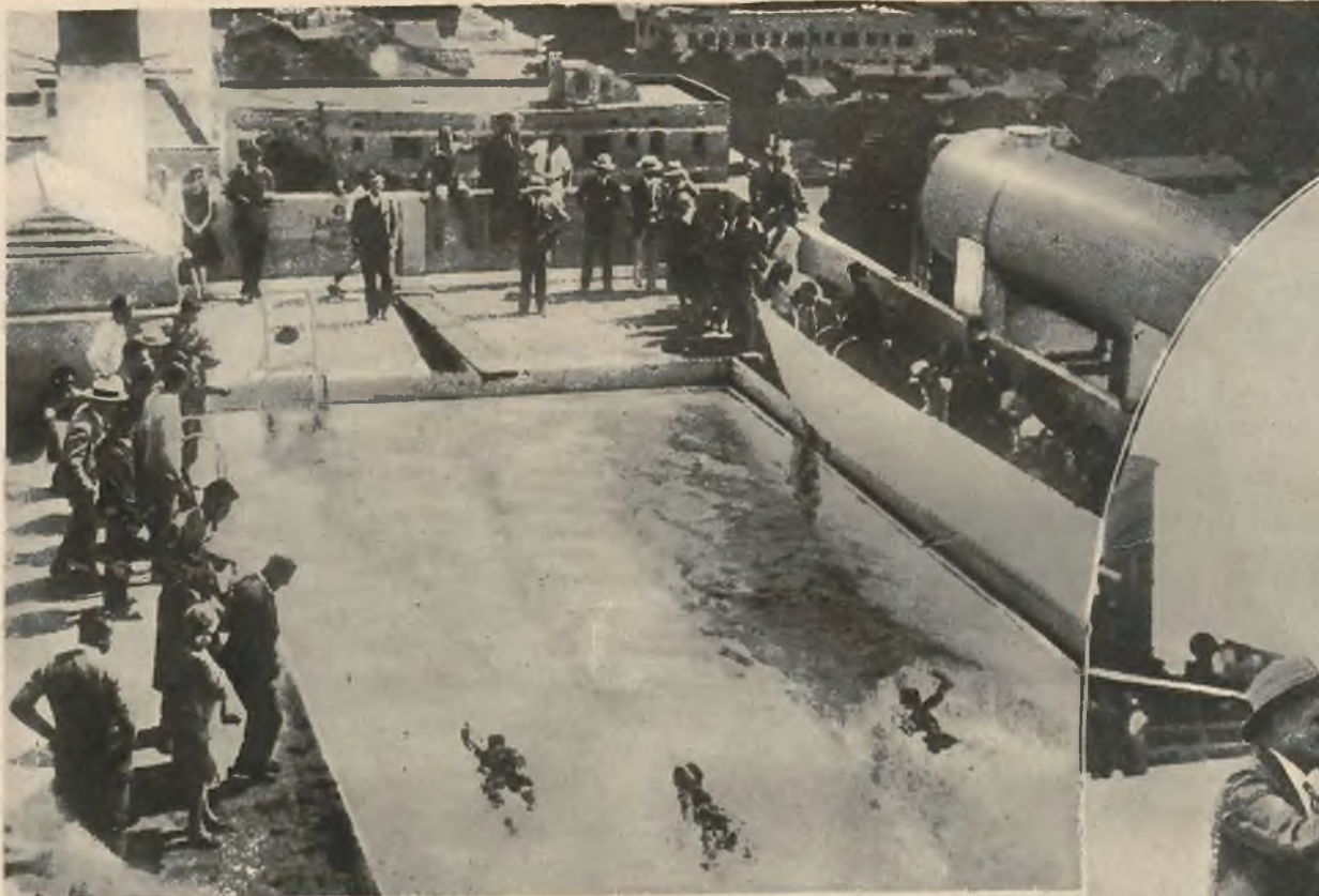
Na lewo: Jeden z hoteli w Los Angeles (Kalifornia) zbudował na swym dachu pływalnię, w której odbywają się zawody.