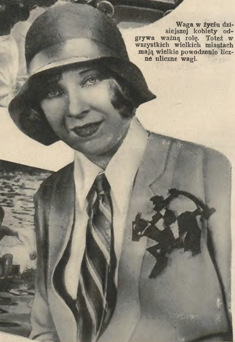
Na prawo: Nowa moda dla pani, to emblematy jej ulubionego sportu umieszczone na sukni. Widoczna na naszym zdjęciu dama jest zwolenniczką gry w polo.