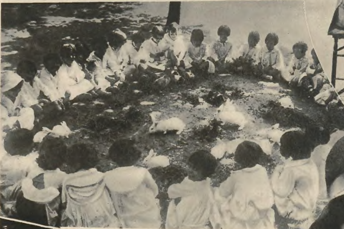
Dzieci na koloniach wakacyjnych zabawiają się z królikami.