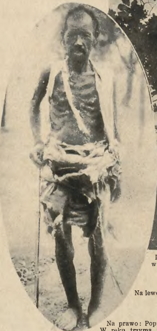
Na lewo: Typowy żebrak chiński, jakich obecnie dziesiątki tysięcy włóczy się po zniszczonym wojną domową kraju.