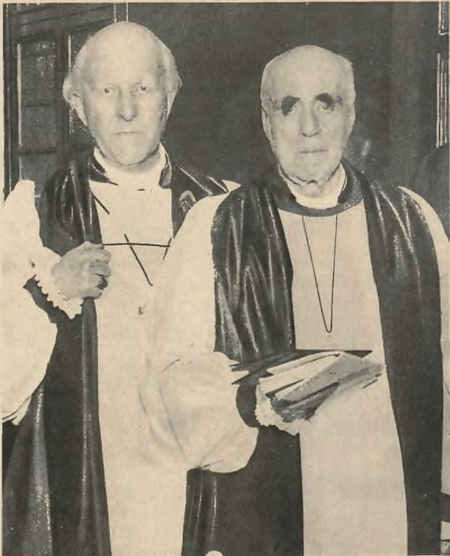
Prymas kościoła anglikańskiego dr. Randall Davidson (na prawo) ustąpił po 25 latach. Jest to pierwszy wypadek w dziejach, że prymas ustępuje. Dłużej od niego był prymasem tylko William Warham w latach 1503—1532. Następcą Randalla jest dr. Lang, arcybiskup Yorku (na lewo).