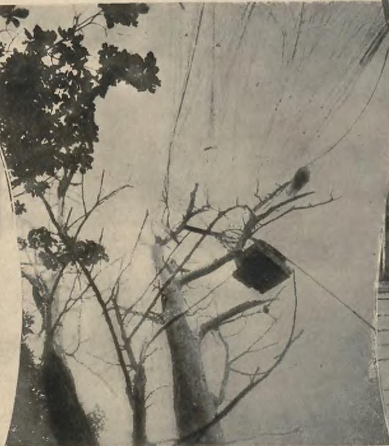
Interesujące zdjęcie z zawodów balonowych Gordon Bennetta w Stanach Zjednoczonych. Gondola balonu zaplątana między gałęzie drzewa, u góry porożrywana powłoka.