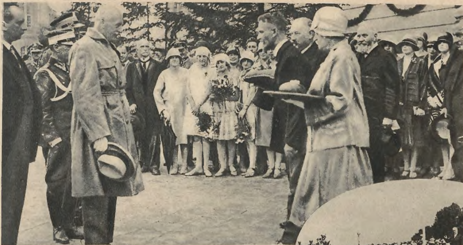
Powitanie p. prezydenta Mościckiego w Bydgoszczy. U dołu p. prezydent podczas defilady.