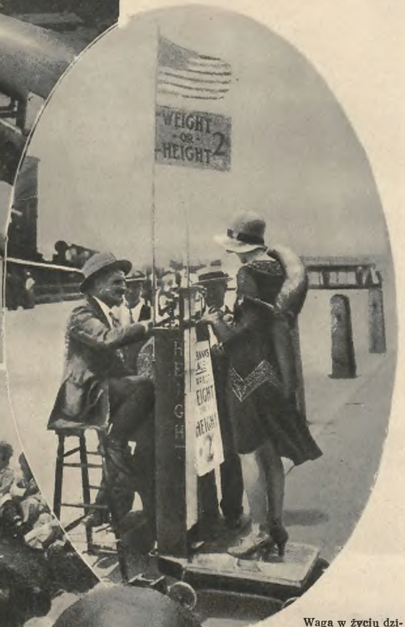
Waga w życiu dzisiejszej kobiety odgrywa ważną rolę. Toteż w wszystkich wielkich miastach mają wielkie powodzenie liczne uliczne wagi.