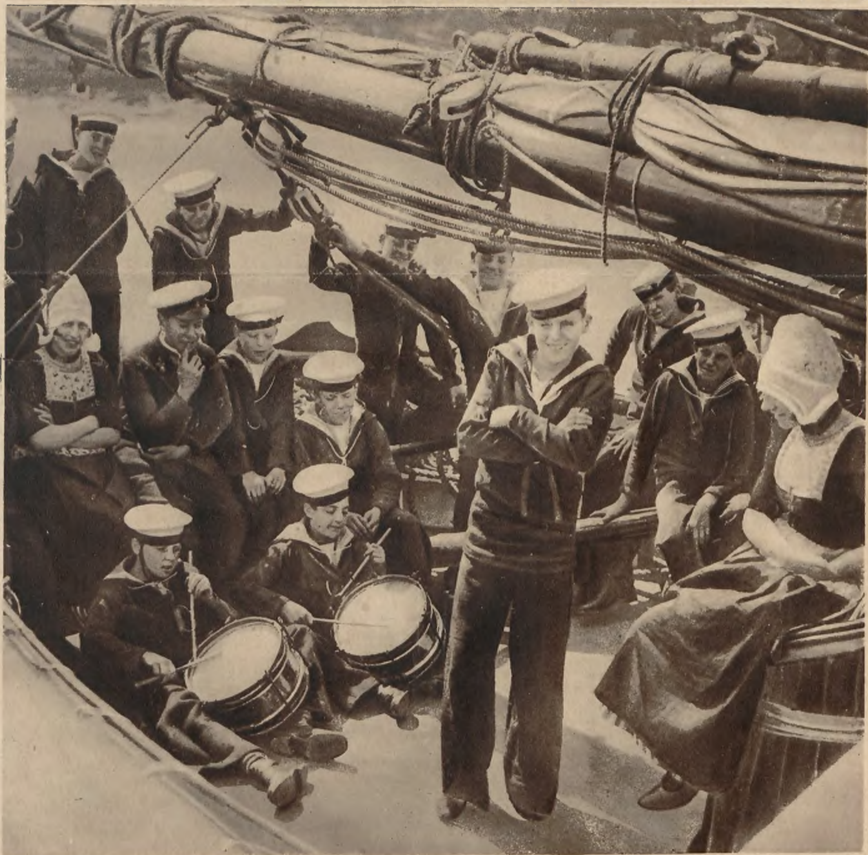
Angielski okręt szkolny z wizytą w Amsterdamie. Kadeci marynarki zabawiają się na pokładzie swego okrętu tańcami, podziwiani przez Holenderki.