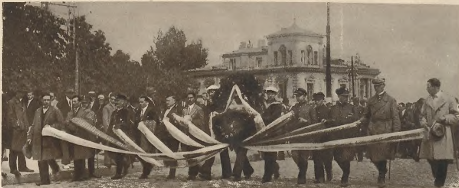
Na lewo: W niedzielę 5 sierpnia, jako w przeddzień wymarszu kadrówki odbyły się w Warszawie wstępne uroczystości. O godzinie 12 w południe nastąpiła zbiórka wszystkich stowarzyszeń byłych wojskowych, poczem udano się na grób Nieznanego Żołnierza. Zdjęcie przedstawia pochód stowarzyszeń wojskowych z wieńcem do grobu Nieznanego Żołnierza.