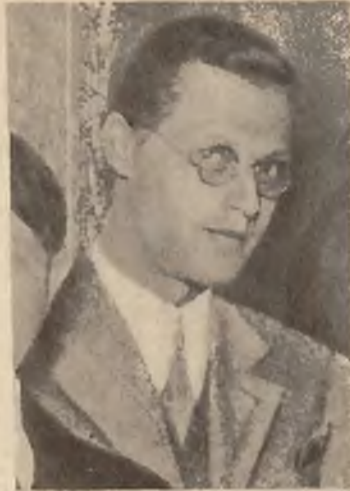
Na lewo: Kazimierz Wierzyński.