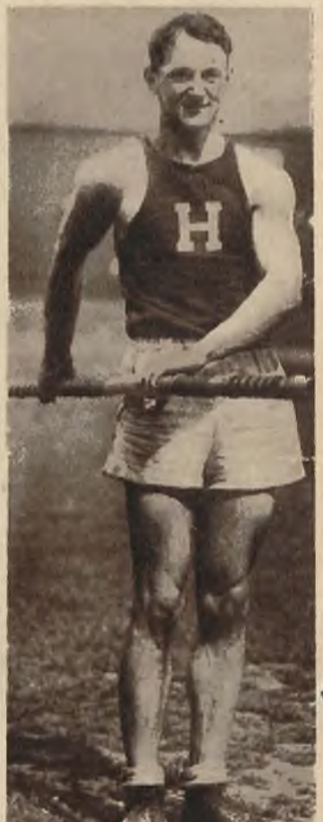
Na prawo: Zwycięzca w skoku o tyczce Amerykanin Sybin Carr.