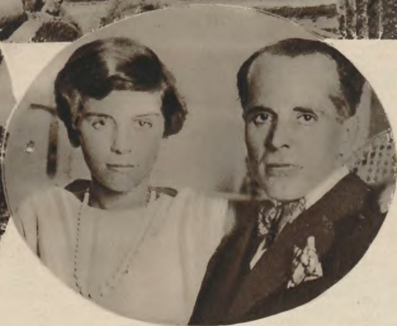
Generał Nobile z córeczką po powrocie do Neapolu.