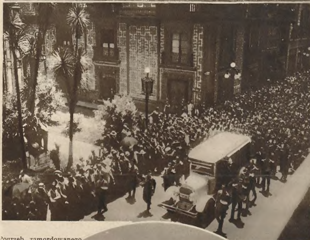
Pogrzeb zamordowanego prezydenta Meksyku Obregona.