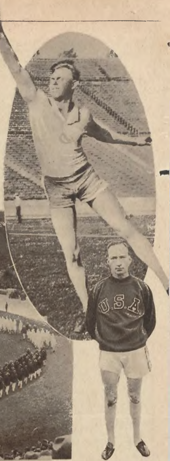
Na prawo: John Kuck (St. Zjedn.) mistrz w rzucie kulą.