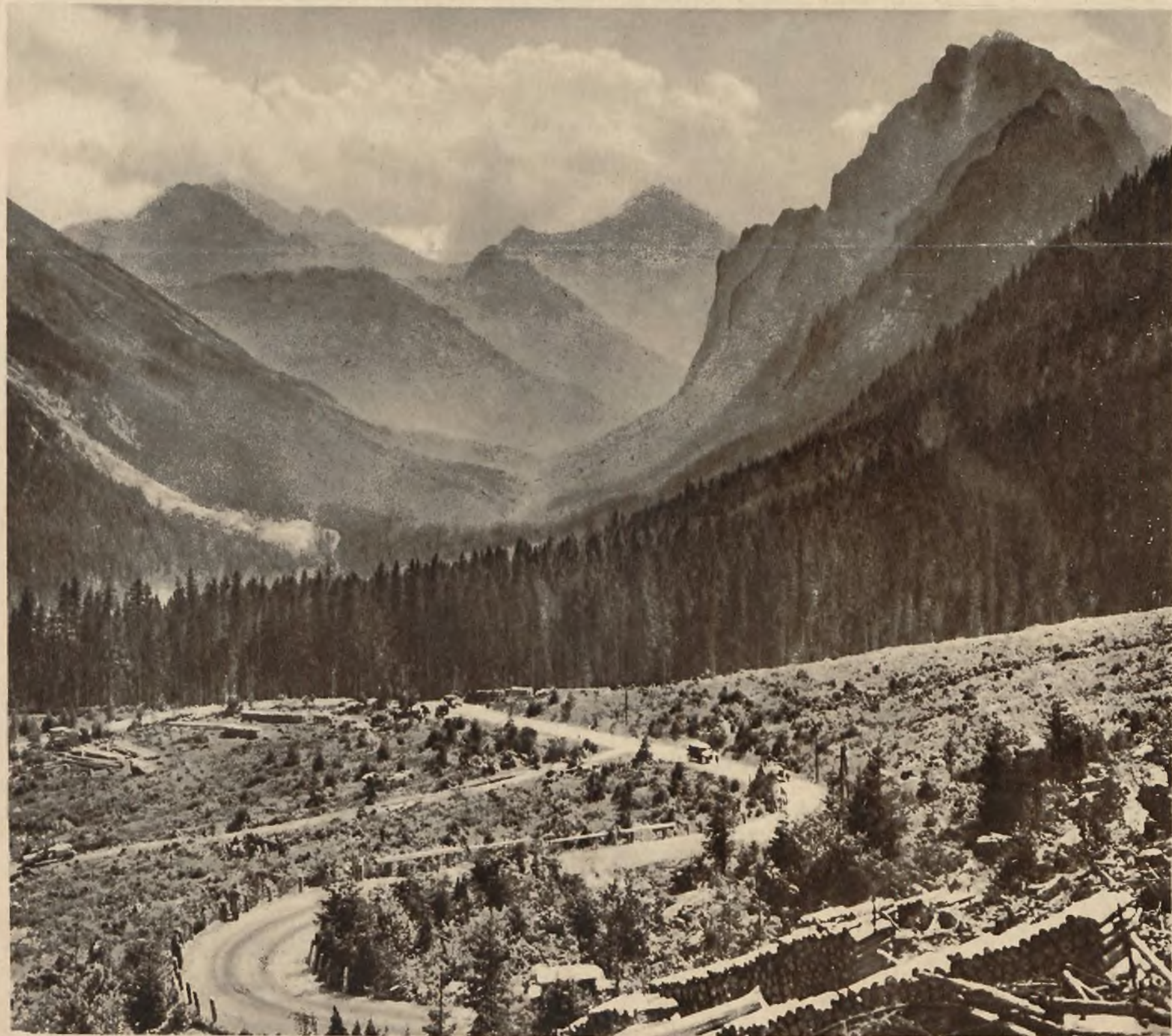
Widok części trasy międzynarodowego wyścigu tatrzańskiego organizowanego przez Krakowski Klub Automobilowy. Na zdjęciu widzimy t. zw. dolne serpentyny między Roztoką a Morskim Okiem. W głębi Dolina Białej Wody i najwyższy szczyt Tatr Gierlach.