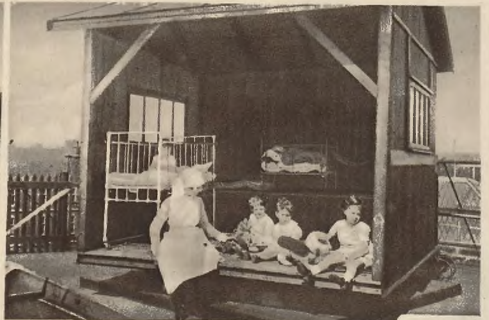
W ochronkach angielskich oddano do użytku dzieci domki, które można obracać i nastawiać na światło promieni słońca.