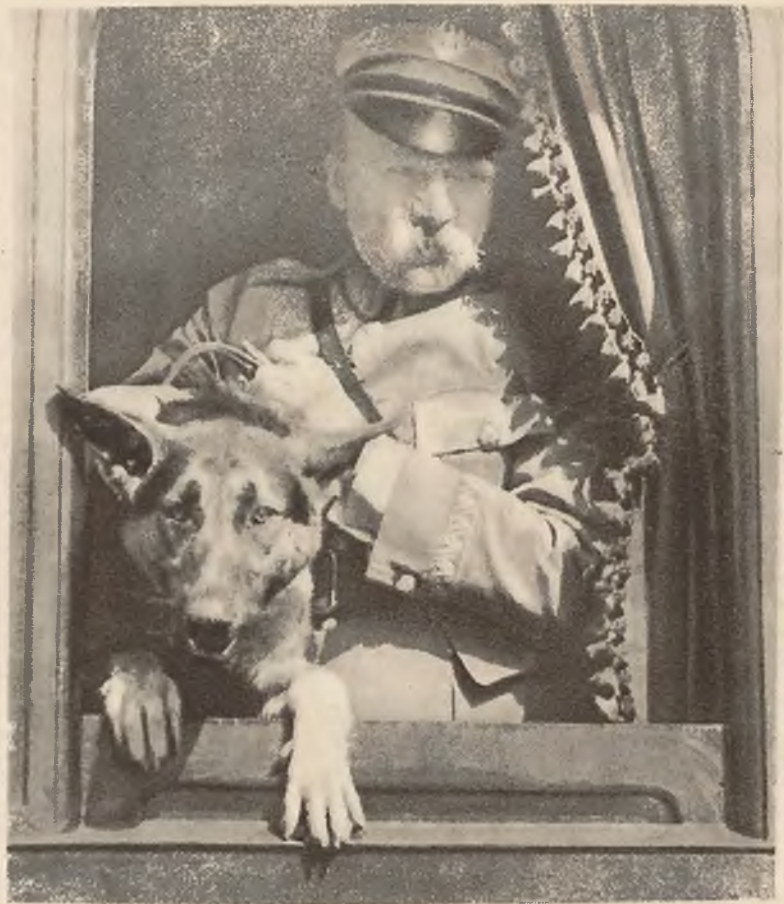
Marszałek Piłsudski w drodze do Rumunii.