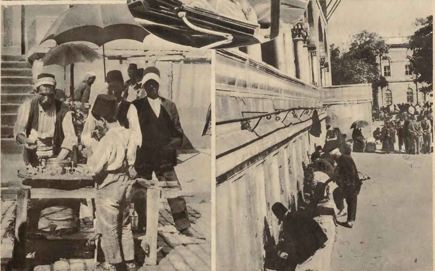
Obrazy z starego Konstantynopola. Na lewo: Uliczny handlarz łodów. Na prawo: Turcy myjący się przed modlitwą we fontanach, urządzonych w murach meczetu.