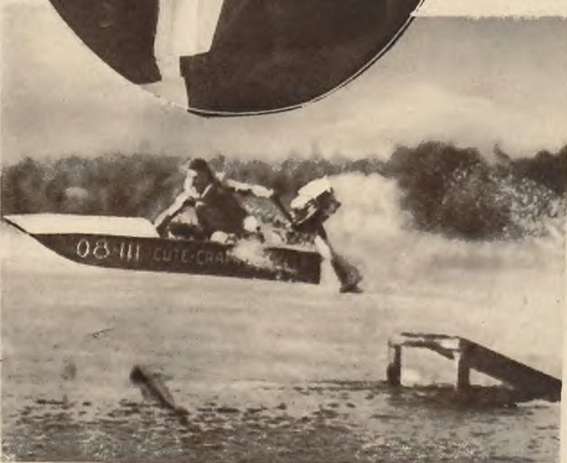
Jeden ze sportowców amerykańskich skacze na specjalnie skonstruowanej łódce motorowej przez trampolinę.

Na lewo: Stulecie Lwa Tołstoja, wielkiego filozofa i powieściopisarza rosyjskiego przypada w nie-długim czasie.