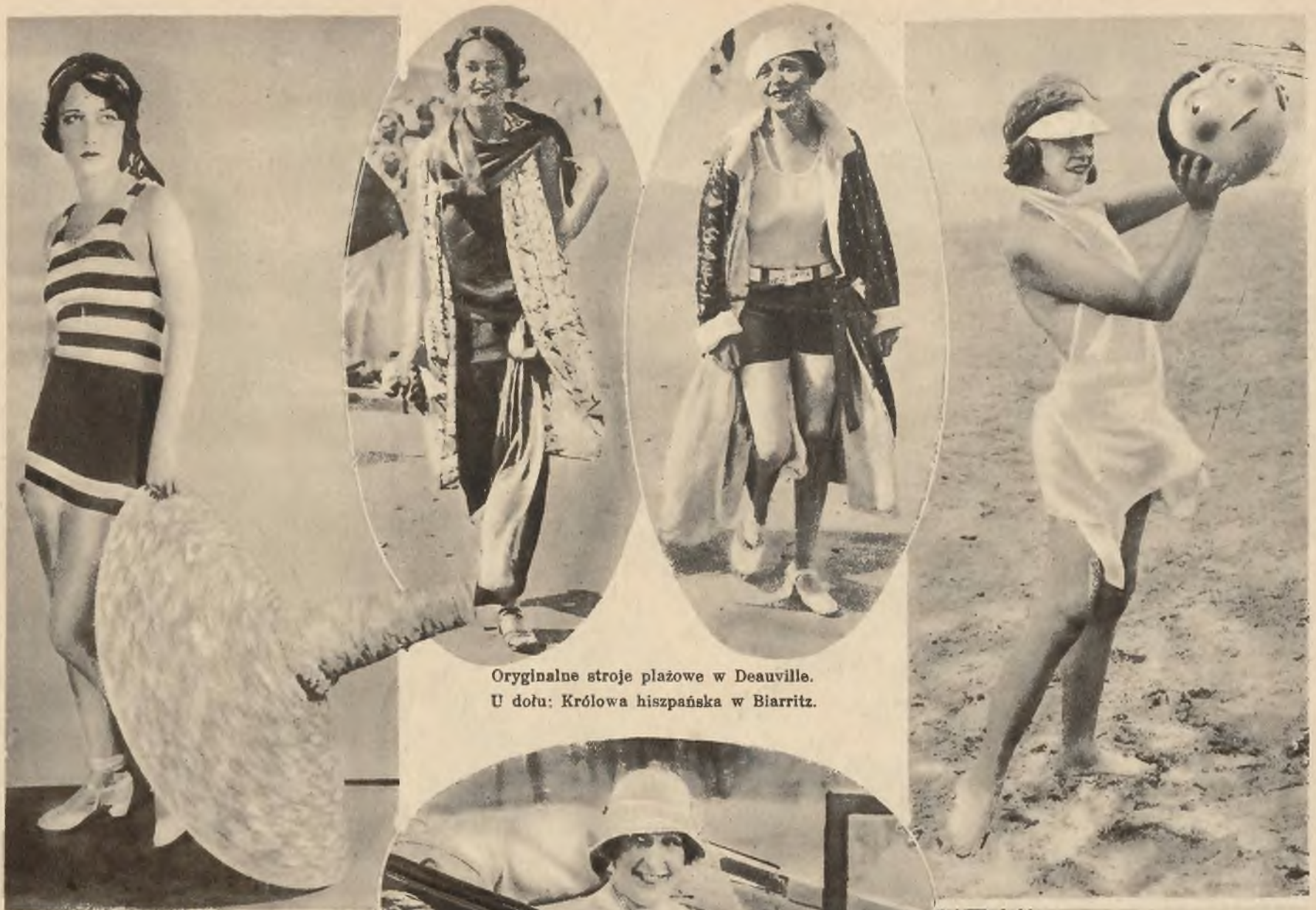
Oryginalne stroje plażowe w Deauville. U dołu: Królowa hiszpańska w Biarritz.