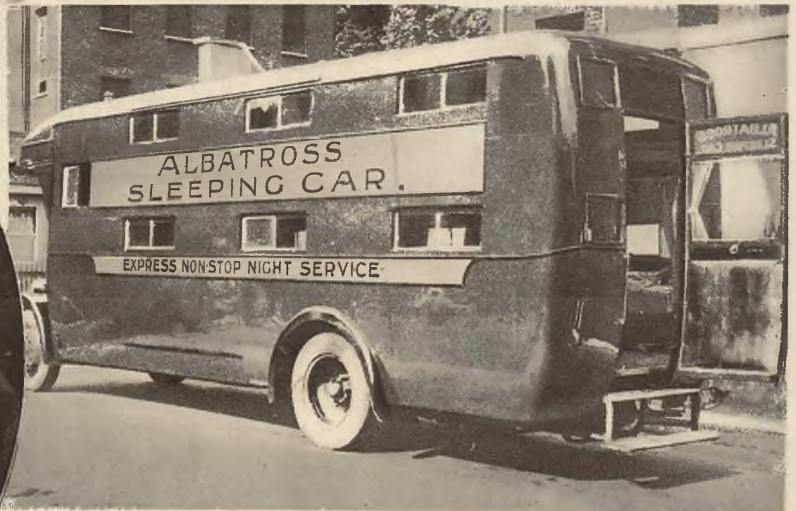
Między Londynem a Liverpoolem wprowadzono obecnie komunikację autobusem sypialnym. Publiczność przyjęła to udogodnienie w podróży z zadowoleniem.

Na lewo: Stulecie Lwa Tołstoja, wielkiego filozofa i powieściopisarza rosyjskiego przypada w nie-długim czasie.