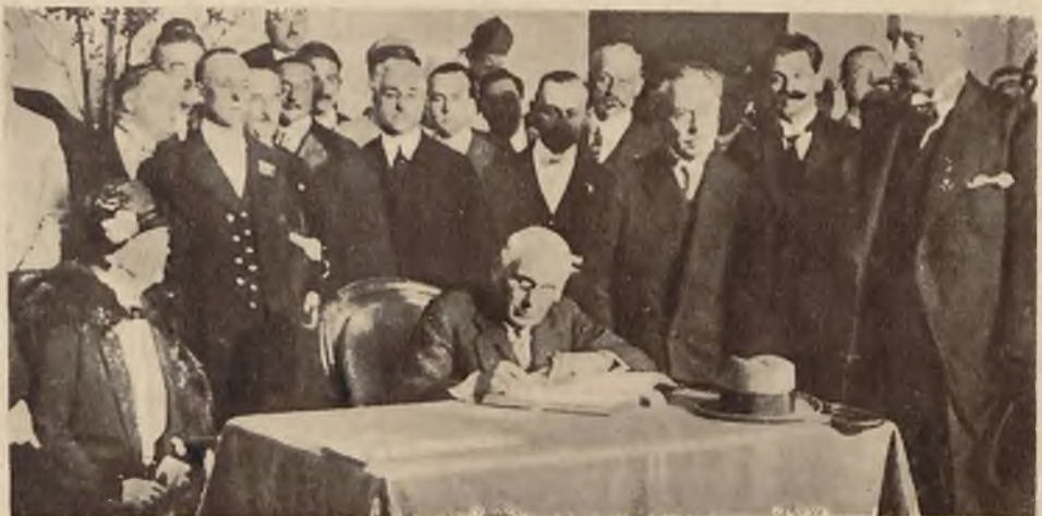
Przyjazd Kelloga do Francji. Kellog zapisuje się do księgi pamiątkowej miasta Havre.