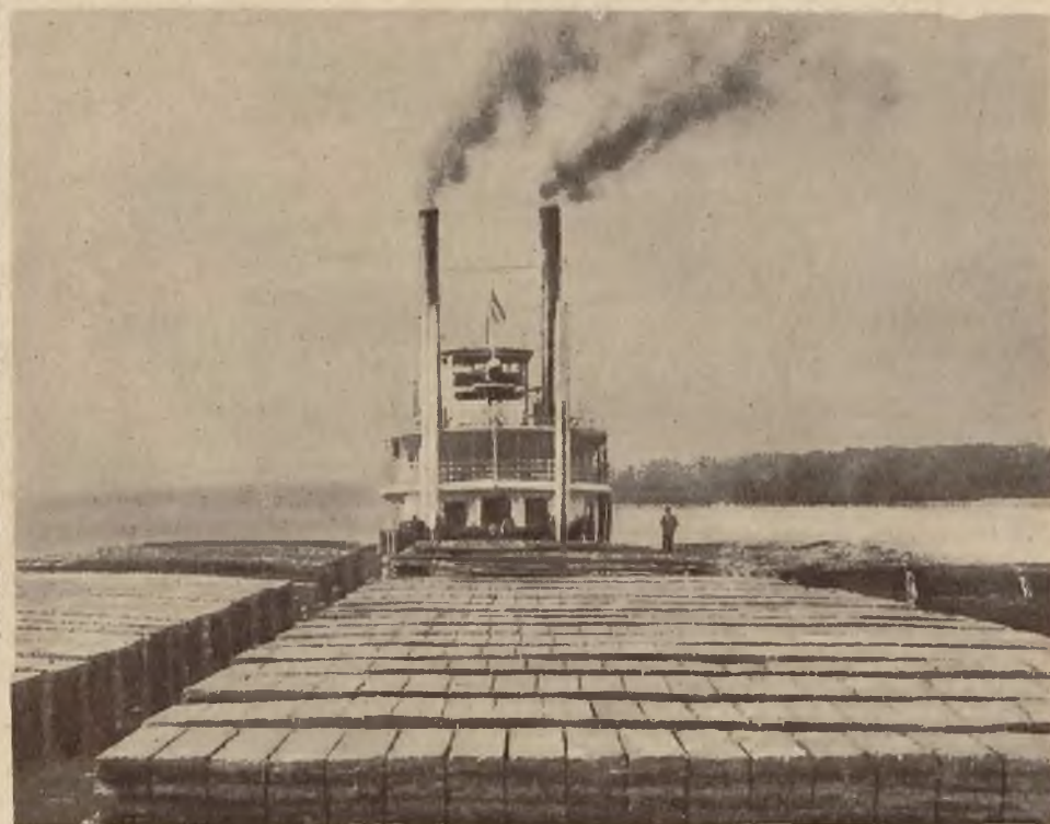
Na prawo: Odbudowanie ogromnej tamy na Missisipi, zniszczonej przez straszliwe powodzie zeszłoroczne, przeprowadza obecnie rząd amerykański kosztem miljarda dolarów.