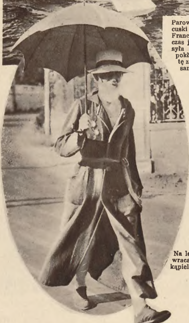
Na lewo: Bernard Shaw wraca z porannej morskiej kąpiei w Cap d'Antibes.