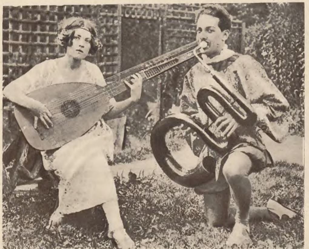
Zdjęcie z festiwalu kameralnej muzyki średniowiecznej w Haslemere, gdzie uczestnicy występowali w stylowych strojach.