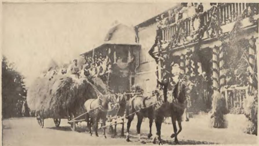
Senzację na Dożynkach wzbudzał wóz z sianem z ziemi Sandomierskiej.