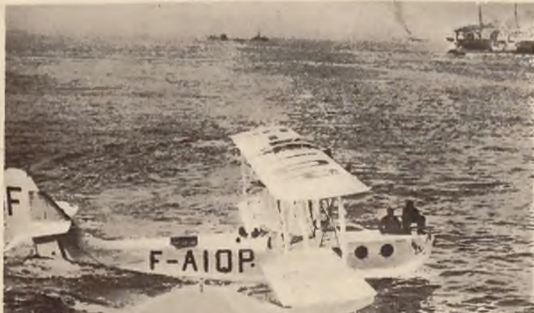
Parowiec francuski „Ile de France”, podczas jazdy wysyła z swego pokładu pocztę za pomocą samolotów.