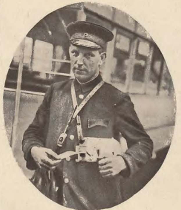
Konduktorowie berlińskich autobusów na oczekaniu drukują potrzebne bilety przy pomocy specjalnych aparatów.