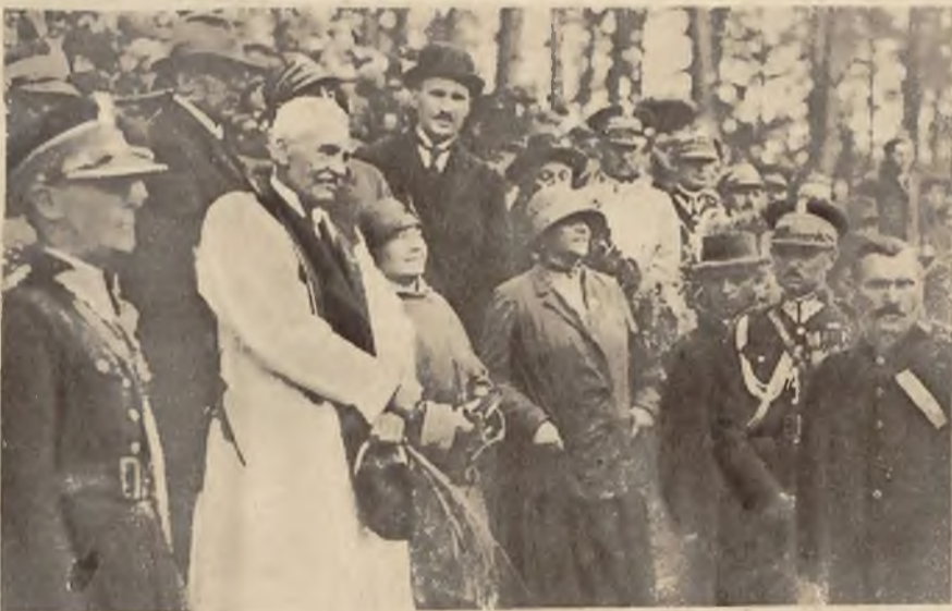
Pan prezydent Rzeczypospolitej przyjmuje delegację mając na sobie sukmanę ofiarowaną mu przez delegację ziemi Krakowskiej.