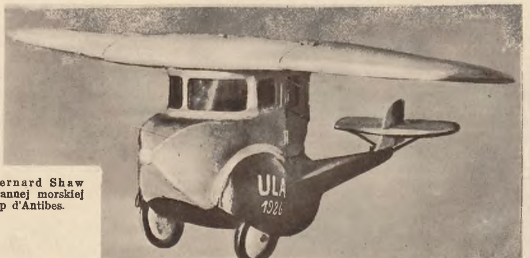
Amyrkanka Elsie Tubbe skonstruowała auto na trzech kołach które posiada także skrzydła i nadaje się do używania jako aeroplan lub hydroplan.