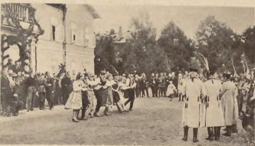
Delegacja ziemi Krakowskiej odtńczyła przed p. prezydentem „Krakowiaka”.