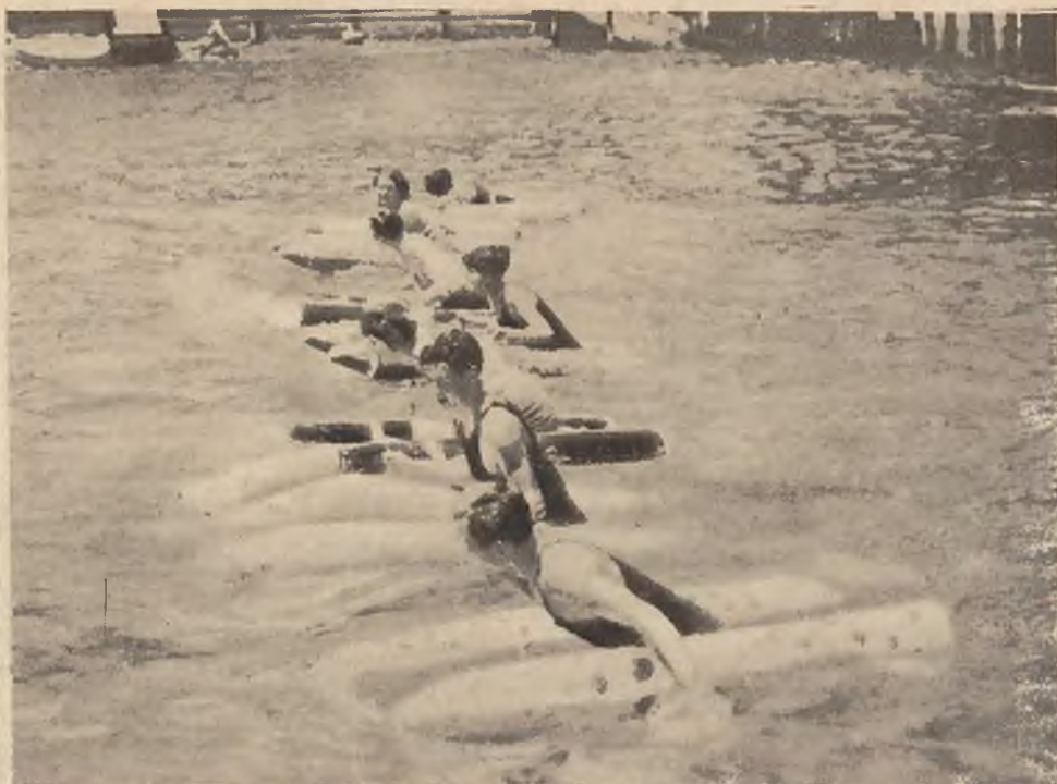
Sezon kąpielowy w słonecznej Kalifornji jest w całej pełni. Oto wyścigi nowo skonstruowanych aparatów, poruszanych zapomocą pedałów.