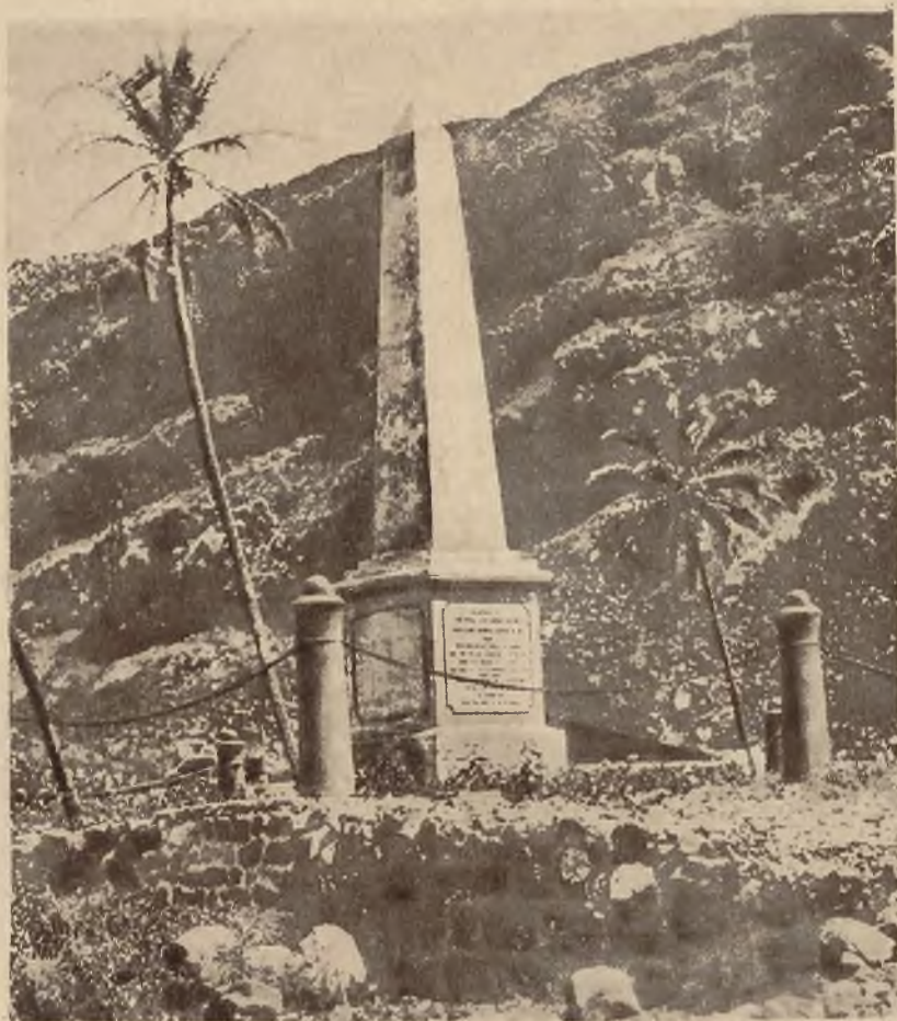
Nowopostawiony na Hawaj pomnik odkrywcy wysp Sandwich kapitana Cobka, zamordowanego przez krajowców przed 150 laty.