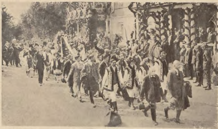
Hunculi na Dożynkach u p. prezydenta.