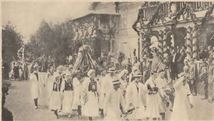
Liczna grupa Górnioślązaków zwracała powszechną uwagę.