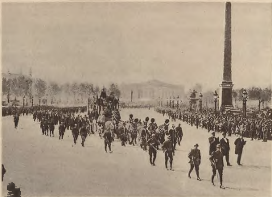
Pogrzeb tragicznie zmarłego francuskiego ministra Bokanowskiego odbył się w Paryżu z niezwykle nroczyością. Zdjęcie przedstawia kondukt pogrzebowy na Place de la Concorde.