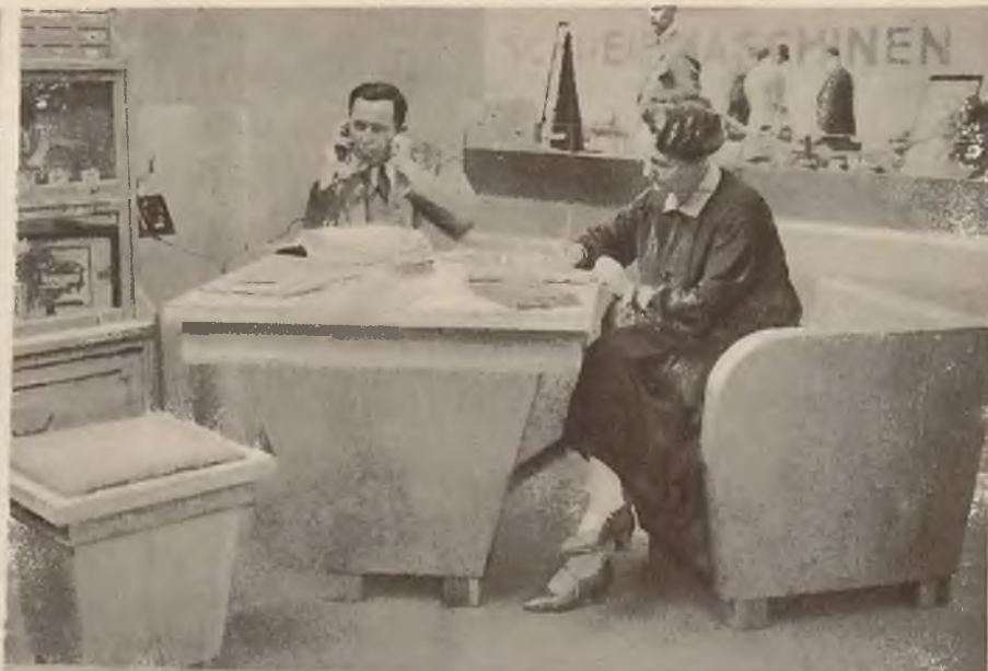
Na wystawie mebli biurowych w Berlinie pomiędzy wielu eksponatami demonstrującymi mechanizację czynności biurowych można było oglądać także estetyczne modele nowoczesnych mebli.