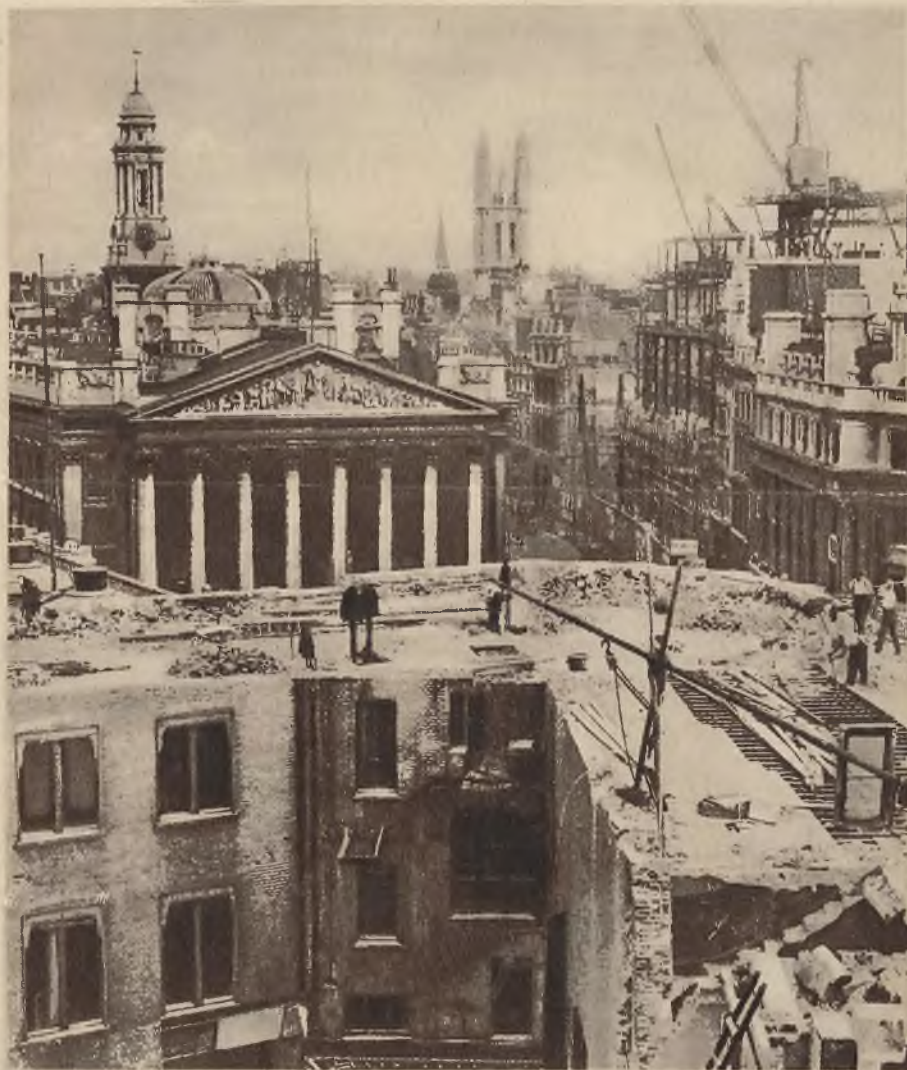
U góry na prawo: Celem rozbudowy Banku Angielskiego zburzono w londyńskim City cały szereg budynków.