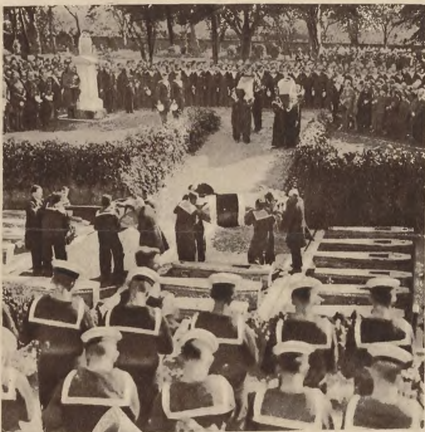
Pogrzeb marynarzy zatopionej przez sowietów w roku 1919 angielskiej łodzi podwodnej L. 55.