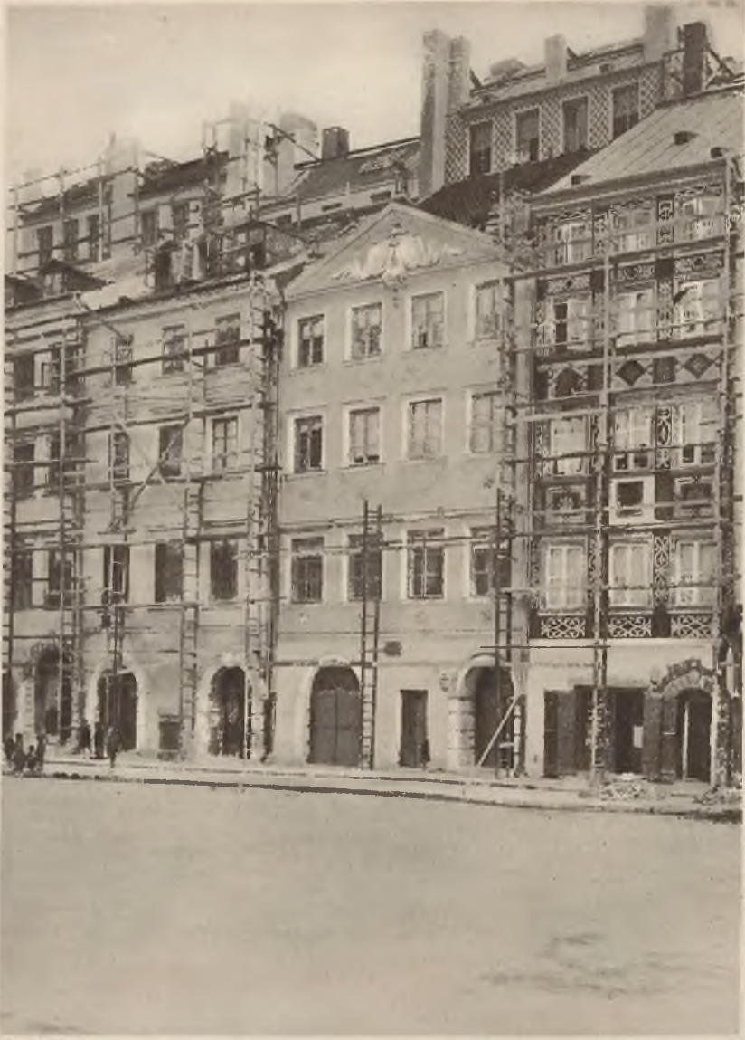
Zabytkowe domy na Starym Mieście w Warszawie są obecnie odnawiane z udziałem wybitnych artystów malarzy polskich.