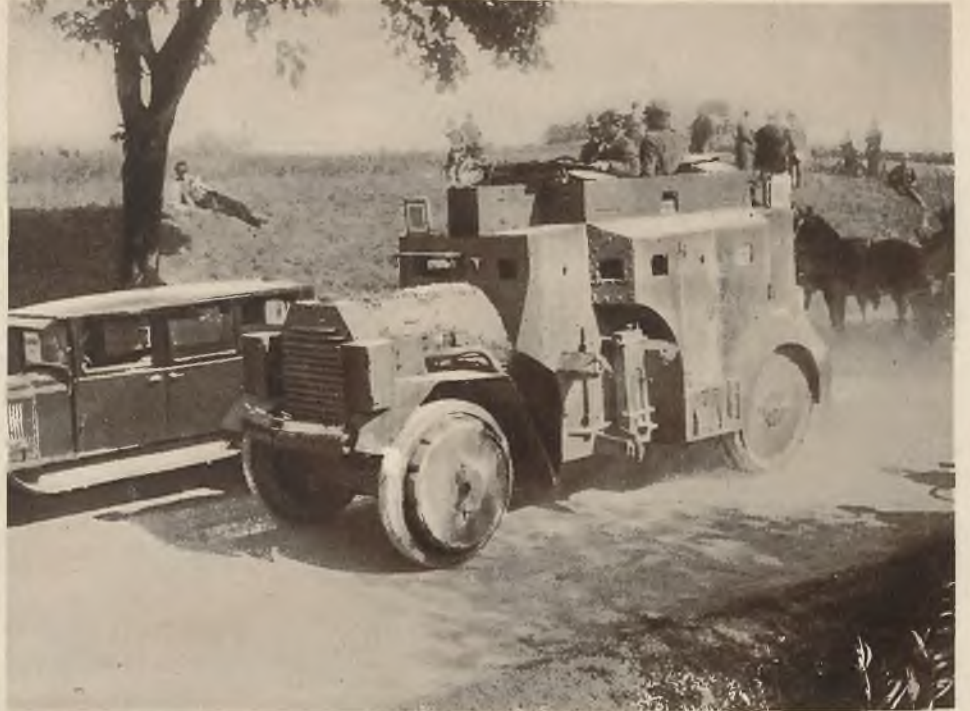
Fragment z manewrów wojskowych „rozbrojonych Niemiec“.