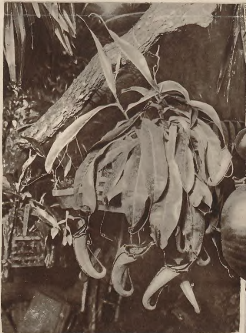
Wspaniały okaz dzbaecznika, rośliny mięsożernej na wystawie ogrodniczej w Paryżu.