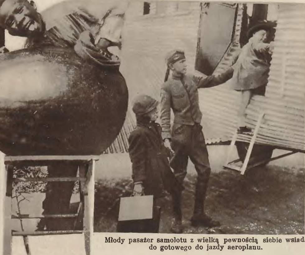
Młody pasażer samolotu z wielką pewnością siebie wsiada do gotowego do jazdy aeroplanu.