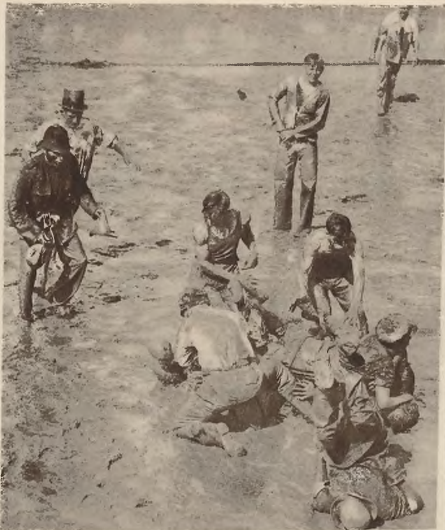
Deszczowa pogoda w Anglii, nie wstrzymała entuzjastów piłki nożnej, którzy na błocie rozegrali szereg humorystycznych meczów.