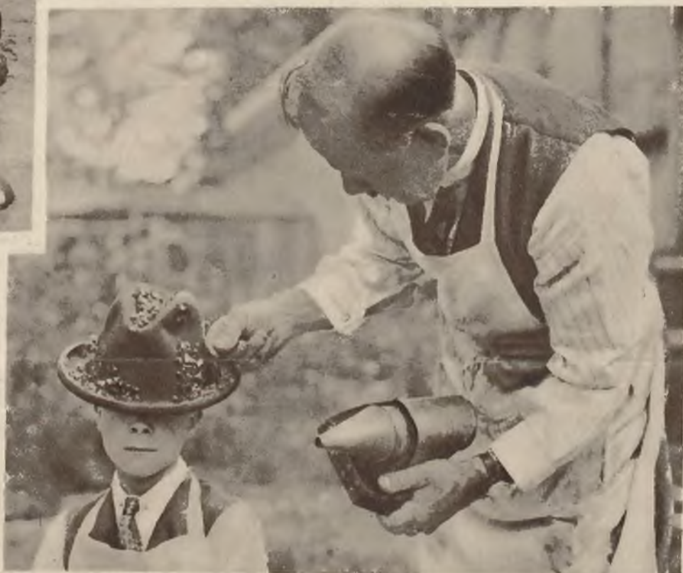
Na wystawie pszczelniczej w „Crystal Palace” w Londynie demonstrowano rój pszczół który osiadł na męskim kapeluszu.