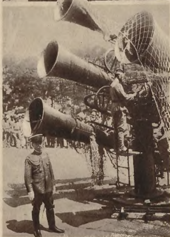
Na lewo: Na manewrach japońskich użyto aparatów podsłuchowych które na długo przed ukazaniem się aeroplanów ostrzegają o ich obecności w powietrzu.