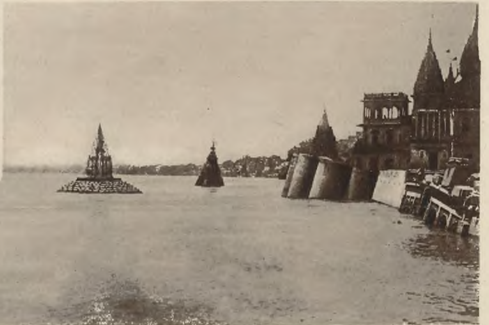
Wskutek ulewnych deszczów wystąpiła z brzegów święta rzeka Ganges, niszcząc nadbrzeżne okolice. Pastwą fal padło także wiele żyć ludzkich.