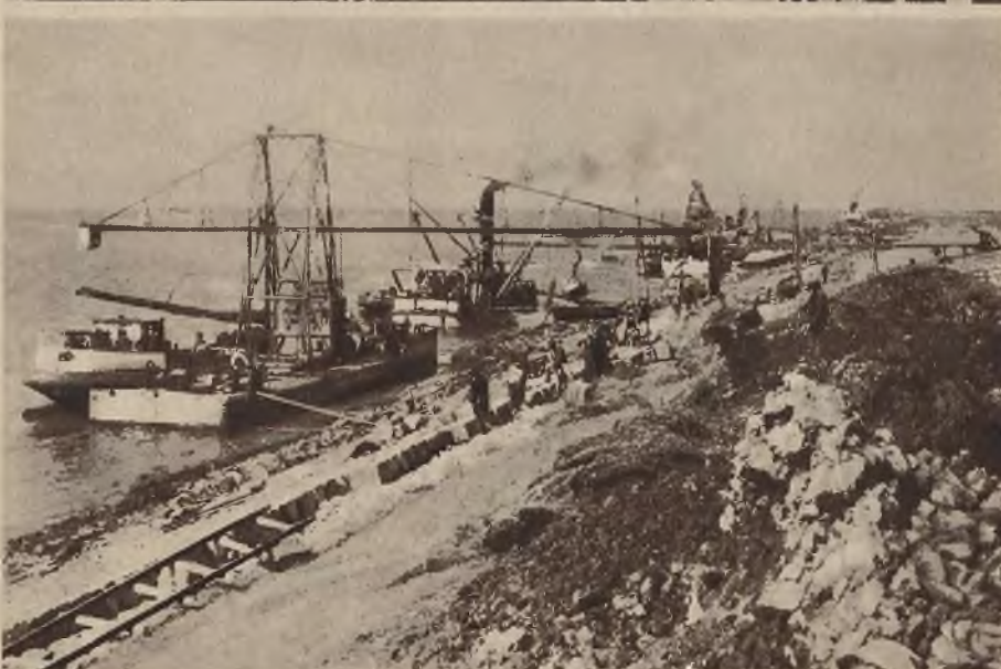
Na prawo: W Holandji przeprowadza się obecnie budowę wielkiej tamy mającej oddzielić Zuider-See od morza Północnego.