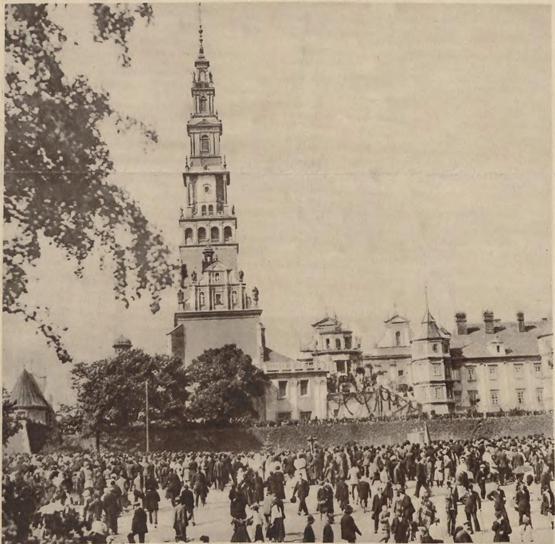
Ruch przed klasztorem na Jasnej Górze w Częstochowie w czasie kongresu eucharystycznego.