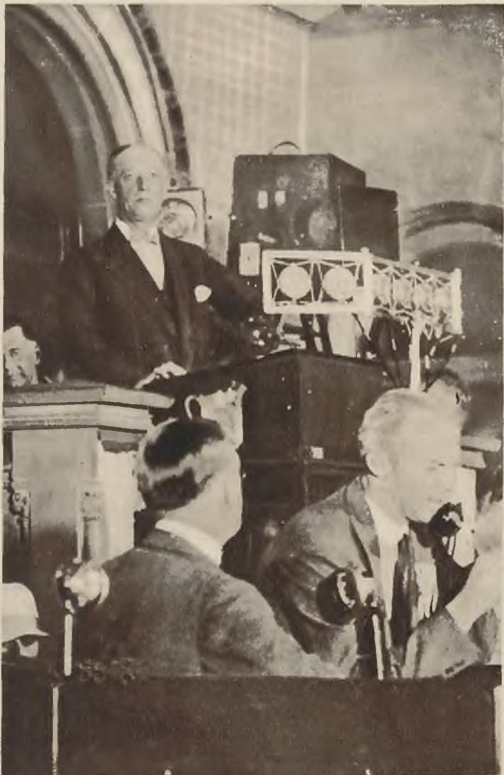
Kandydat na prezydenta Stanów Zjednoczonych A. E. Smith zaczął oficjalnie ubiegać się o to stanowisko.