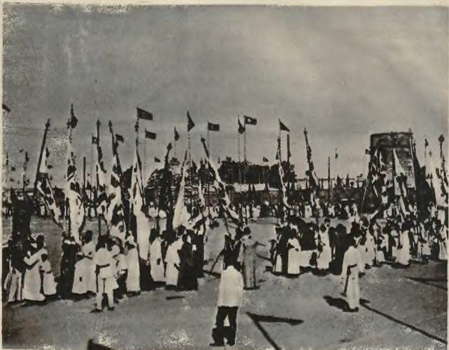
Uroczystość święta narodzin proroka Mahometa w Kairo.