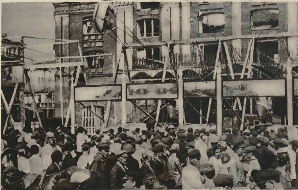
Ruch uliczny w Niżnym Nowogrodzie (Rosja) w czasie słynnych dorocznych targów.