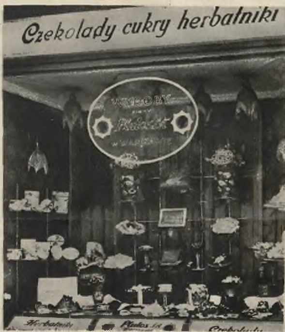
„Plutos“, ul. Legionów 1, — I nagroda.