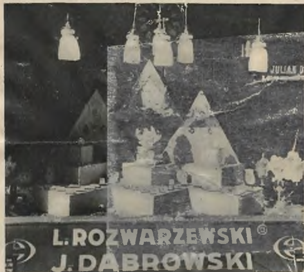
Firma Dąbrowski i Rozwarzewski, ul. Akademicka 2, — II nagroda.

Okna wystawowe firm nagrodzonych na konkursie najpiękniejszych wystaw sklepowych, urządzonym świeżo we Lwowie przez Komitet Obywatelski,