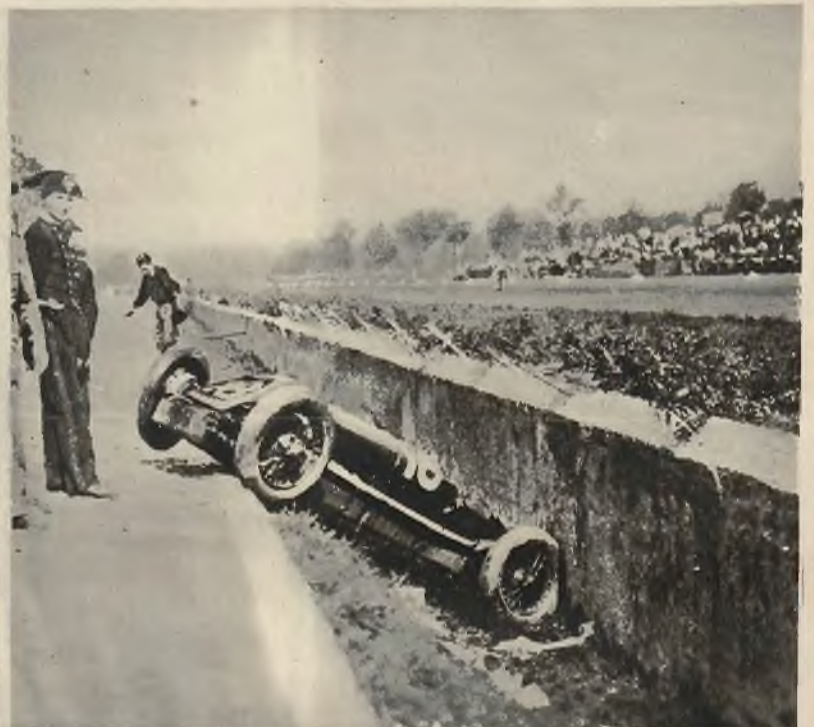
Zdjęcie z strasznej katastrofy samochodowej w Monzy.