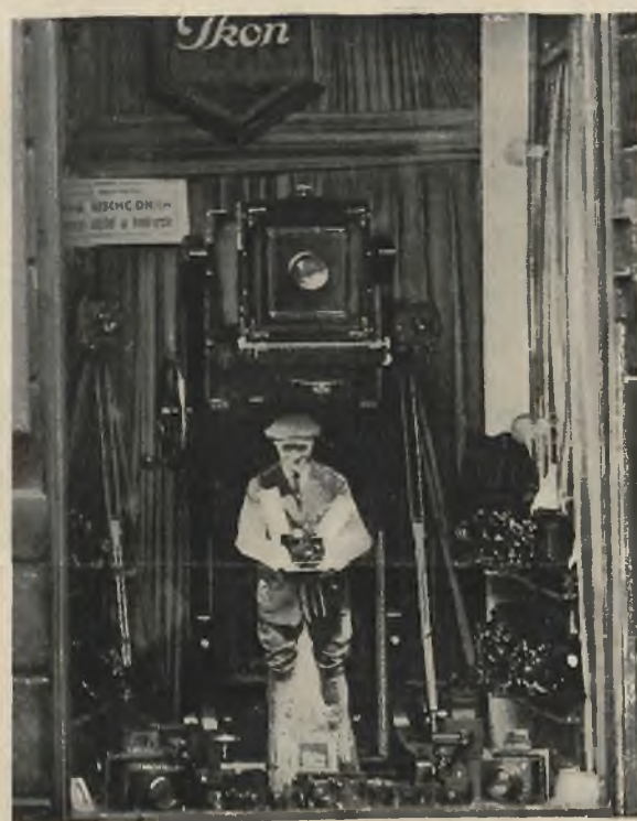
Barwik i Borzemski, ul. Kopernika 18, — II nagroda.