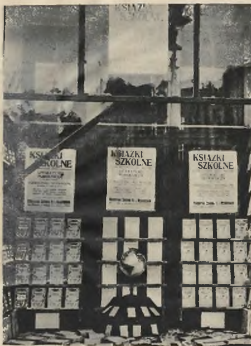
Księgarnia Zakładu Nar. im. Ossolińskich przy placu Halickim 12 a, — I nagroda.

w którym reprezentowane były najpoważniejsze czynniki lwowskiego świata przemysłowego i handlowego.