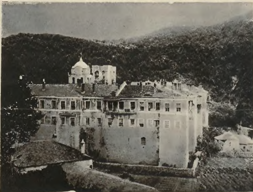
Słynny klasztor na górze Athos, wśród którego mieszkańców wybuchła teraz rewolucja „pałacowa“.