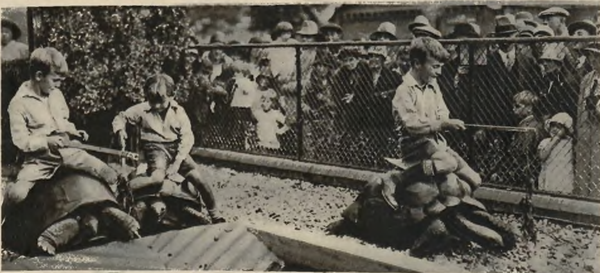
Wyścigi dzieci na olbrzymich żółwiach w londyńskim ogrodzie zoologicznym.