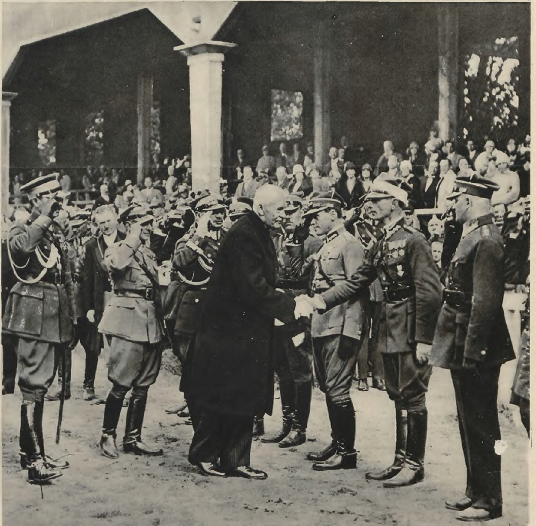
Z międzynarodowych konkursów hipicznych w Warszawie. P. prezydent Mościcki wita się z uczestnikami konkursów.