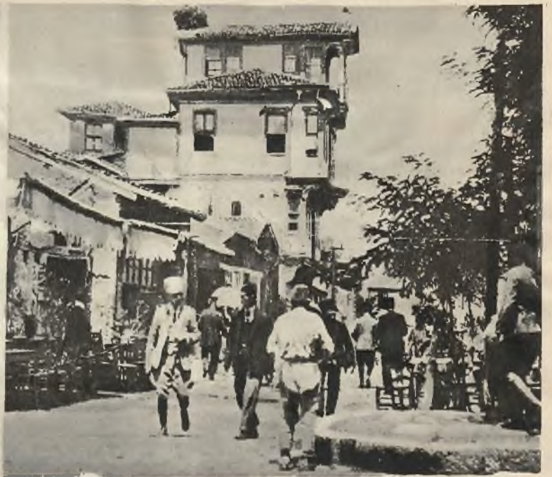
Ruch na głównej ulicy w Angorze.