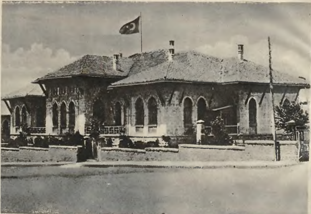
Nowy budynek parlamentu tureckiego w Angorze.