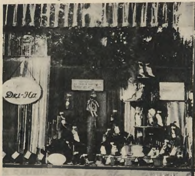
„Delka“, ul. Legionów 13 — I nagroda.

w którym reprezentowane były najpoważniejsze czynniki lwowskiego świata przemysłowego i handlowego.