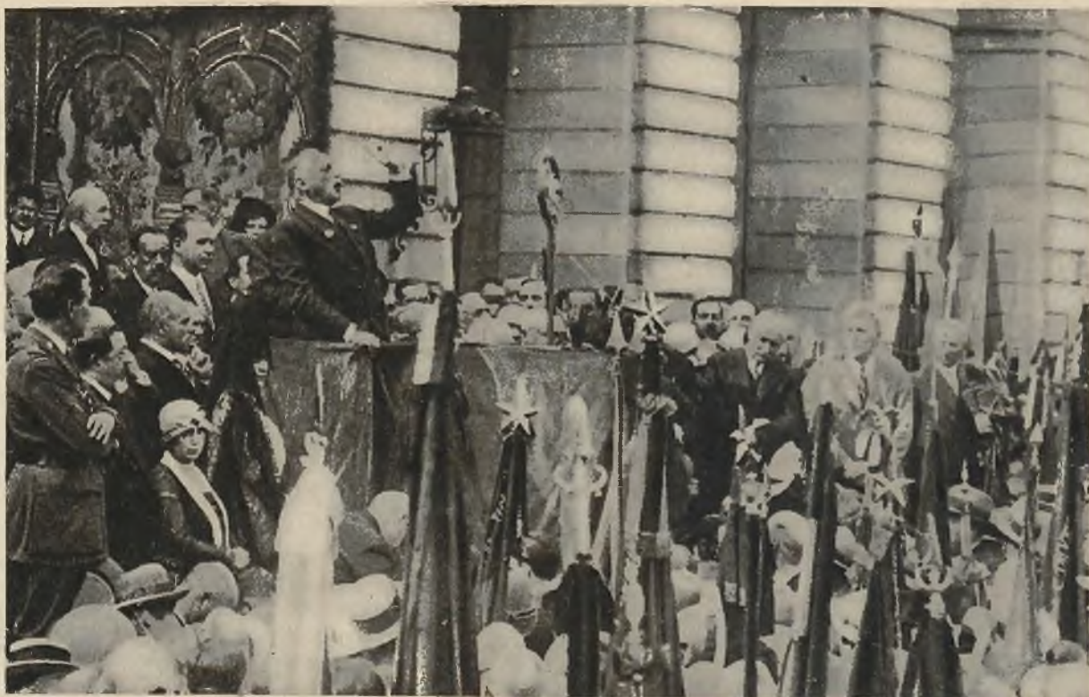
Gen. Primo de Rivera przemawia w Madrycie na uroczystościach 5-lecia objęcia władzy dyktatorskiej.