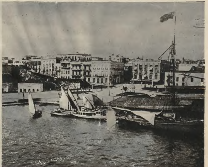
Port San Juan na Porto Rico, który został zupełnie zniszczony przez straszliwe tornado.