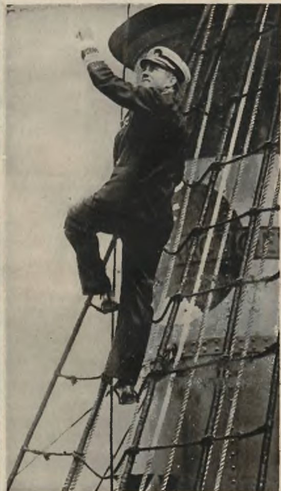
Kom. Byrd na pokładzie swego łamacza lodow „City of New York“ który już ruszył w podróż do bieguna południowego.