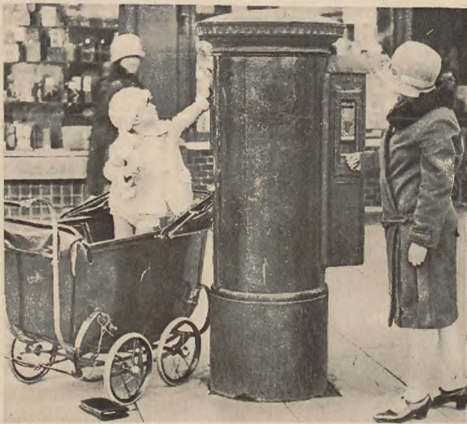
Praktyczne automaty z znaczkami pocztowymi ustawiono na ulicach miast amerykańskich. Korzystają z nich jak widzimy także pasażerowie wózków dzieciennych.