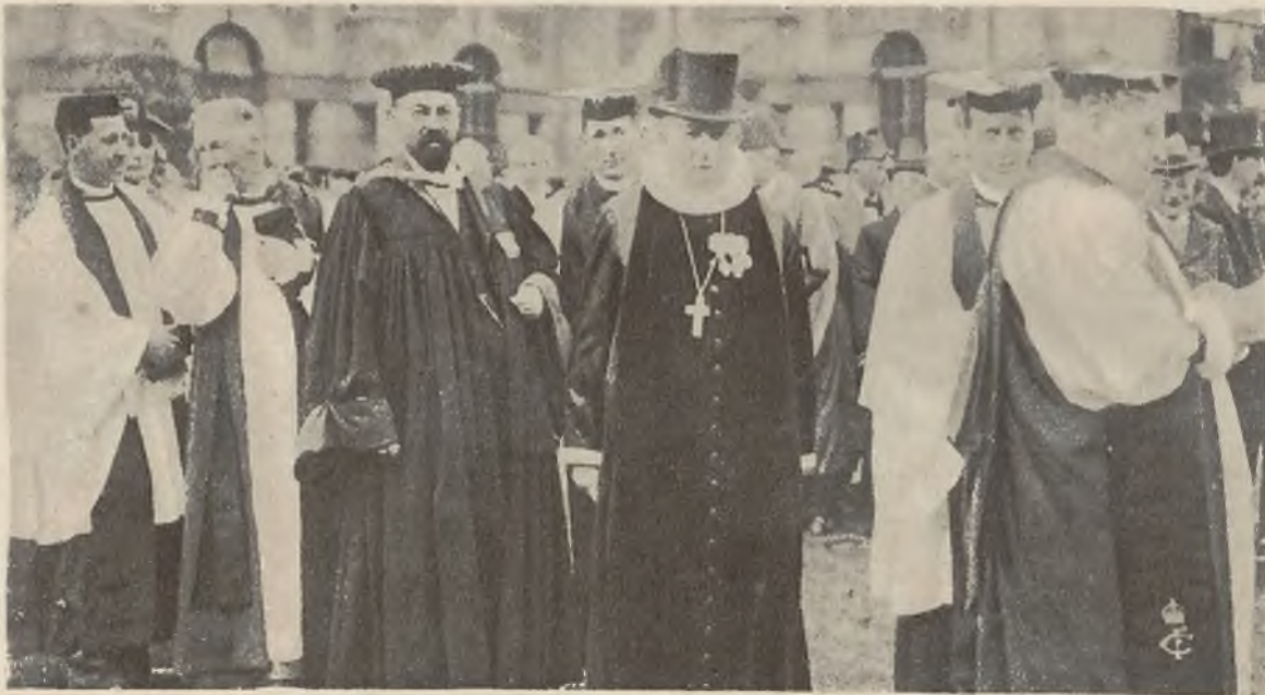
Zdjęcie z 63-go Międzynarodowego Kongresu Kościoła protestanckiego w Cheltenham (Anglja). Grupa biskupów anglikańskich.