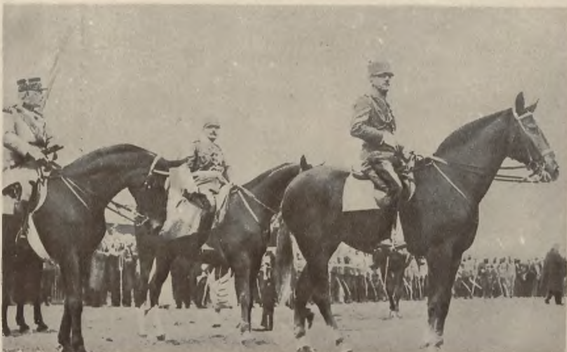
Z okazji dziesięciolecia powstania państwa jugosłowiańskiego odbyła się w Białogrodzie wielka uroczystość wojskowa, w której udział brali król Aleksander (na prawo) i marszałek Francji, gen. Franchet d'Esperey.