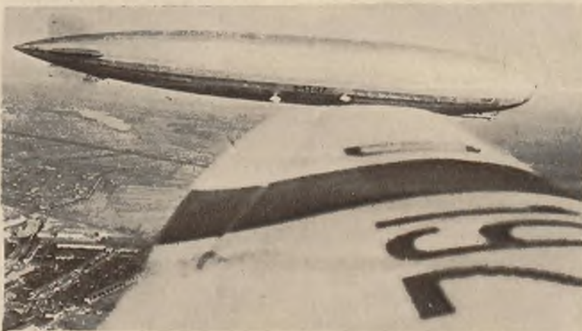
Balon „Hrabia Zeppelin“ podczas swego przelotu do Ameryki.