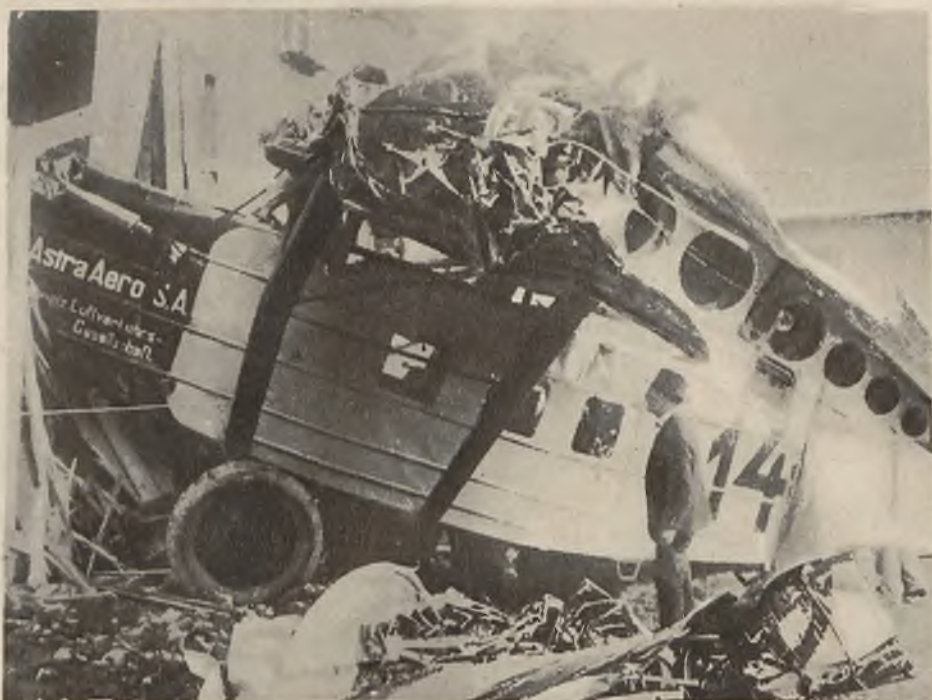
Samolot pasażerski prowadzony przez słynnego lotnika szwajcarskiego Mittelholzera uległ katastrofie, przyczem pasażerowie dziwnym trafem wyszli zupełnie cało.