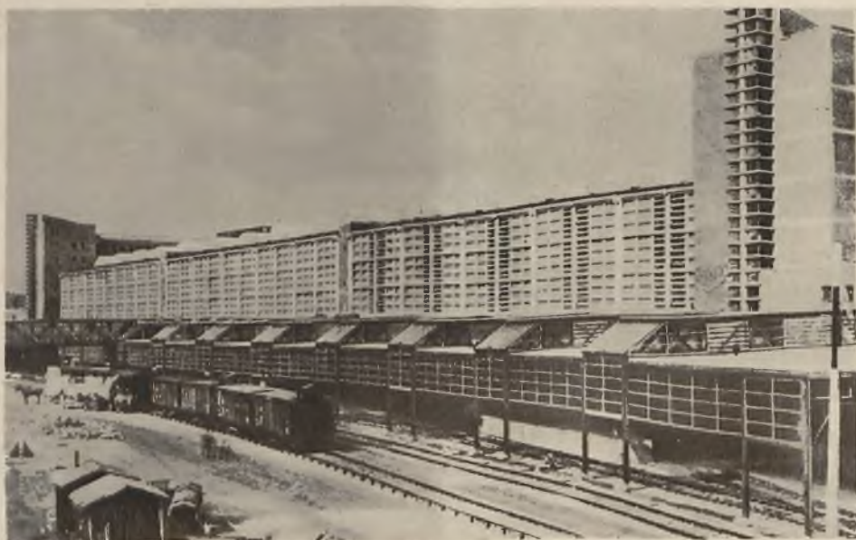
Na lewo: Nowoczesna architektura. Nowe hale targowe w Frankfurcie.