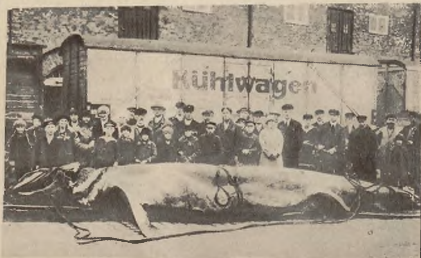
Na prawo: Do portu hamburskiego przywieziono rekina o wadze 70 cetnarów metrycznych, największego jakiego od wielu lat złowiono na wodach europejskich.