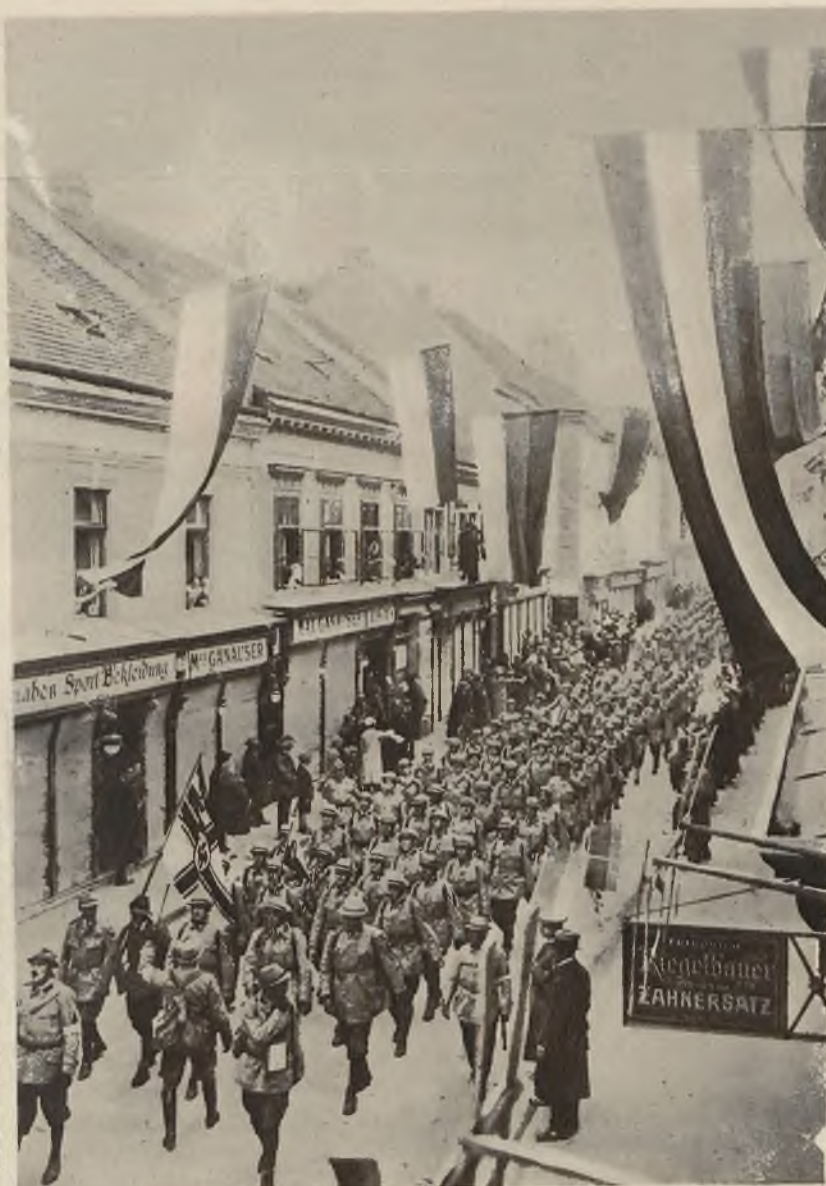
Zdjęcie z olbrzymiej manifestacji austriackiej „Heimwehry“ w Wiener Neustadt.