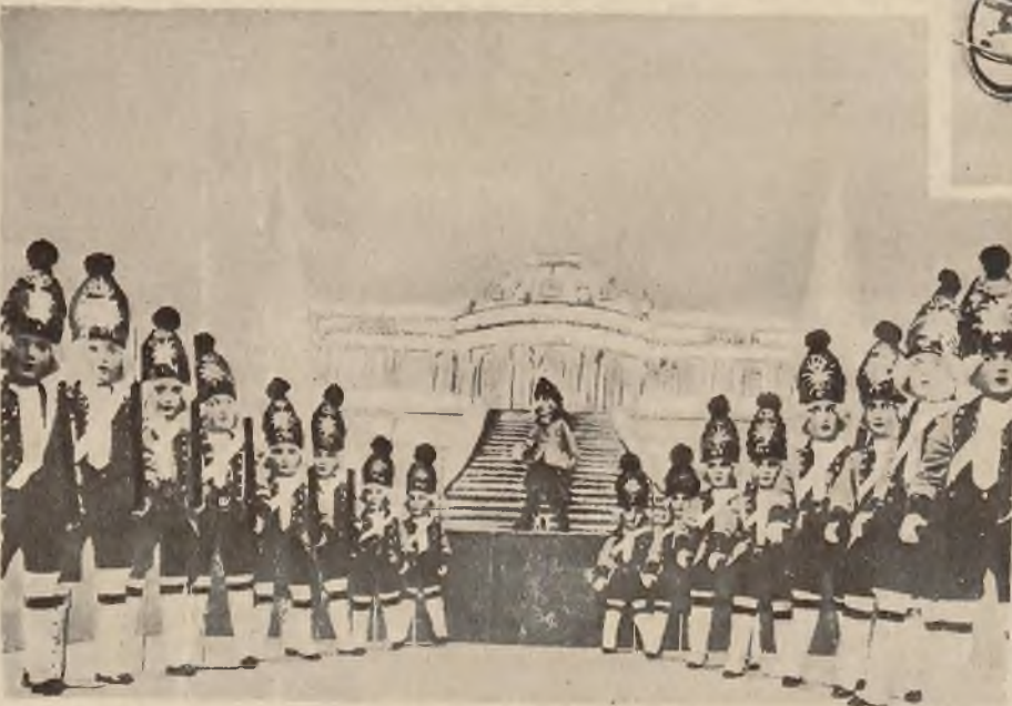
Figury grenadjerów z czasów Fryderyka Wielkiego na wystawie lalek artystycznych w Berlinie.