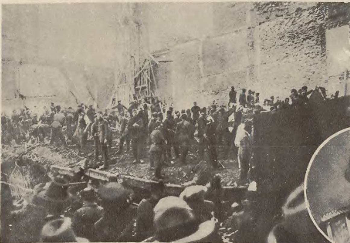
Wydobywanie ofiar straszliwej katastrofy budowlanej w Pradze z pod ruin domu.