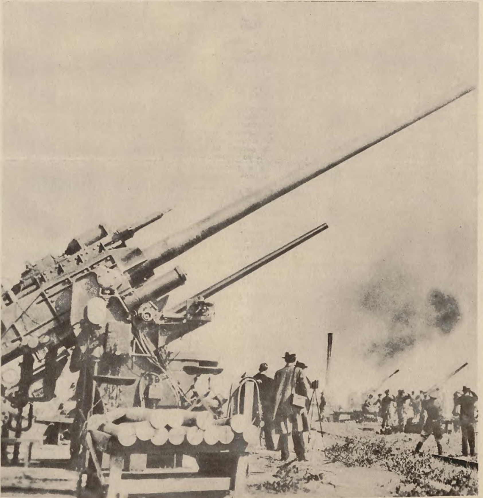
Zdjęcie dokonane na ćwiczeniach amerykańskiej artylerji przeciwlotniczej, która dysponuje największymi i najdoskonalszymi tego rodzaju działami.