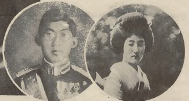
W tych dniach odbyły się zaślubiny następcy tronu japońskiego ks. Chichibu z panną Matsudeira.