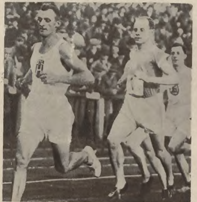
Nurmi (1) bierze udział w zawodach lekkoatletycznych w Charlottenburgu.