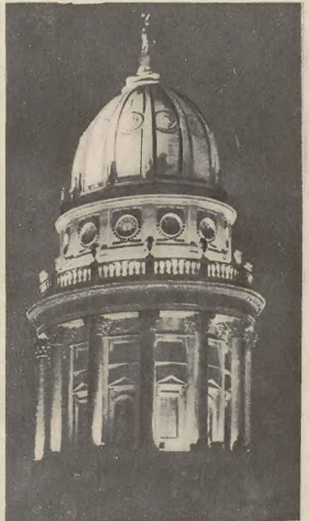
Illuminacja kopuły kościoła protestanckiego w Berlinie w dniu propagandy świetlnej.