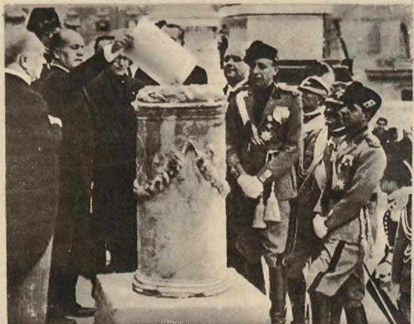
W czasie rocznicy „Marszu na Rzym” Mussolini spalił papiery mające symbolizować długi państwowe.