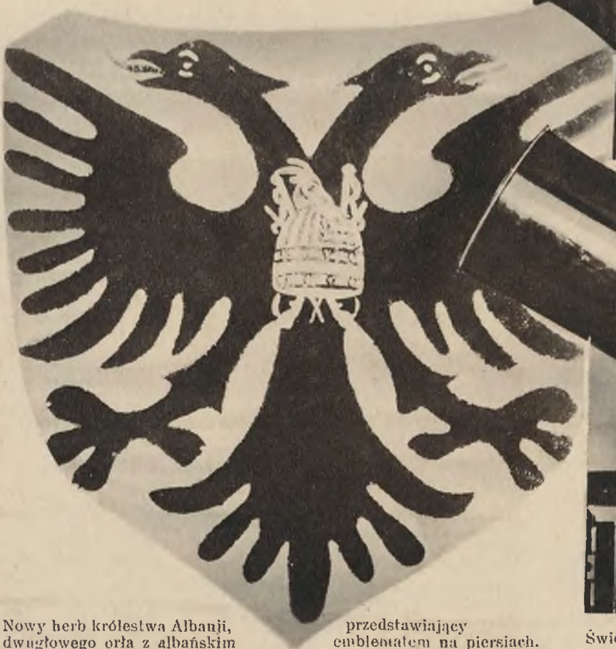
Nowy herb królestwa Albanji, dwugłowego orła z albańskim