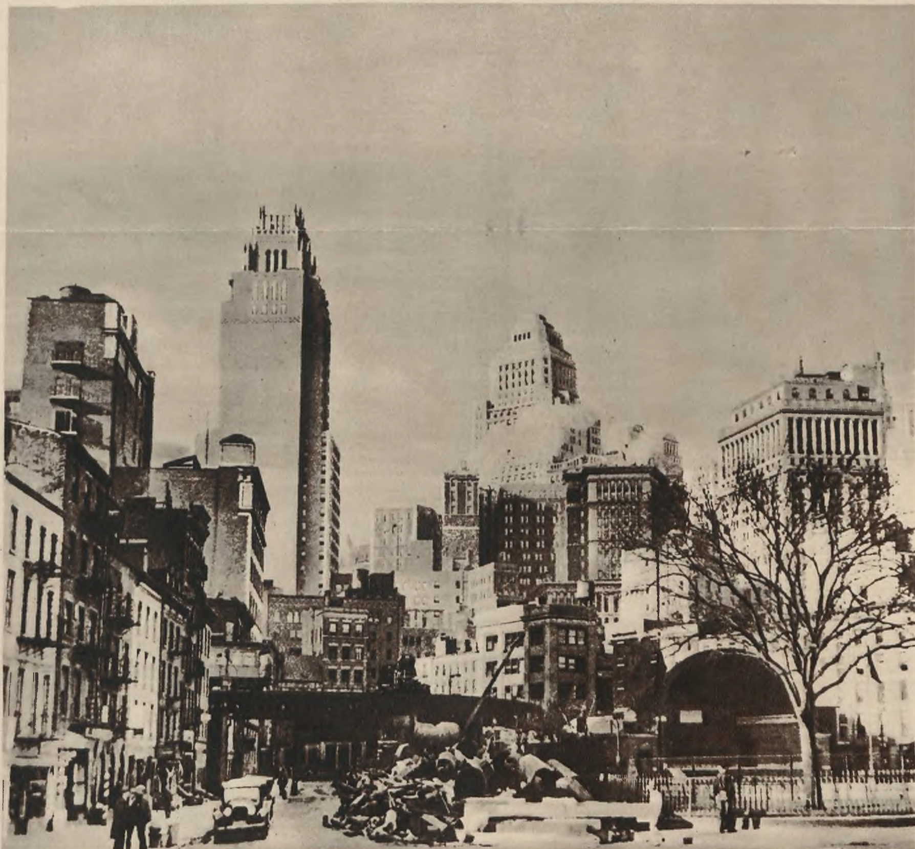
Ciekawe zdjęcie z Nowego Jorku ukazujące naocznie, że tuż obok wspaniałych i olbrzymich drapaczy chmur, znajdują się małe, krzywe domki, które śmiało mogłyby również stać w którymkolwiek prowincjonalnym mieście europejskim.