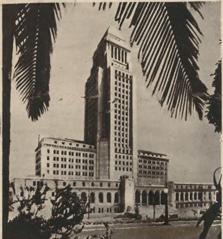
Na prawo: Nowy ratusz w Los Angeles, wysoki na 452 stopy, niemniej zbudowany według wzorów architektonicznych klasycznej.