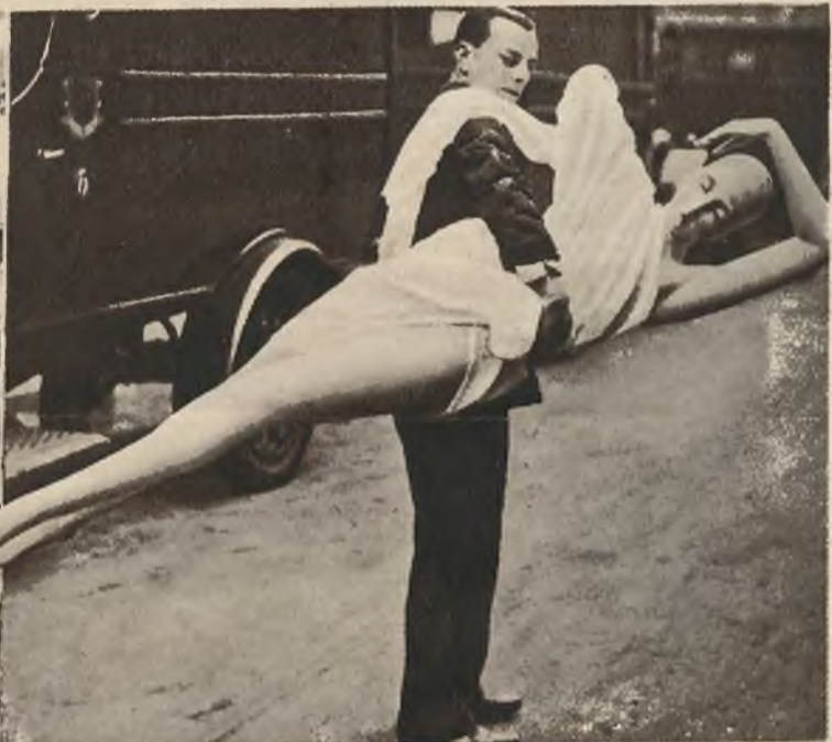
Jedna z artystycznych lalek zdobiących wystawę higieniczną w Londynie.