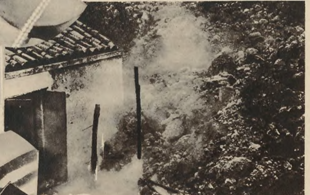
Wybuchy Etny ciągle zagrażają bezpieczeństwu ludności Syeclji. Na zdjęciu widzimy rzekę lawy, zalawającą dom.