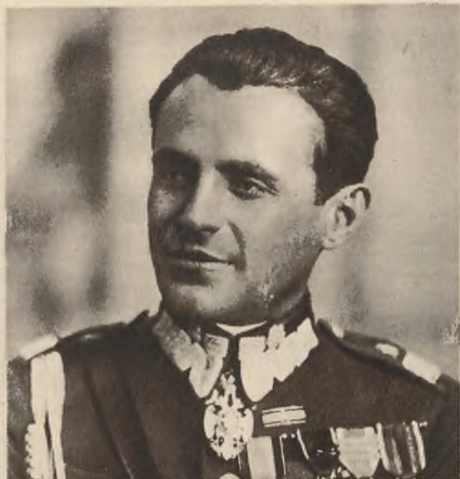
Gen. brygady Michał Karasiewicz-Tokarzewski, szef Biura Personalnego Min. Spraw Wojsk., który w walkach o Lwów przed 10-ciu laty przybył na czele pierwszych oddziałów odsieczy Lwowa. Gen. Tokarzewski wówczas podpułkownik oddziałami oddanymi Mu do dyspozycji z rozkazu Naczelnego Wodza Marsz. Piłsudskiego wyswobodził Lwów z rąk Ukraińców.