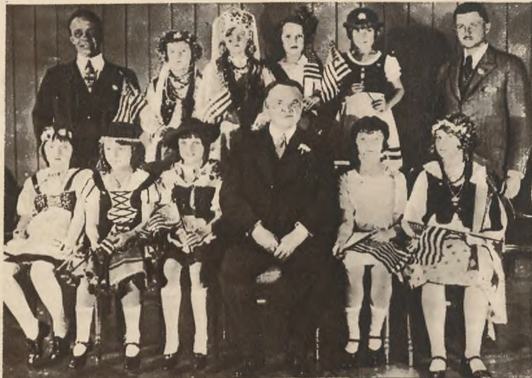
Dzieci emigrantów wszystkich krajów Europy składają hołd nowo obrauemu prezydentowi Stanów Zjednoczonych Mr. Hooverowi.