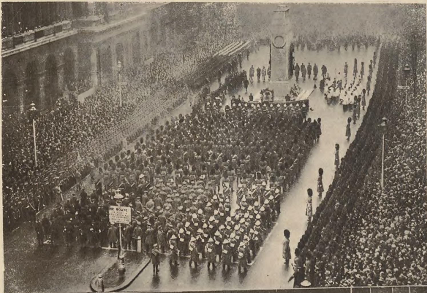
Na lewo: Uroczystość 10-lecia zawieszenia broni w Londynie. Minuta milczenia przed Grobem Nieznanego Żołnierza.