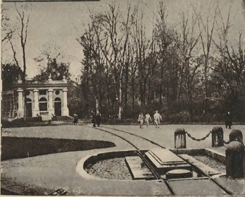
Miejsce w Compiègne, gdzie 11-go listopada 1918 r. zawarto zawieszenie broni. W głębi muzeum zawierające słynny wagon kolejowy marsz. Focha oraz inne pamiątki tego dnia.