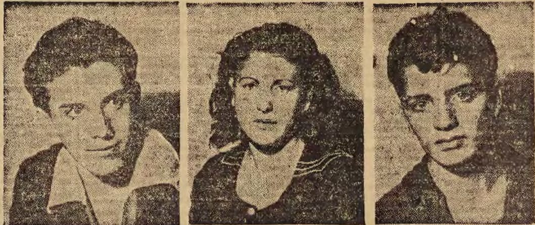
Dziewczynka i dwóch chłopców z grupy hiszpańskiej młodzieży, w powrocie do ojczyzny zatrzymała się jeden dzień w Krakowie.

LISTOPAD 25 Środa Dziś: Katarzyny Jutro: Sylwestra Dziś obowiązuje zaciemnienie od g. 15.00 do 6.30